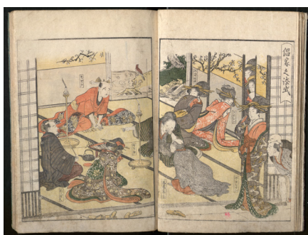
Utamaro, Raillerie envers client infidèle, Almanach des maisons vertes