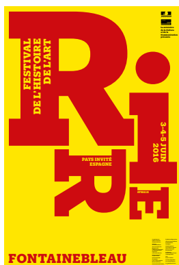
Visuel de la 5e édition du Festival de l'histoire de l'art © Studio Philippe Apeloig