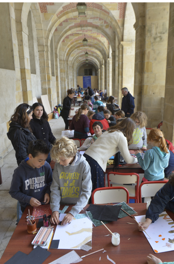
Ateliers pédagogiques - 5 e édition du Festival de l'histoire de l'art

Des visites et des ateliers de pratique artistique sont proposés aux familles et au jeune public sur les thèmes du rire et de l'Espagne : marathon du rire, en partenariat avec la Comédie française, création de masques sortis de l'imaginaire du peintre Miro, ateliers de maquillage clownesque et parcours jeu dans les cours et les jardins, ou encore mise en scène d'une marionnette géante représentant le plus hilarant des hidalgos espagnols : Don Quichotte !