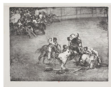
Francisco de Goya, Les Taureaux de Bordeaux : Bravo toro (ou le picador enlevé sur les cornes d'un taureau), 1825