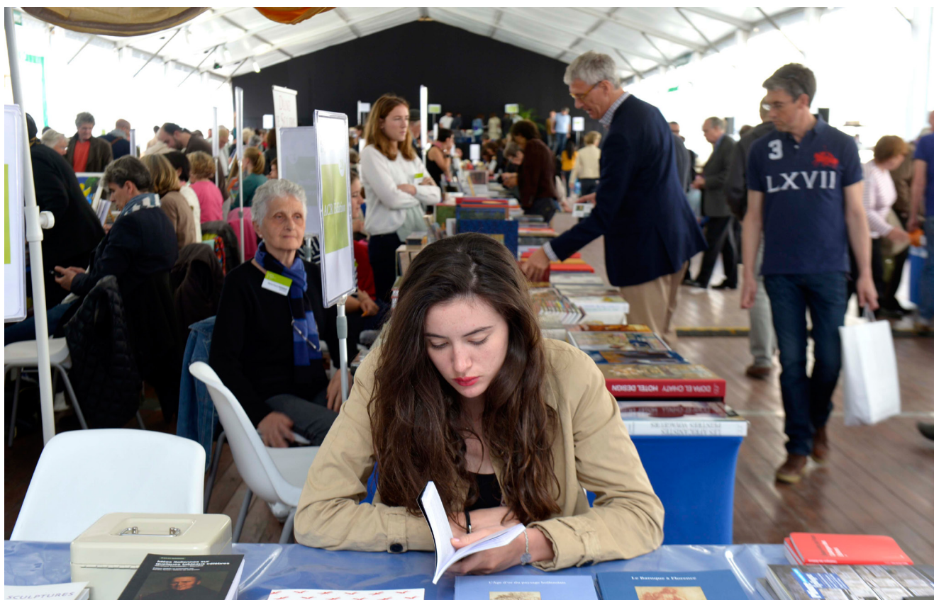
Salon du livre et de la revue d'art - 5 e édition du Festival de l'histoire de l'art

Succès répété d'année en année, le Salon du livre et de la revue d'art plante sa tente dans la cour ovale du château de Fontainebleau afin de présenter au public un panorama de l'actualité éditoriale, du livre d'art à la revue savante en passant par les essais sur l'art, les publications de thèses ou les livres jeunesse. Il a attiré 8000 visiteurs en 2015.