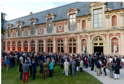
Soirée de clôture de la 5e édition du Festival de l'histoire de l'art