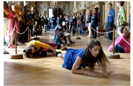
chorégraphiques par des étudiants du Conservatoire national supérieur de musique et de danse de Paris - 5e édition du Festival de l'histoire de l'art