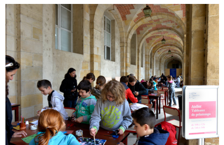
Ateliers pédagogiques - 5e édition du Festival de l'histoire de l'art