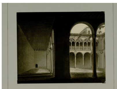
Liger, Vue de Valladolid illustrant le Voyage pittoresque et historique de l'Espagne, par Alexandre de Laborde, v. 1800