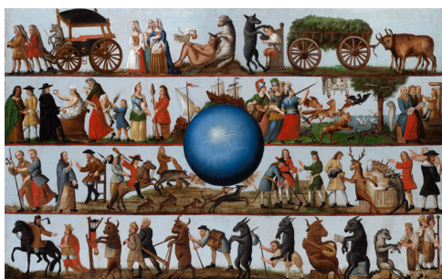
École allemande, Le monde à l'envers (détail), début XVIIIe siècle