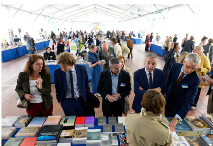
Salon du livre et de la revue d'art - 5e édition du Festival de l'histoire de l'art