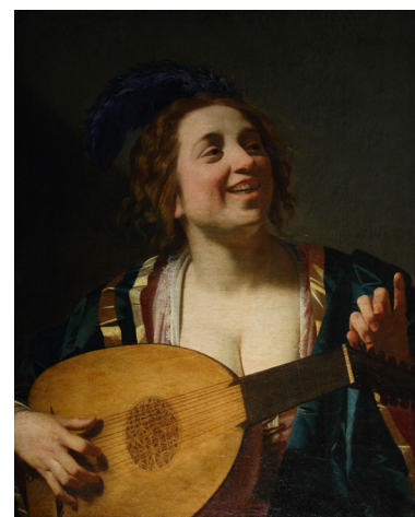
Gerrit Van Honthorst, Femme accordant un luth, 1624