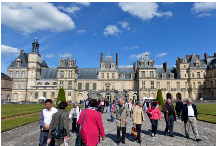
5e édition du Festival de l'histoire de l'art