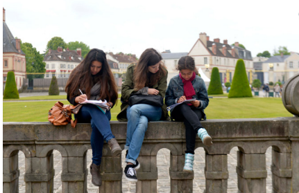
5e édition du Festival de l'histoire de l'art