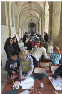
Ateliers pédagogiques - 5e édition du Festival de l'histoire de l'art