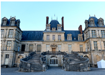
Château de Fontainebleau