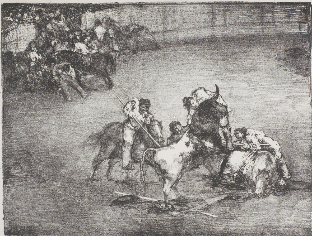
Francisco de Goya, Les Taureaux de Bordeaux : Bravo toro (ou le picador enlevé sur les cornes d'un taureau), 1825

Chaque année, le Festival invite un pays à comparer ses méthodes de recherche, de restauration, d'enseignement de l'histoire de l'art, avec celles de la France. En 2016, l'Espagne est à l'honneur.