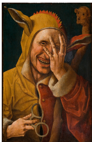
Jacob Cornelisz. van Oostsanen (?), Fou riant, v. 1500