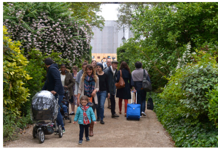
5e édition du Festival de l'histoire de l'art