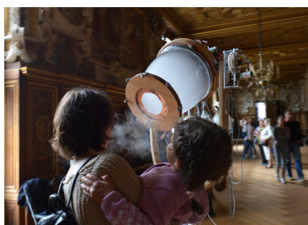
Slow Smell Project - Scents of the Past, Present and Future, oeuvre créée par Christian Zwanikken à l'occasion de la 5e édition du Festival de l'histoire de l'art