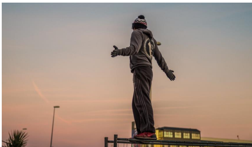
La Générale d'imaginaire – Europe(s)

Des formes théâtrales qui éclairent l'actualité sociale, politique environnementale : EuropeS (création 2019), de la compagnie lilloise La Générale d'imaginaire , questionnera ce qui fait (encore) société européenne, à travers les témoignages de citoyens récoltés à travers le continent. Sous la forme d'une déambulation théâtrale scénographiée avec des barrières Héras dansantes, EuropeS mettra en scène les frontières mais aussi les rassemblements pour ouvrir le débat citoyen et tenter de définir ce qui nous relie.