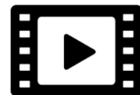
Teaser Baina [na] / G. Bistaki

Et comme chaque année, le partenariat avec les élèves de la formation professionnelle du Centre régional des arts du cirque de Lomme se poursuit. Sous la toile du chapiteau-cirque du Boulon, les élèves de 3 e année présenteront leurs numéros de fin de cursus ( 3 e année en piste ) tandis que les élèves de 2 e année auront l'opportunité de présenter dans l'espace public le fruit plusieurs semaines de laboratoire menées avec le Collectif Protocole (Ne pas toucher) autour du corps circassien présenté sous une forme muséale à ciel ouvert.