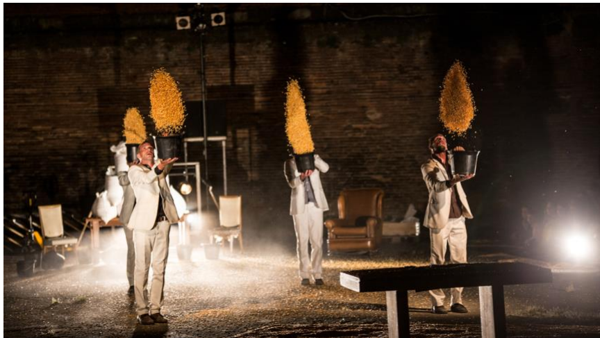
G.Bistaki – Baina [na]

Enfin, du théâtre forain , représenté par L'illustre famille Burattini , dont le spectacle T'as de beaux yeux tu sais, Carabosse – créé en 1968 ! – et Le petit Musée des Contes de Fées – créé cinquante ans plus tard ! - font partie du répertoire de la grande tradition des montreurs de marionnettes ; du théâtre d'objets et de marionnettes sur table, par La cour singulière , qui proposera une petite fable loufoque et métaphorique sur l'esprit de propriété et la peur de l'autre sur fond d'ode à la nature avec Tire-toi de mon herbe Bambi !