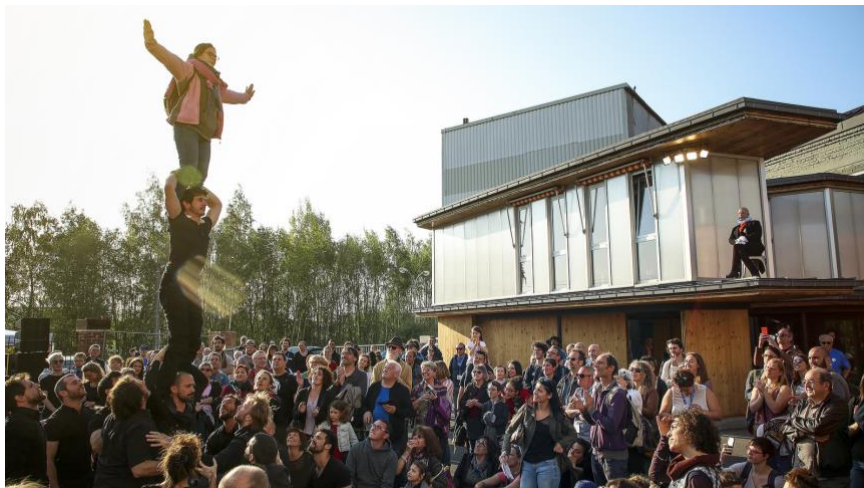
Public des Turbulentes 2018

Un seul mot d'ordre : la convivialité, pour ce festival rassembleur, gratuit, familial et soucieux de sa responsabilité sociétale . Parmi les chantiers en cours, le Boulon mène en effet une réflexion autour de l'accessibilité du festival aux personnes en situation de handicap et propose un village-restauration responsable.