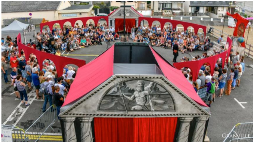
Cie Annibal et ses éléphants – Le grand cirque des sondages