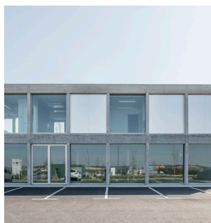
Construction de bureaux et commerces, L'Isle Jourdain (32)

Maître d'ouvrage : Région Occitanie Architecte : W-Architectures [Voinchet & Architectes Associés] Bet général : TPFI Économiste : Alayrac SA Cuisiniste : Gamma Conception HOE : Nobatek