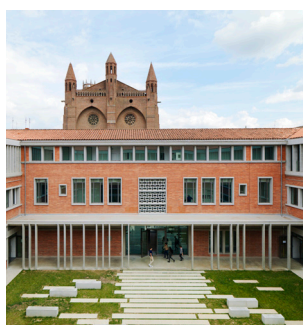
Lycée Pierre de Fermat, Toulouse (31)

Maître d'ouvrage : Région Occitanie Architecte : W-Architectures [Voinchet & Architectes Associés] Bet général : TPFI Économiste : Alayrac SA Cuisiniste : Gamma Conception HOE : Nobatek