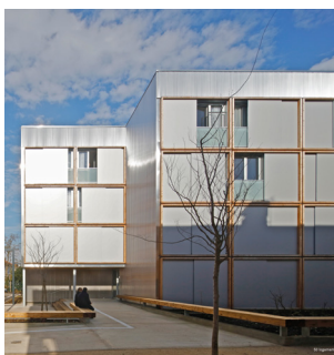
50 logements modulaires en bois, Toulouse (31)

Maître d'ouvrage : Privé Architecte : Lanoire & Courrian