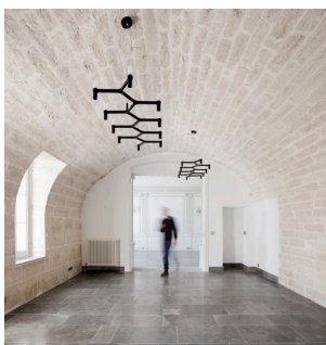
Réaménagement du domaine de Rieucoulon, Montpellier (34)

Maître d'ouvrage : Adoma Entreprise mandataire et BET structure : Pyrénées Charpentes Architectes : ppa•architectures Paysagiste : Emma Blanc Fluides et thermique : Ceercé Economie de la construction : Execo Acoustique : Gamba acoustique Consultant environnement : Soconer