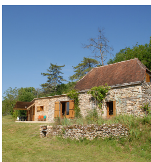
Les Grangettes, Marcihac-sur-Celé (46)

Maître d'ouvrage : Privé Architecte : Lanoire & Courrian