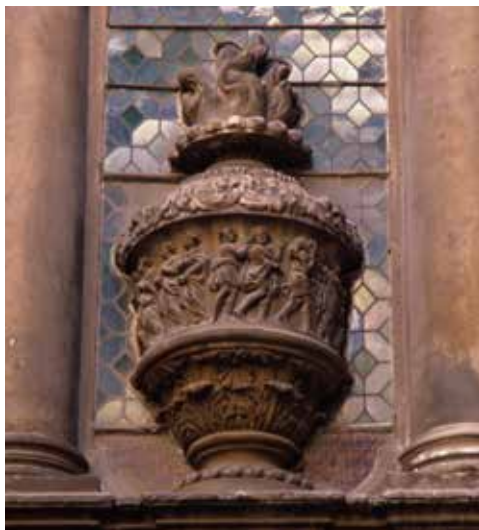
Un des vases du grand escalier.