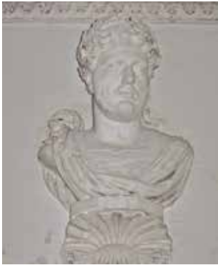
Pézenas, escalier de l'hôtel Lépine. Buste à l'Antique.

Frises de rinceaux peuplée de putti . En haut, gravure de Jean Le Pautre, vers 1670. En bas, Montpellier, hô- tel de Mirman, détail du plafond.