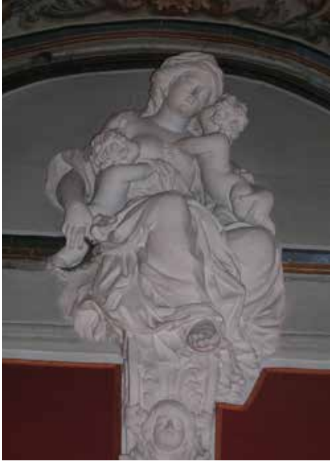
Allégorie de la Charité.

Ces deux décors pourraient être l'œuvre de Jean Sabatier. Ils ont pu être réalisés en 1670, lors du séjour du sculpteur dans la ville. Les visages des Vertus, comme le traitement de leurs vêtements, sont très proches de la Vierge figurant sur la cheminée de l'évêché d'Uzès. Cependant, le motif de la Victoire de l'escalier, déjà utilisé par Jean Sabatier pour le plafond du château de Savignac-le-Haut, est traité dans un style moins habile que le décor de la salle. Peut-être faut-il y voir l'intervention d'un compagnon de l'équipe de Sabatier auquel on aurait confié la réalisation d'un décor placé très haut et destiné à être vu de loin, le sculpteur se réservant le décor des Vertus visible de plus près.