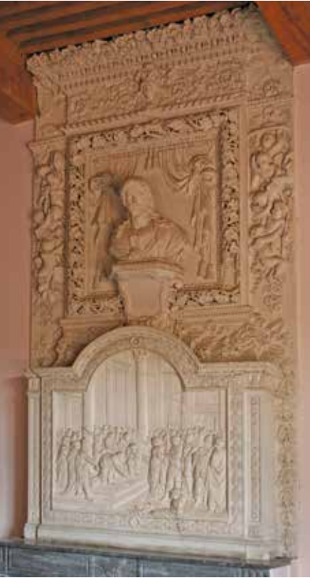
Uzès, ancien palais épiscopal. Cheminée de la chambre de l'évêque.