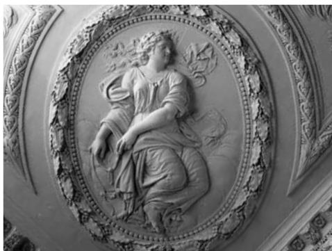
Détail, allégorie de la Tempérance.