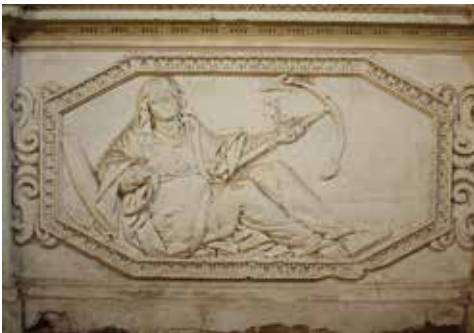
1. Martin (Régis), Ibidem .

La nef de l'église est découpée en trois travées par des pilastres à dossier surmontés d'un chapiteau corinthien de plâtre de très belle facture. Ils supportent une frise décorée de rinceaux d'acanthe, ordonnés de part et d'autre d'un visage féminin. Au-dessus des