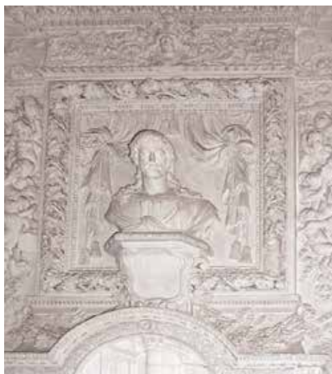
Uzès, ancien palais épiscopal. Cheminée de la chambre de l'évêque, détail.

Le décor de l'église du chapitre de Saint-Paul-de-Fenouillet [1663], les cheminées d'Uzès (vers 1670) et le retable des Pénitents Gris d'Aigues-Mortes [1687] 1 sont les seules œuvres de Jean Sabatier conservées et documentées. L'attribution au sculpteur du décor de Saint-Paul-de-Fenouillet repose sur trois quittances et un état des travaux rédigé par Sabatier lui-même. Ces documents ont disparu mais sont mentionnés dans l'inventaire des archives du chapitre de Saint-Paul-de-Fenouillet dont l'existence a été révélée par Yvette Carbonnel-Lamothe 2 . D'autres documents comme les minutes notariales de Saint-Paul-de-Fenouillet ou d'Alet – où résidait le commanditaire probable du décor, Monseigneur Pavillon – n'ont en revanche rien révélé. Concernant les cheminées d'Uzès, une quittance relative à la