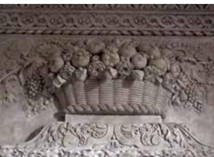
Viviès, château de Gargas. Corbeille de fruits, détail de la cheminée de la chambre à alcôve.

A partir des années 1660, les décors de gypseries se diversifient. Tout en continuant à concevoir des cheminées, les maîtres gipiers réalisent des dessus-de-porte et des décors muraux servant d'écrin à des plafonds de plâtre. Le développement de ce type de décor est certainement lié au prix modeste de la matière première, facile à travailler. Le plâtre, qui prend rapidement, aurait pu être un frein à l'élan créateur des maîtres gipiers mais l'ajout de certains additifs, comme la chaux, en ralentit le temps de prise. Le contrôle de la souplesse et de la plasticité du matériau permet aux artisans de gérer leur temps de travail et de créer des œuvres d'une grande virtuosité technique.