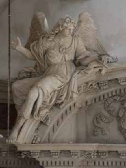
Gard, Aigues-Mortes, chapelle des Pénitents Gris. Retable, détail.

L'église de ces Messieurs (de l'oratoire de Pézenas) est assez bien ornée ; le retable, qui est de plâtre, est d'un goût très fin et a été fait par M. Sabatier, l'un des plus habiles ouvriers de ce pays. Pierre-Paul Poncet, 1733