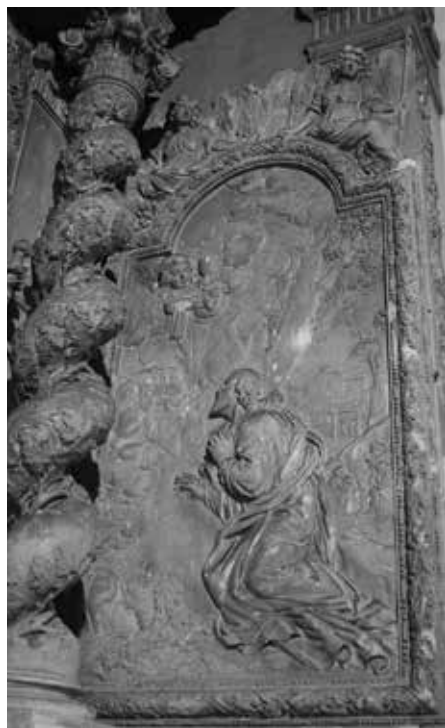
Saint-Paul-de-Fenouillet, église paroissiale.

La sculpture et la luminosité du matériau monochrome, parfois rehaussé d'or, prennent le pas sur les versions languedociennes de ces plafonds, laissant à la narration picturale un compartiment central quelque peu limité. Le peintre