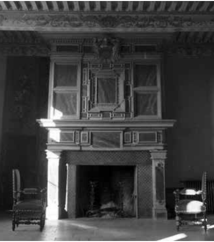
Viols-en-Laval, château de Cambous. Cheminée de la salle.

Quelques cheminées situées dans le département de l'Hérault et bien documentées par les archives permettent de préciser la chronologie de ces ouvrages et d'établir des jalons significatifs pour la connaissance de la gypserie languedocienne. La datation de ces ouvrages permet en effet de les situer dans le deuxième tiers du XVII e siècle, entre 1633, date de la parution des recueils gravés, et les années 1660. Il s'agit des cheminées de la métairie de Creyssel à Mèze, de la maison du meunier au moulin de Roquemengarde près de Montagnac et du château de Cambous à Viols-en-Laval près de Montpellier.