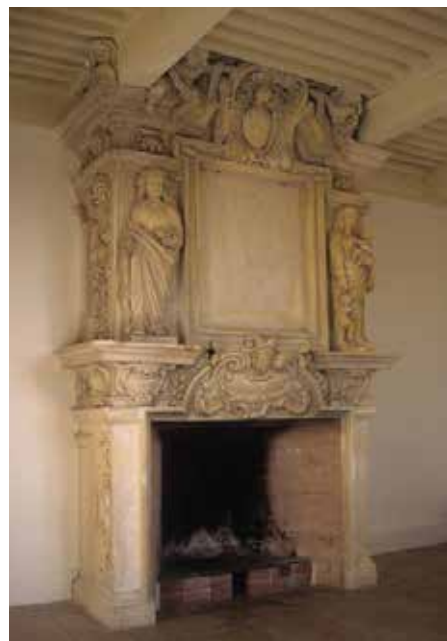
Viols-en-Laval, château de Cambous. Cheminée de la chambre.