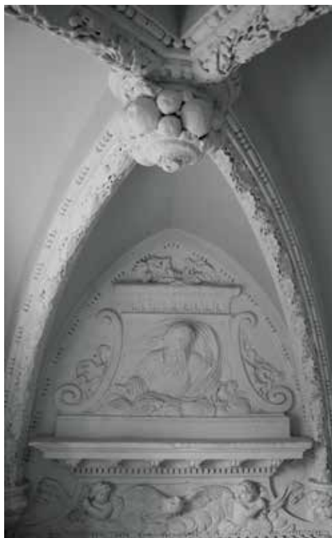
Chapelle latérale, voûte et fronton d'un retable.

Sur la frise du retable suivant, deux anges tiennent un cartouche. La partie supérieure est ornée d'une colombe du Saint-Esprit. Le