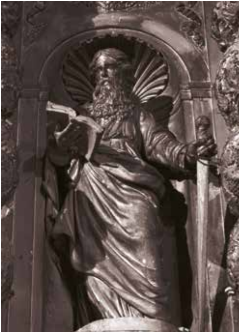
Statue de saint Paul.

La travée centrale a reçu un deuxième corps, surmonté d'un fronton triangulaire. La traditionnelle figure de Dieu le Père, que l'on retrouve souvent à cet emplacement, a été