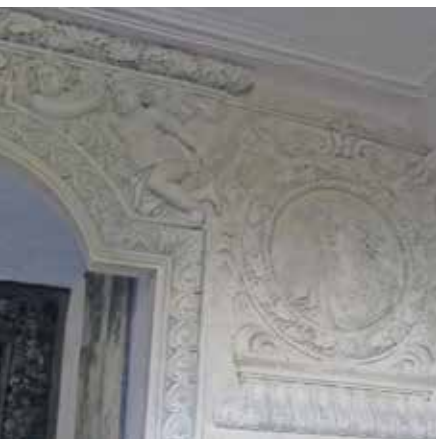
Viviers, château de Gargas. Détail d'une alcôve.