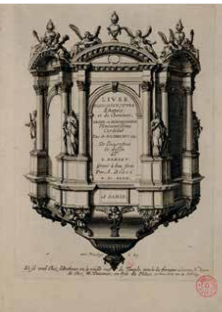
Jean Barbet et Abraham Bosse, Livres d'architecture d'autels et de cheminées , Paris, 1633.