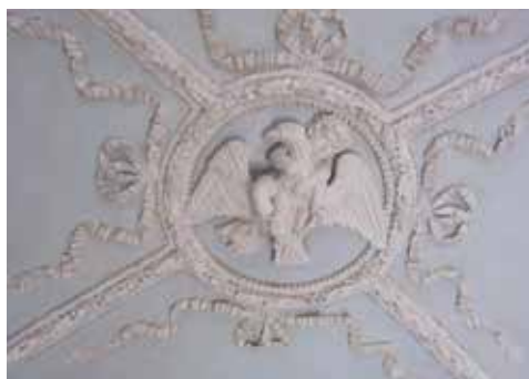
Décor central de la voûte du vestibule.