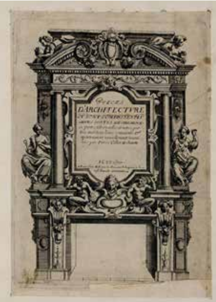
Pierre Collot, Antoine Lemercier, Pièces d'architecture où sont comprises plusieurs sortes de cheminées [...] , Paris, 1633.