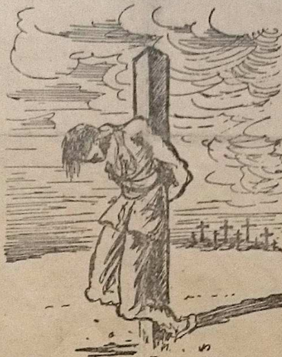
Le sang des martyrs n'a jamais coulé en vain

Tel est Celui dont nous sommes héritiers. Il avait montré la voie et les premiers chrétiens n'ont pas hétéié à le suivre jusqu'au Calvaire, en supportant vaillamment les diffusions, les arrestations, les emprisonnements, la torture et la mort. N'ont-ils pas été les initiateurs du monde à la suite clandestine quand, malgré la férocité des Césars,