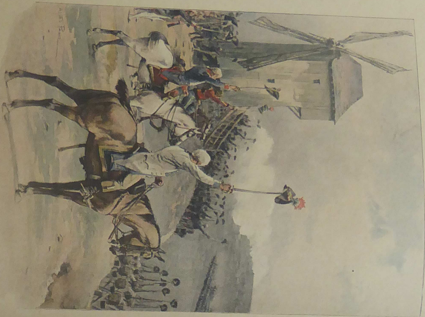
Valmy (20 Septembre 1792)