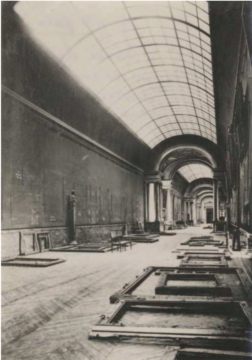
Musée du Louvre. La Grande galerie abandonnée