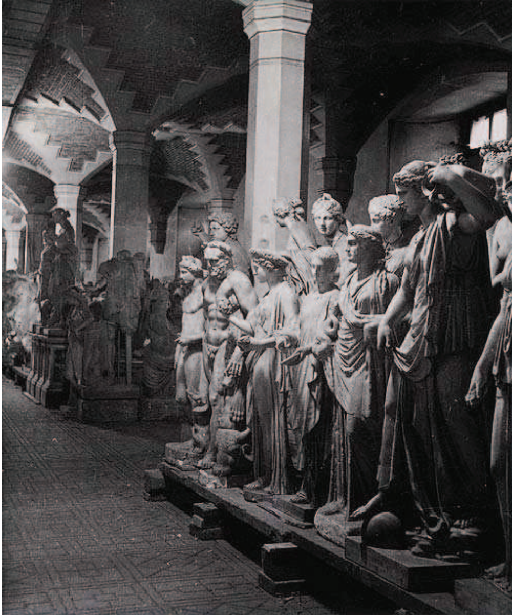
Les Statues du Louvre pendant la guerre 1940

1940