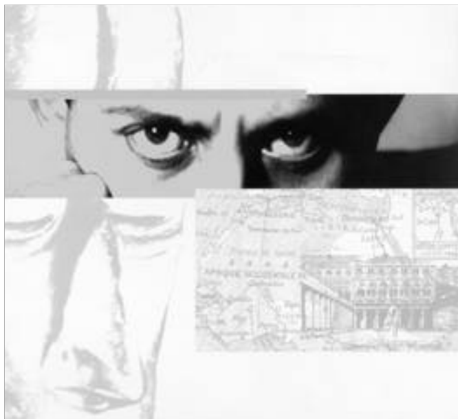
Visuel réalisé pour l'exposition « Malraux, l'Afrique, la culture » (déc. 1998-fév. 1999), au Centre des archives d'outre-mer (Aix-en-Provence).

Pour les années 1981-1988 – ministères Lang et Léotard –, le Comité d'histoire a recueilli le témoignage des administrateurs qui étaient en poste – aux Finances comme à la Culture – au moment où le budget du ministère de la culture a doublé (1981), fait sans précédent dans l'histoire de la politique publique de la culture et dans l'histoire administrative tout court. L'action et la politique du ministère de la culture en ont été considérablement transformées et élargies. Ces entretiens renouvellent en profondeur la vision que les universitaires ou journalistes de cette époque avaient retenue. Aussi, sans attendre les trente ans de rigueur, les ministres de l'époque ont accepté d'ouvrir dès maintenant leurs archives aux chercheurs. Le Comité s'est lancé dans une confrontation assez inhabituelle entre archives écrites et archives orales sur une période éloignée de seulement vingt ans. L'audition de témoins qui étaient fort jeunes quand ils ont pris les commandes et qui se souviennent donc encore parfaitement des enjeux, des stratégies et des difficultés de mise en œuvre, se révèle une expérience passionnante et prometteuse. Une douzaine de témoins