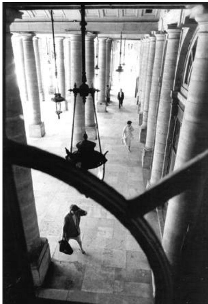
Paris, le Palais Royal : vue des arcades.