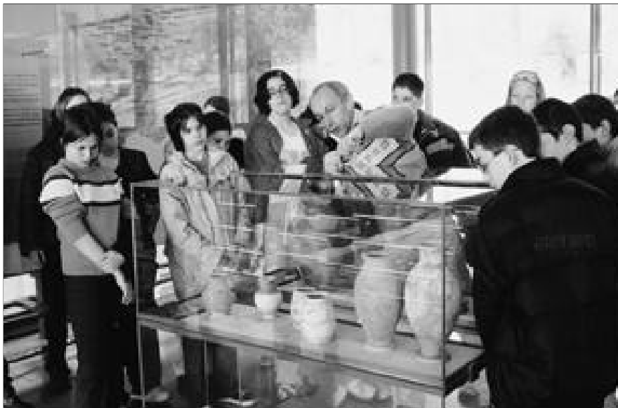
Groupe scolaire en visite au musée de Bibracte.

Dans les termes de A. Appadurai, on assiste à des « tournois de valeurs » qui mettent en jeu des processus complexes d'assignation et d'appropriation 5 . Ainsi l'émulation savante et la rivalité pour la jouissance des choses s'exacerbent l'une l'autre. L'assimilation de l'« ami » de tels ou tels objets à leur porte-parole