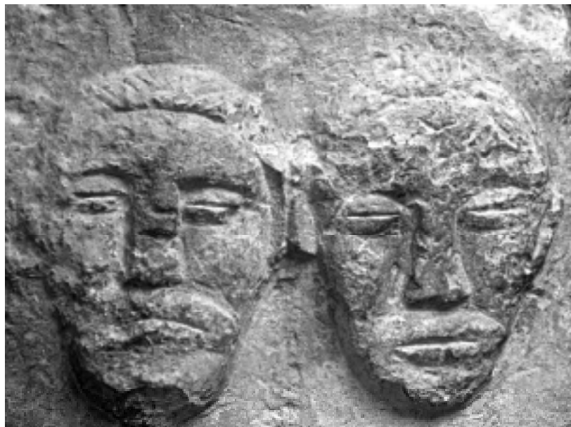
Ce bloc sculpté faisait partie d'un lieu culturel.