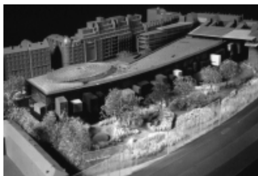
Maquette du Musée du Quai Branly.

Le Musée du quai Branly est conçu pour réunir les collections du Laboratoire d'ethnologie du Musée de l'Homme et du Musée national des arts d'Afrique et d'Océanie dans une double optique : les présenter au public à l'aune d'une muséographie renouvelée et les rendre accessibles aux chercheurs afin de relancer les études sur l'objet issu des cultures d'Amérique, d'Afrique, d'Asie et