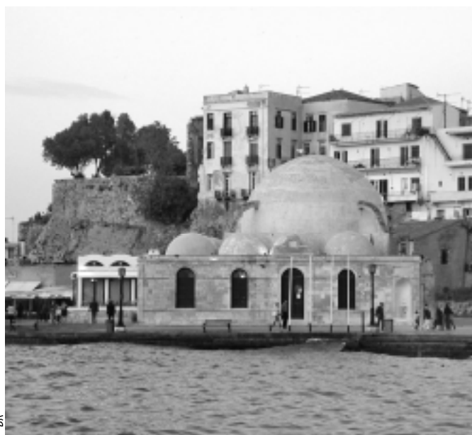
Le port de La Canée (Crète) : la mosquée turque.