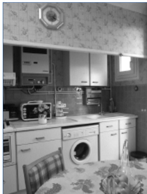
Inventaire photographique sur le thème de la cuisine dans le logement pour une exposition en préparation sur les modes d'habiter. L'enquête comprend l'analyse de 40 opérations des années 30 à nos jours. Collection Ecomusée de Saint-Quentin-en-Yvelines.

Créés souvent sur des territoires en pleine mutation, ces musées ont accompli un important travail d'inventaire, d'étude et de conservation qu'il s'agisse de paysages, de savoir-faire ou de