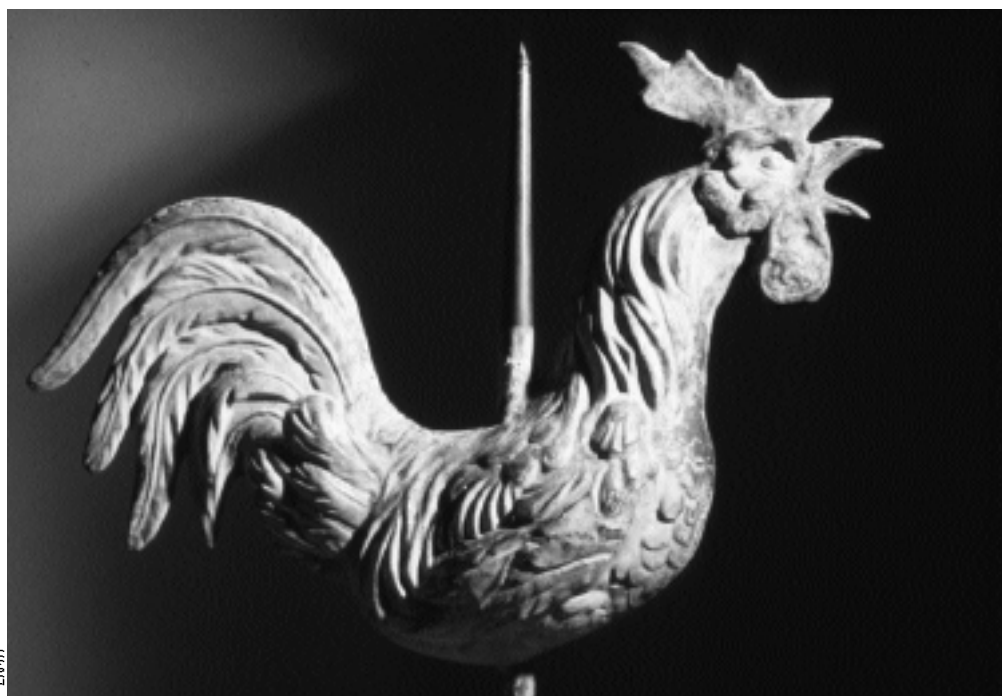
Coq de clocher en cuir repoussé in Préserver les objets de son patrimoine.