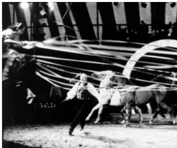
Le cirque classique, un spectacle actuel

Etude réalisée par Sylvestre Barré dans le cadre de l'appel d'offres " Ethnologie de la relation esthétique ". Lancé en 1999 et renouvelé en 2000, cet appel d'offres visait à explorer, avec les outils de l'ethnologie, de l'anthropologie et de la sociologie le jugement de goût et les constructions esthétiques.