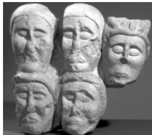
Ces têtes étaient posées sur les genoux d'un guerrier accroupi.

Au II e siècle avant notre ère, dans l'arrière pays de Marseille, Entremont, place forte au cœur du territoire du peuple gaulois des Salyens, a laissé de nombreux témoignages du mode de vie de ses habitants. Les vestiges de l'habitat, les outils, bijoux et autres objets de la vie quotidienne témoignent d'un cadre technique évolué, loin de toute la "barbarie" qui est attachée traditionnellement aux Gaulois. Ils témoignent aussi d'une civilisation originale, fondée sur l'affirmation politique d'une classe aristocratique, et des mutations, au contact des cultures grecque et romaine, que connaît ce peuple, avant qu'il ne