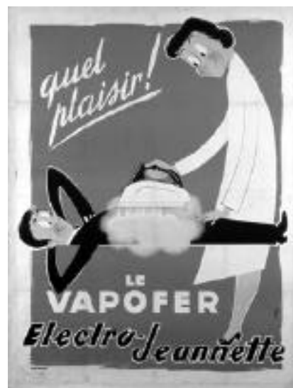
© Affiche Bob et Hage, cl. Bibl. Foney

Recherches expérimentales du neurobiologiste et spécialiste de l'autisme S. Baron-Cohen, enquêtes d'ethnologues sur des transgenres et des transsexuels, d'endocrinologues, psychiatres et chirurgiens (qui réalisent le passage vers l'autre sexe), ou encore analyse du sociologue Goffman de la manière dont les hommes et les femmes se donnent à voir aux autres et à eux-mêmes : la réalité d'un brouillage des frontières homme/femme est ici examinée. L'égalité des sexes est aussi abordée, avec des études sur les congés parentaux en Suède, le statut des veuves dans la Russie traditionnelle ou l'évolution des formes de la parenté saisies