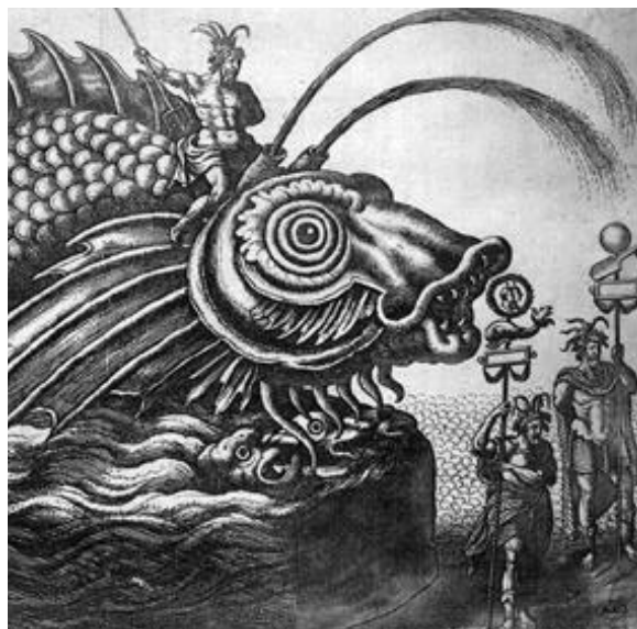
Cérémonies et fêtes publiques. Album Maciet 147/3.126 (détail).

Soucieuse de cette situation, la bibliothèque a entrepris la numérisation de cette collection en répondant à l'appel à projets lancé en 2000 par le ministère de la culture et de la communication. La numérisation est de type « livre ouvert », ce qui signifie que c'est la page qui est l'unité de base pour la numérisation. Il n'a pas été envisagé, dans le cadre de cette pres-