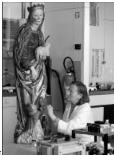
IRPA (Bruxelles), atelier de restauration des sculptures en bois polychromé: intervention sur la couche picturale d'une sculpture allemande du XVI e s.

En 2001, l'IRPA a envisagé la numérisation des 6000 dossiers de restauration des œuvres traitées dans les divers ateliers. L'informatisation des données s'est alors avérée indispensable au vu de l'importance croissante des archives. La saisie des données dans une base spécifiquement adaptée aux besoins des restaurateurs allait permettre une consultation plus rapide des dossiers, éviter les dégradations et pertes dues aux manipulations des documents, et offrir un moteur de recherche statistique. Dans le cadre de l'étude des besoins de la conservation, préalable à la création de la future base de données de l'IRPA, les restaurateurs et informaticiens du département «documentation» sont entrés en contact avec Geneviève