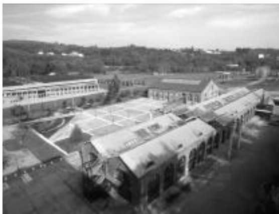
Le Creusot, plaine des Riaux : cœur industriel de la ville au temps des Schneider, la plaine des Riaux est en pleine mutation ; au développement des industries de pointe en lieu et place des activités minières et sidérurgiques s'ajoutent des transformations fonctionnelles au sein d'espaces et de bâtiments hérités de la « grande époque » creusotine. Le centre universitaire Condorcet est implanté dans un ancien bâtiment de réparations de machine, l'atelier des « grues et locos » est transformé en bibliothèque universitaire. Enfin, la résidence universitaire construite en 1993 comme un pont entre la ville et la plaine des Riaux exprime les liens entre l'espace urbain et l'ancien espace industriel ainsi que le développement de l'urbanisme sur une zone traditionnellement dévolue à l'activité industrielle.

Cette typologie des postures correspond à une typologie des formes artistiques entreprises et des formes de relations plus ou moins engagées que les artistes entretiennent avec les populations. Ajoutons que les conditions objectives de la commande ou du projet conditionnent également le déroulement de ces productions mémorielles. Dans les meilleurs cas, le temps donné, l'éthique qui préside à l'opé-