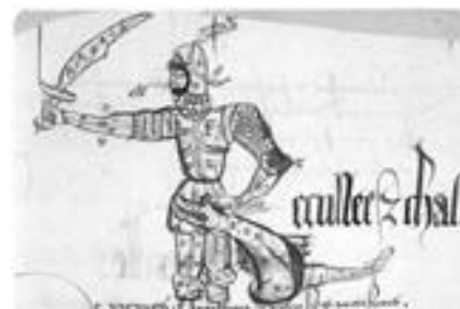
BM Angers, ms 1756 (XV e -XVI e s.)

En mars 2004, la base Enluminures a enregistré 23 938 requêtes et 27 866 images ont été vues. Ouverte en septembre 2002 et administrée par la direction du livre et de la lecture, cette base propose la consultation gratuite des manuscrits médiévaux enluminés conservés dans les bibliothèques municipales. Elle présente aujourd'hui à la consultation plus de 14 500 images d'enluminures numérisées avec le concours de l'IRHT (CNRS) et de la mission de la recherche et de la technologie (dans le cadre du plan national de numérisation du ministère de la culture). Bénéficiant d'enrichissements annuels, elle