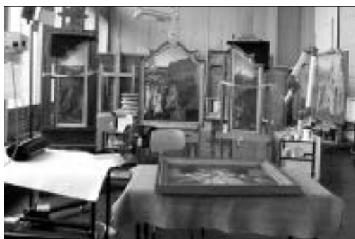
IRPA (Bruxelles), atelier de restauration des peintures.

L'Institut royal du patrimoine artistique de Bruxelles, créé en 1948, existe dans sa forme actuelle depuis les années 1960. Il fut parmi les premiers instituts au monde conçu spécifiquement pour une approche interdisciplinaire de la conservation et de la restauration des biens culturels et artistiques. Ses activités de recherche, réparties au sein de trois grands départements regroupant historiens de l'art, photographes, chimistes, physiciens et conservateurs-restaurateurs, ont généré une masse importante de documentation et d'archives concernant les divers aspects de l'art en Belgique : monu-