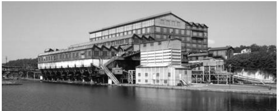
Le Creusot, lavoir des Chavannes (tri et lavage du charbon) : construit en 1926, remanié après la Seconde Guerre mondiale, automatisé à partir de 1989, il cesse de fonctionner fin 1999.

L'expression «mémoires à l'œuvre» doit être entendue en deux sens: comme ce qui surgit ou résulte de ces actions instituées pour permettre un travail de deuil et de projection partagée; comme ce qui s'institue et se récite de la ville et de la vie citadine par d'autres voies que celles de l'action publique.