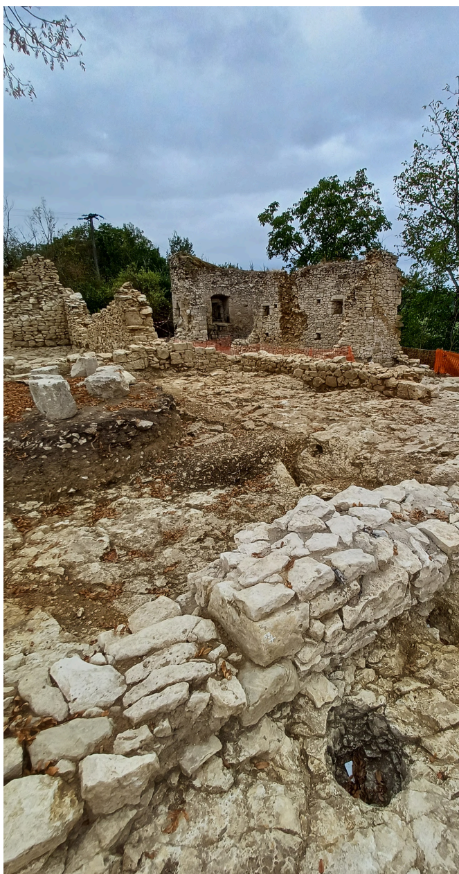
Montaut-le-Jeune (47), Le Château, INRAP.

Des expositions temporaires retracent régulièrement le parcours des objets, de leur découverte sur le terrain jusqu'à leur présentation en vitrine.