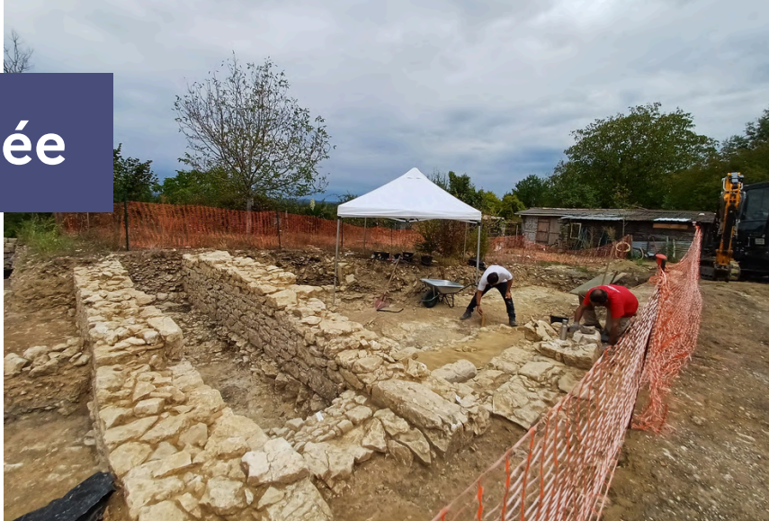
Montaut-le-Jeune (47), Le Château, INRAP.