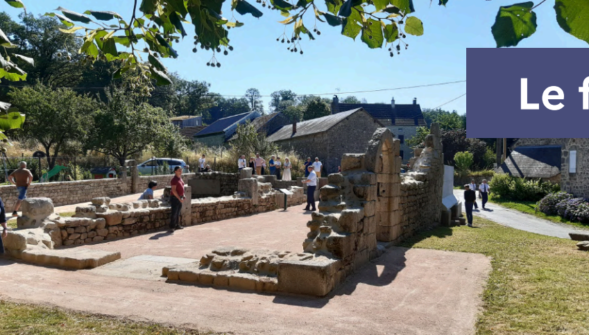
Moutier-Rozeille (19), Saint-Hilaire, Ministère de la Culture.

Le financement du dispositif repose sur un principe de solidarité nationale via une taxe affectée, la taxe d'archéologie préventive (art. L.524-2 du Code du patrimoine).