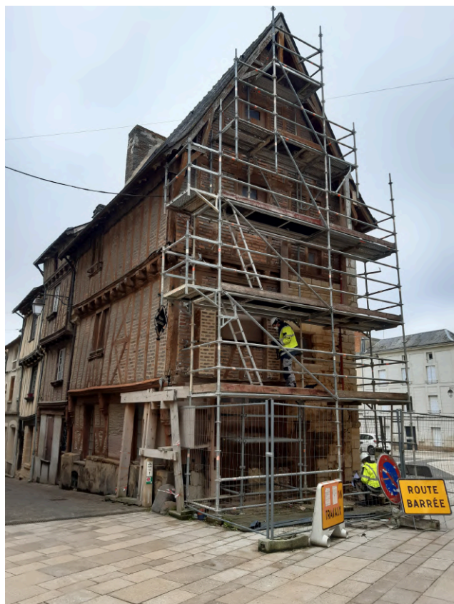
Thouras (79), Maison des Artistes, Atemporelle.