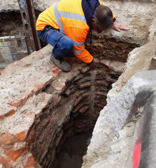
Agen (47), point d'apport volontaire (PAV), INRAP.