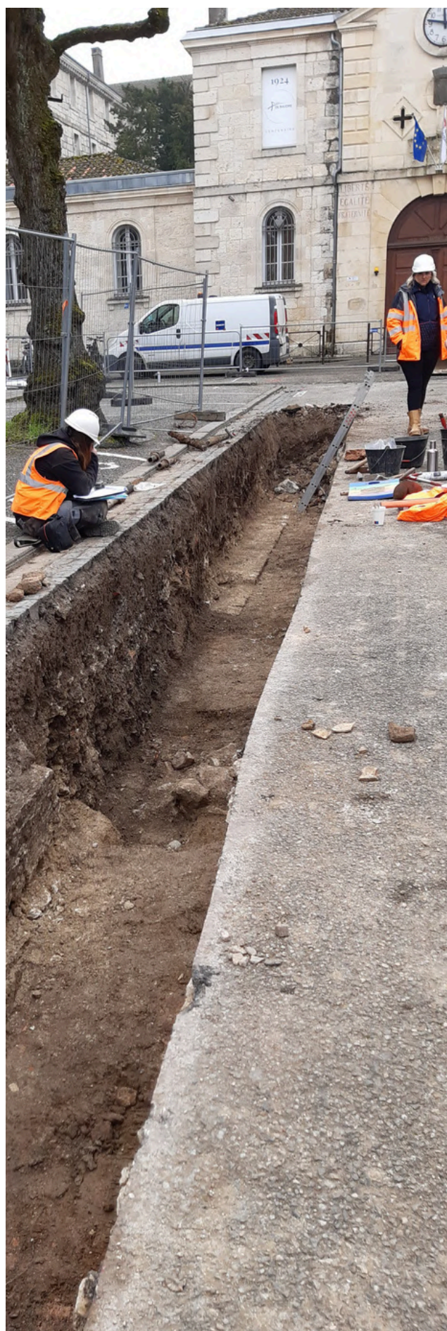
Agen (47), réseau de chaleur urbain, EVEHA.