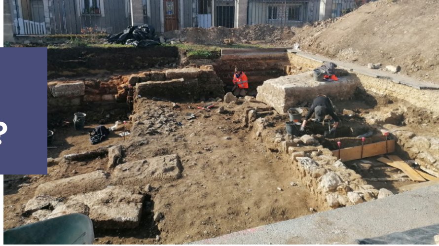
Périgueux (24), Cité administrative, Hadès.