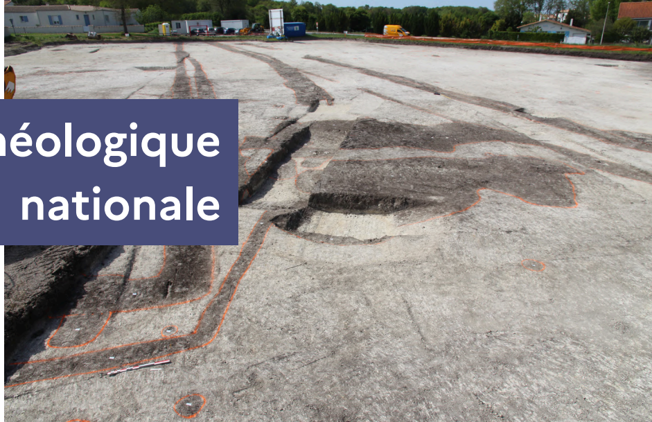
Saint-Sulpice-de-Royan (17), Les Deux terrages, Service archéologique départemental de Charente.