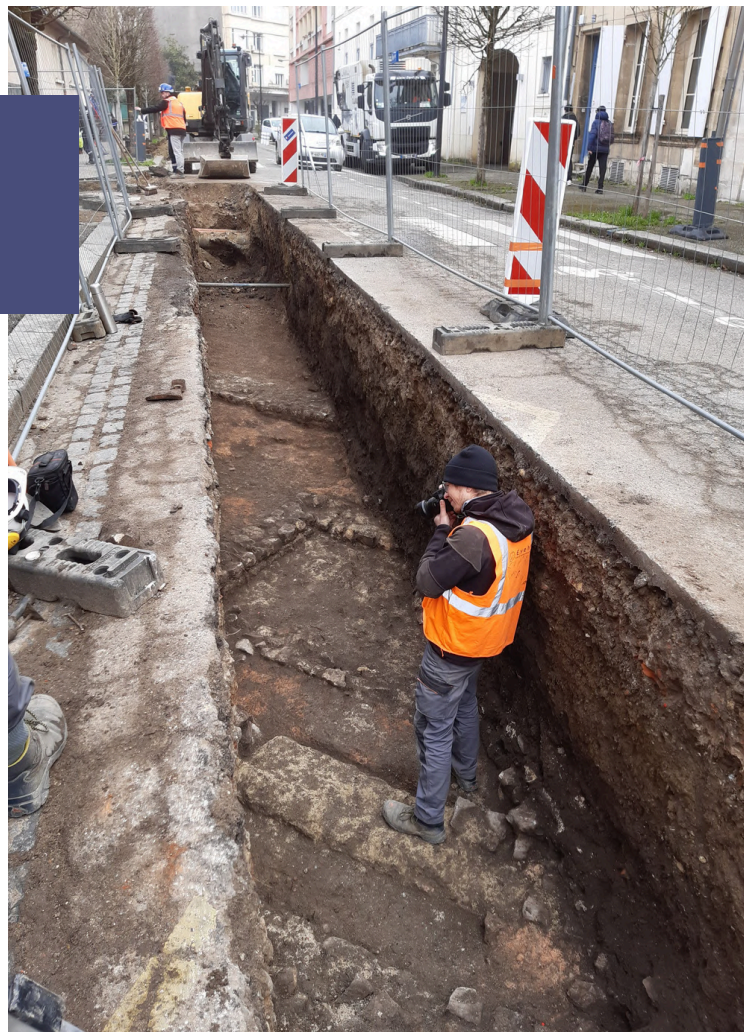
Agen (47), réseau de chaleur urbain, EVEHA.