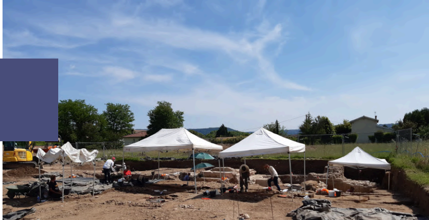
Villeneuve-sur-Lot (47), rue Bourlange, INRAP.