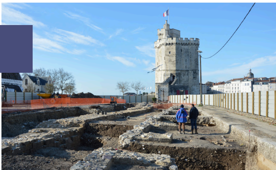
La Rochelle (17), rempart du Gabut, INRAP.