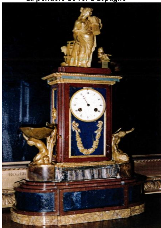
CLICHE DE LA PENDULE PRIS DANS LES ANNEES 80 CHEZ L'ACQUEREUR, PAR L'ANTIQUAIRE VENDEUR © DR

En 1981, le Mobilier s'alarme de la disparition d'une pendule, déjà signalée manquante en 1979, qu'il a déposée à la résidence de l'ambassadeur de France à Washington en 1925. Il s'agit d'une pièce assez exceptionnelle, réalisée en 1813 à partir d'éléments d'un surtout de table, offert cinq ans plus tôt par le roi Charles d'Espagne à l'empereur Napoléon Ier. En 1961, la pendule a été remise au grenier, puis vendue à un antiquaire en 1973, avec d'autres « objets et décombres » de ce grenier, en dépit des textes qui prévoient l'inaliénabilité des biens du domaine public.