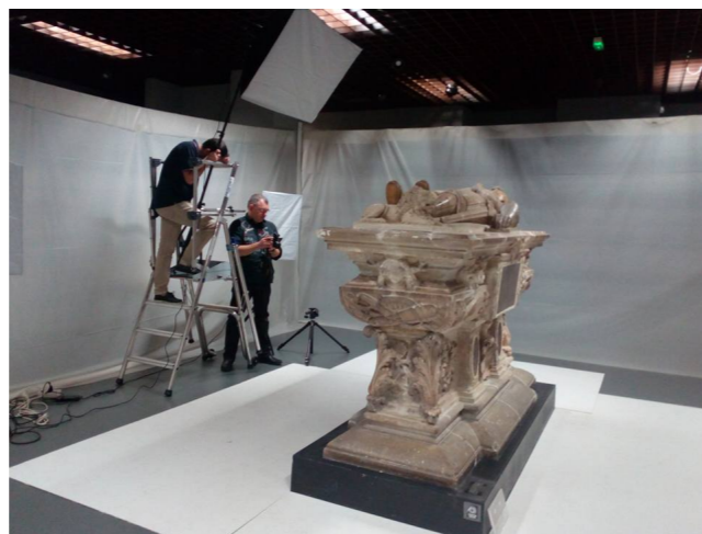
Prise de vue au musée d'Aquitaine, Bordeaux.