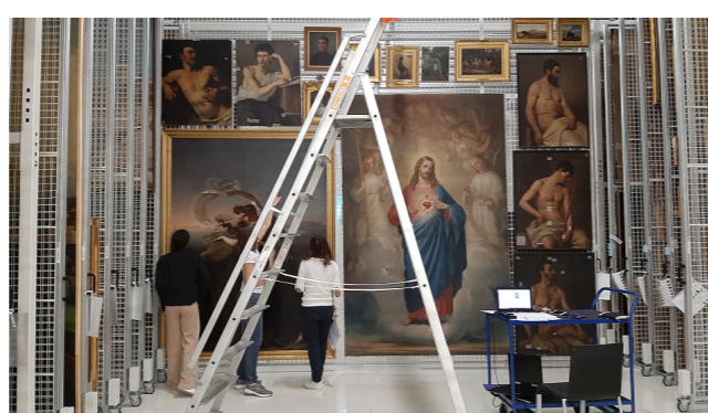
Récolement au musée Granet d'Aix-en-Provence © CRDOA, ou juste © CRDOA