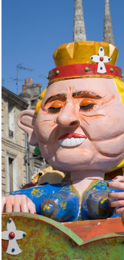
Sa Majesté Aliénor d'Aquitaine au Carnaval des deux rives de Bordeaux - Gironde