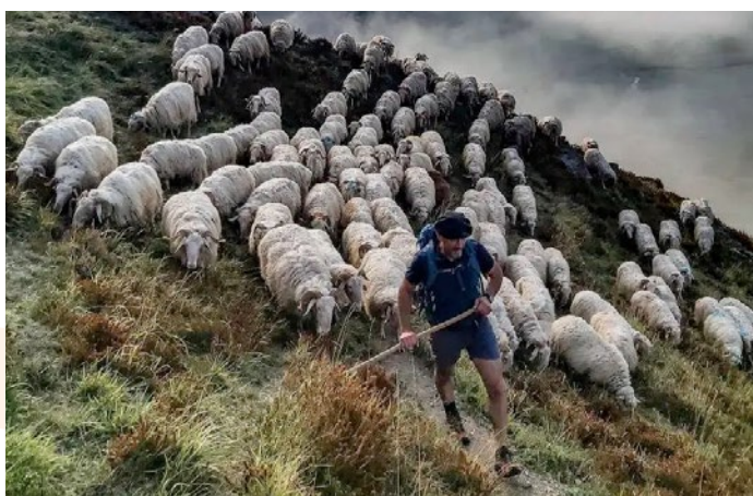
La transhumance

Cet agenda permet d'identifier facilement les manifestations organisées près de chez soi ou dans la région de son choix, avec des informations pratiques (type d'événement, domaine du PCI concerné, date, horaires, public concerné, gratuité, etc.) qui facilitent le passage à l'action et l'envie de participer.