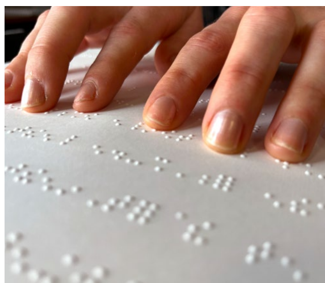
La lecture du braille