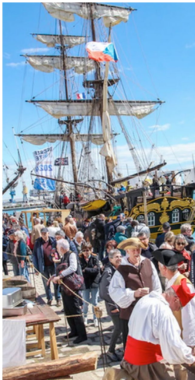
Fête des traditions maritimes Escale à Sète - Hérault

À destination des adultes - Payant (sur réservation)