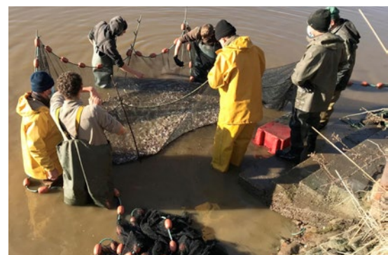
Resserrement du filet sur fond de pêche en Brenne - Indre

En Brenne, par exemple, la pisciculture s'appuie sur des pratiques anciennes de gestion des étangs et des ressources aquatiques. Ce savoir-faire, toujours vivant, concilie préservation de la biodiversité et activité économique durable au bénéfice des communautés rurales.