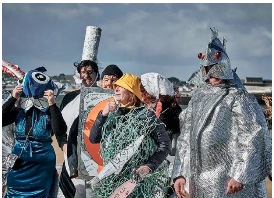
Les sardinières au Carnaval de Gâvres - Morbihan