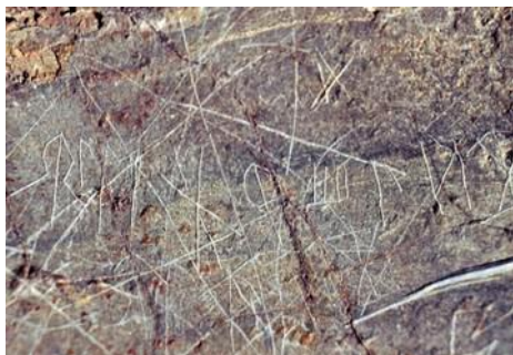
Gravures d'écritures ibères