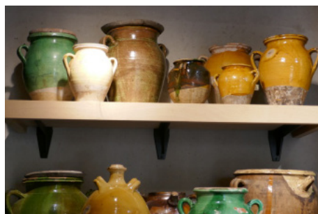
© Maison Rouge - Musée des vallées cévenoles