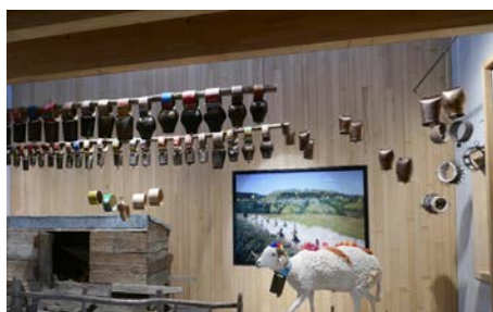
L'élevage, diorama

Bien que doté de qualités architecturales intéressantes, le site présentait des faiblesses en terme de conservation et de présentation : réserves insuffisantes, manque d'espace boutique, d'espaces vidéo et interactif, d'espaces consacrés aux expositions temporaires, aux conférences, aux animations dynamiques, aux animations pédagogiques, manque d'atelier de préparation d'expositions... L'opportunité d'investir l'ancienne filature de soie de Maison Rouge est devenue évidente. Doté d'une architecture remarquable (ensemble inscrit à l'Inventaire des Monuments Historiques), chargé d'histoire et de mémoire, ce lieu perçu comme un symbole, convenait à la réalisation d'un projet muséographique ambitieux voulu par Alès Agglomération pour le territoire.