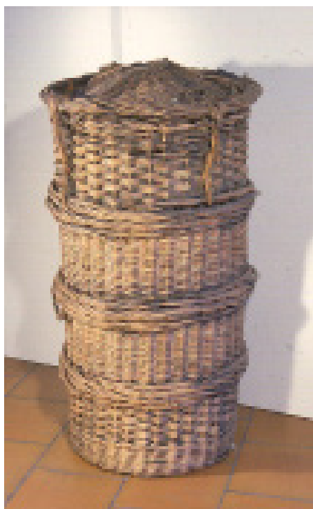
Gorbin - pour l'élevage des vers à soie