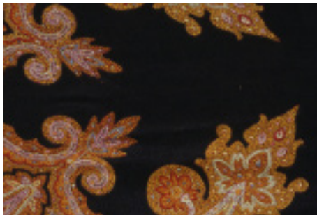
Détail d'un châle de soie