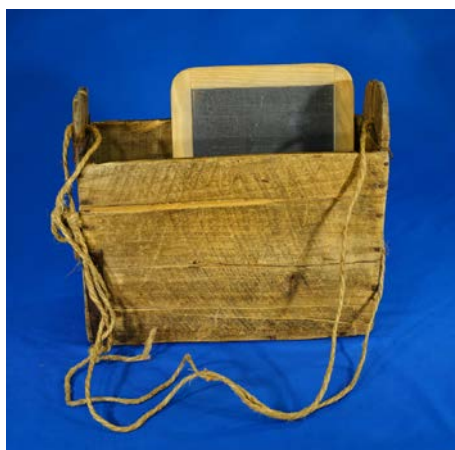
Cartable d'écolier

Le Musée des vallées cévenoles est le lieu privilégié de préservation et de valorisation du patrimoine cévenol. Mais au delà de ses fonctions naturelles de conservation, de recherche et d'études à caractère scientifique, le musée se veut également :