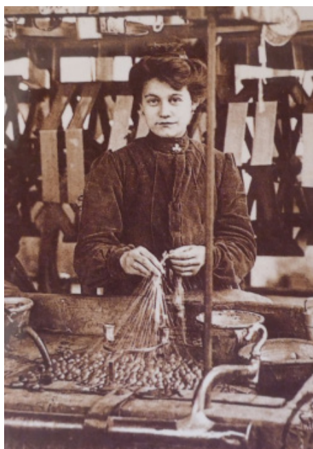
© Maison Rouge - Musée des vallées cévenoles

La boutique librairie est ouverte aux horaires du musée et propose une sélection du meilleur des Cévennes. Sac du berger, carré de soie, confiture gourmande et gâteaux croquants se partagent les étals.