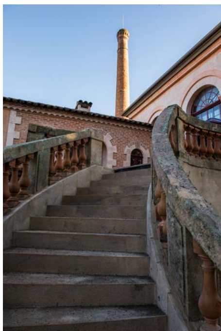
L'entrée du musée