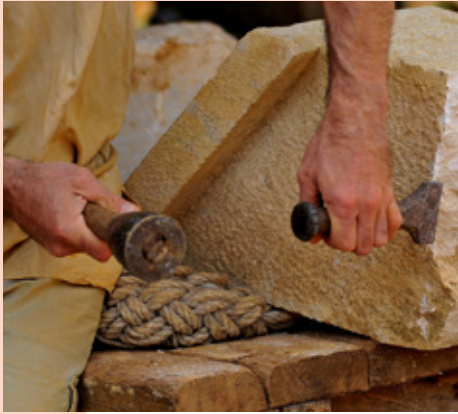
© Michel Castillo - Département des Pyrénées-Orientales