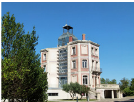
© Eau Sea Blue - "Entre Ciel et Mer" - Réal.: Cyril Tricot