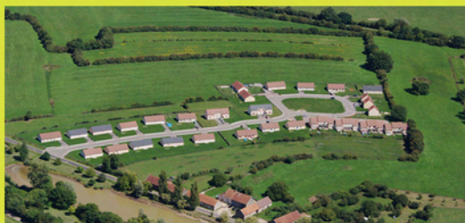
Une urbanisation sans rapport avec son contexte.