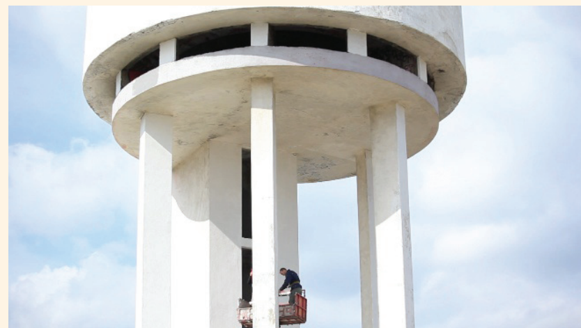
Matthieu Martin Refresh the Revolution , 2012 vidéo couleur HD, sonore, 10,51 min.