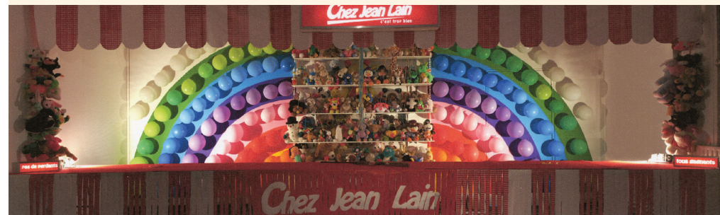
Jean Lain C'est trop bien ! 2008

Des typographies pailletées, des lumières colorées, des néons des ballons et des pâtisseries, un « bling bling » assumé, tout l'univers de Jean Lain se déploie comme une fête inachevée et fantomatique, la vitrine d'un monde en suspens où la main de l'artiste s'efface au profit de l'image.