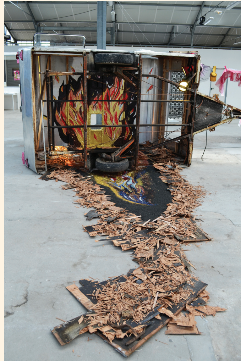
Romuald Dumas-Jandolo Dans les flammes , 2013

Comme le suggère la fonction nomade de la caravane, le projet de Romuald Dumas-Jandolo tend avant tout à favoriser échanges et rencontres autour de l'oeuvre, ouvrant ainsi la porte à une expérience esthétique.