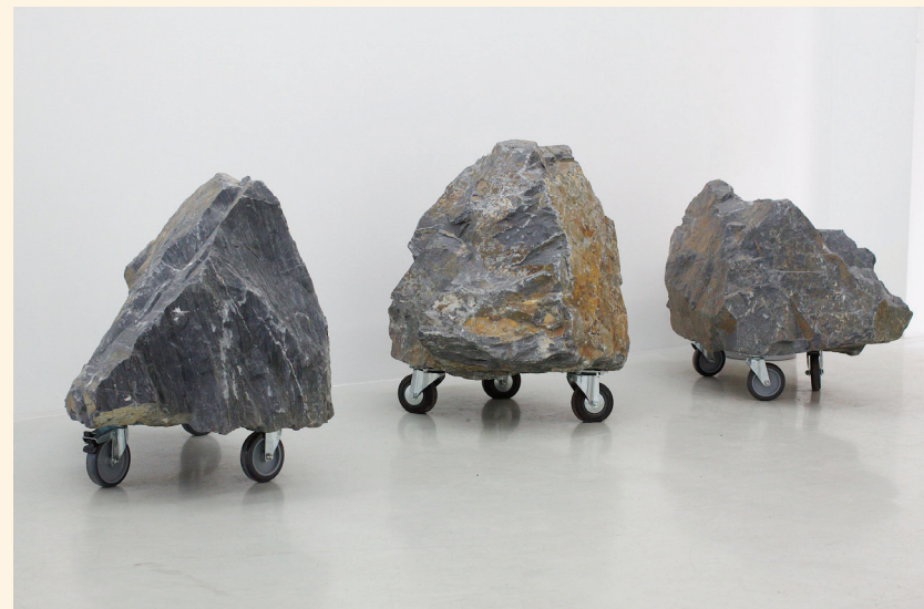
Matthieu Martin Povera Mobility , vue d'installation exposition In-cite, 2013, Courtesy Galerie ALB AnoukLebourdieu, Paris

Cette visibilité c'est aussi celle qu'il cherche à donner au bâtiment de l'architecte Erich Mendelsohn à Saint-Petersbourg. Sur les bâtiments abandonnés la nature prend le dessus et les arbres poussent et envahissent l'espace. Ce sont ces arbres que M. Martin a conservés et déplacés dans l'espace d'une galerie d'art. Représentant le bâtiment abandonné, ces arbres deviennent symboles d'éléments du patrimoine interrogeant l'histoire du modernisme.