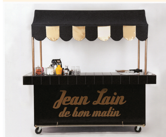
Jean Lain De Bon Matin, 2010