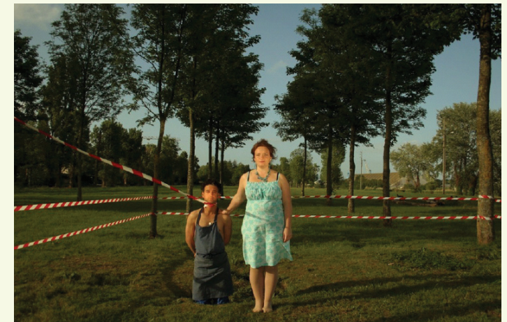
Frédéric Hocké Sans titre , 2009