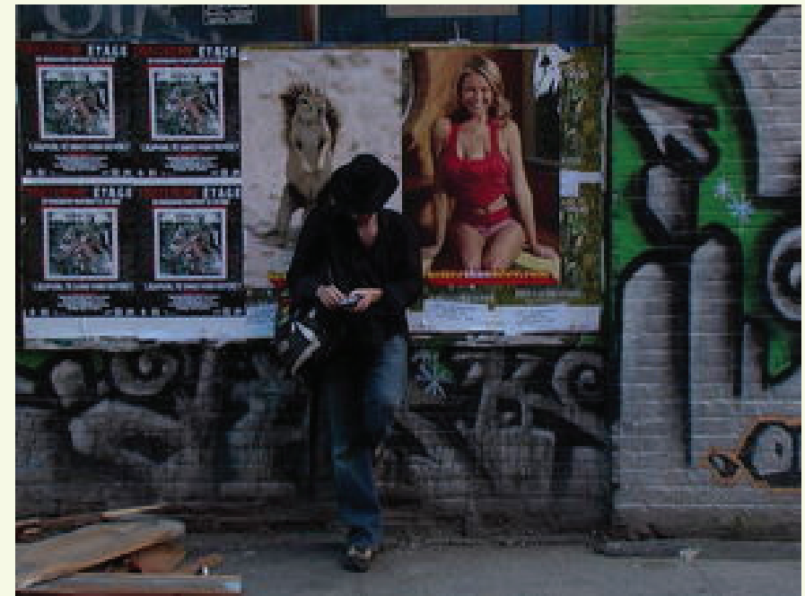
Frédéric Leterrier Western : sensation , 2009

La tension naît de ce décalage et de l'impossibilité des protagonistes à maîtriser la ville, à la dompter. Le mouvement de l'espace urbain leur échappe, les distance et renvoie à leur propre solitude.