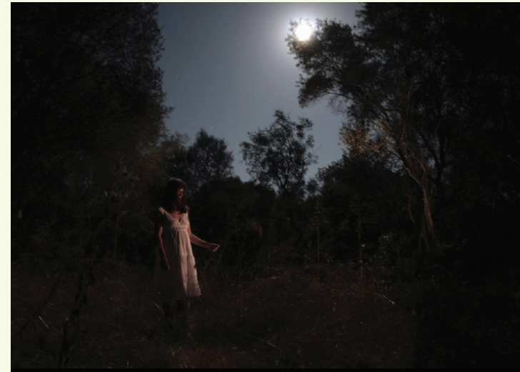
Frédéric Hocké Sans titre , 2009