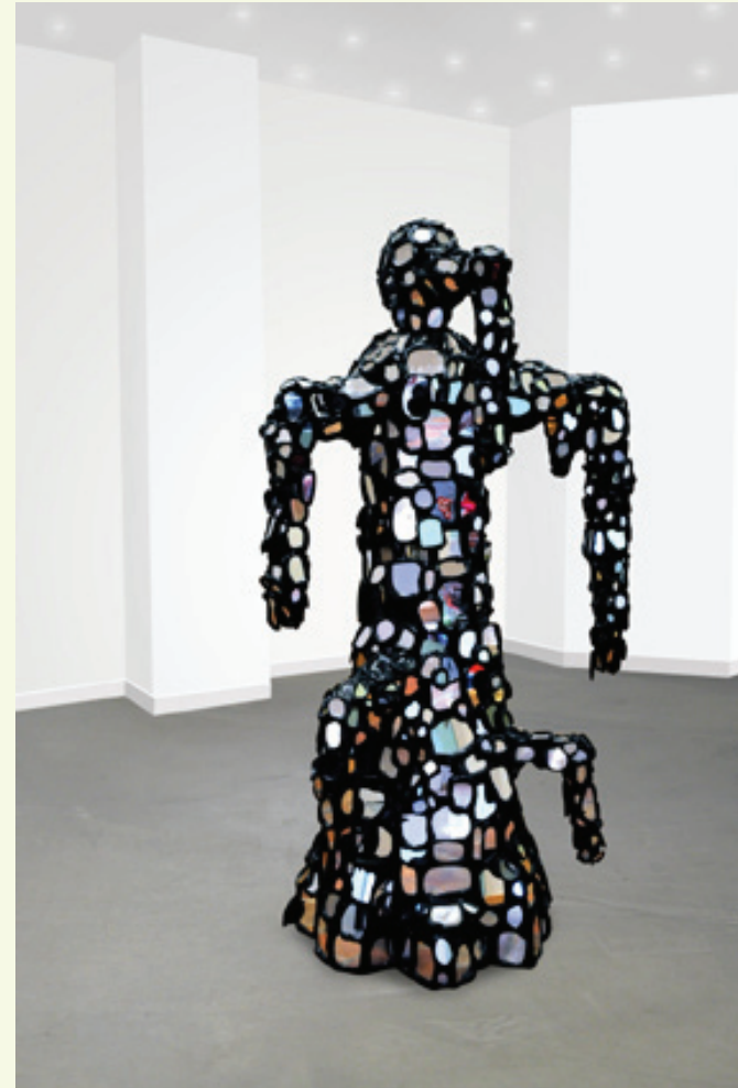
Bernard Quesniaux Sculpture en faux miroirs , 2009

Son exposition intitulée « Mais... » s'est déroulée au fonds régional d'art contemporain de Basse-Normandie en 2010. Les peintures et sculptures exposées proposaient une résonance intime à la création picturale contemporaine.