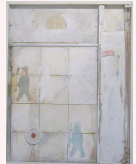
4 Olivier Thiebaut Série de vitrines , 2004