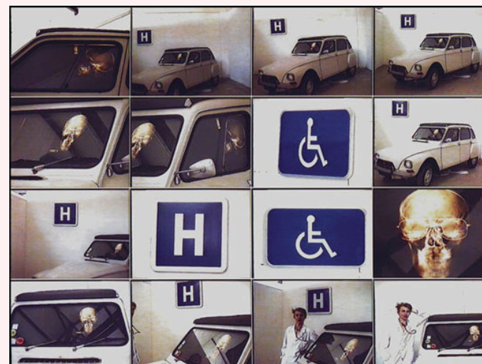
François Courbe Autoportrait , 1994