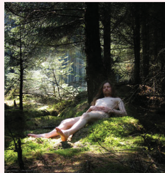
Cyril Lepetit Untitled sleep (in Norway) , 2004

Avec l'aide à la création, Cyril Lepetit a réalisé un projet d'exposition intitulé Infidélité respectueuse composé d'une série de photographies : En vue d'un passage à l'acte Hairy Exhibitionist ou encore la construction d'une fontaine pour reproduire le geste de sa performance Singing fountain .