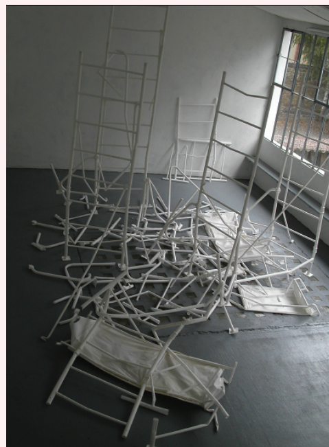
Claire Le Breton Echa-faux , 2004

L'aide individuelle à la création lui a permis d'intégrer, au sein d'un quartier cherbourgeois voué à la destruction, une résidence d'un an qui avait pour objectif de « prélever des traces » par l'empreinte papier tout en travaillant sur la mémoire des habitants.