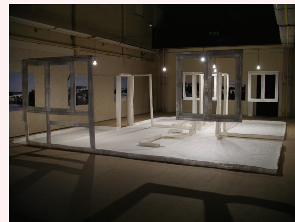
Claire Le Breton Fonction/format 3 , 2006