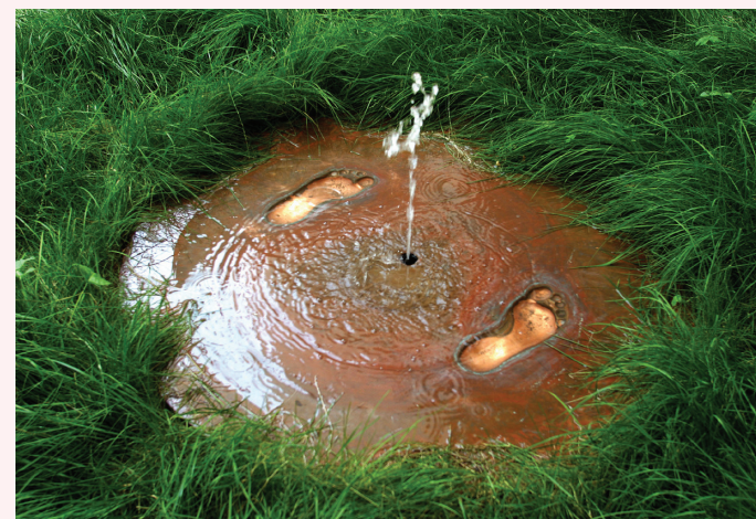
Cyril Lepetit Fontaine , 2004