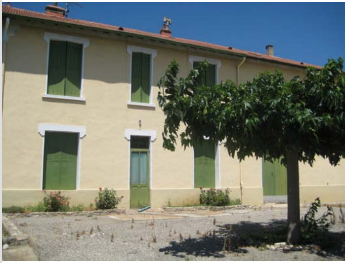
Façade sur la cour.