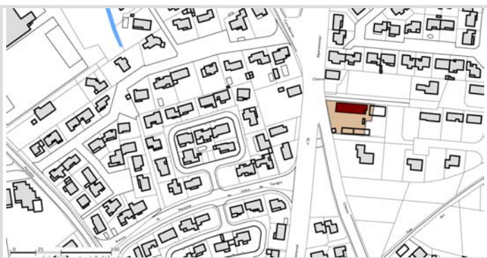
Plan de localisation (FB, document source : matrice cadastrale 2008, service des impôts)