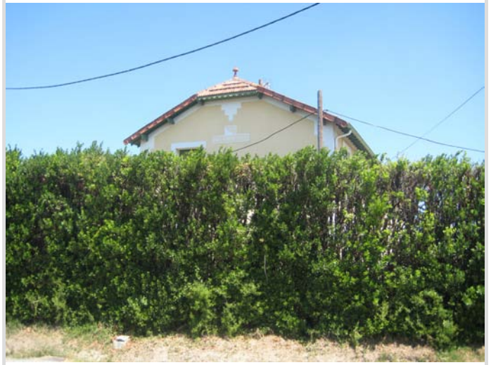
Détail de la façade latérale.