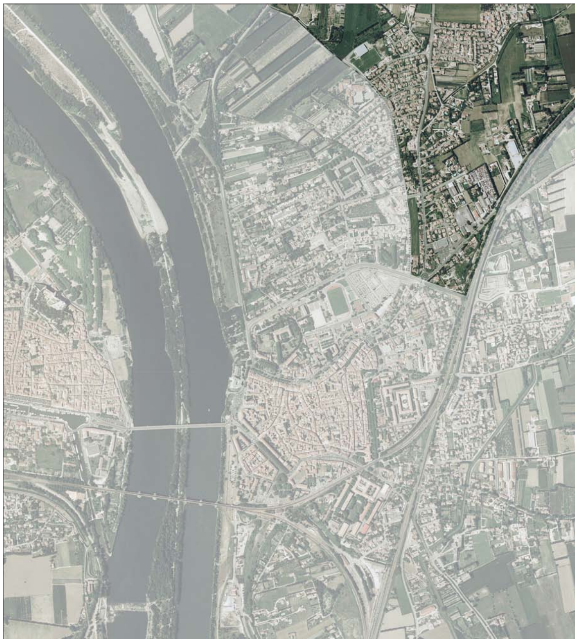
Vue aérienne (CRIGE PACA, IGN, 2003).