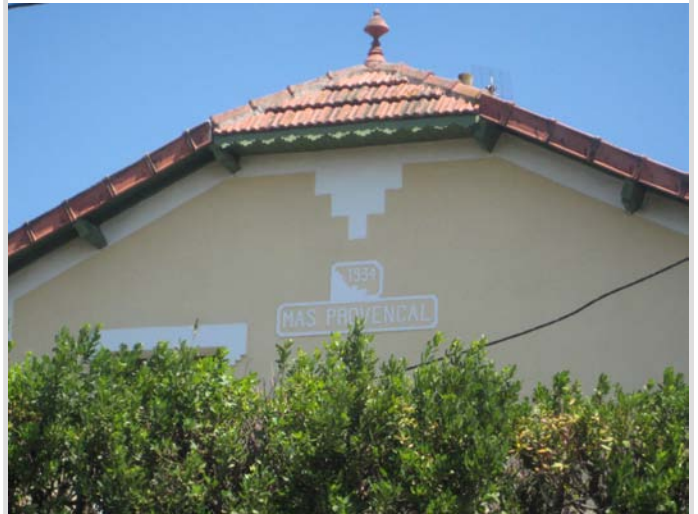
Détail du mur pignon.