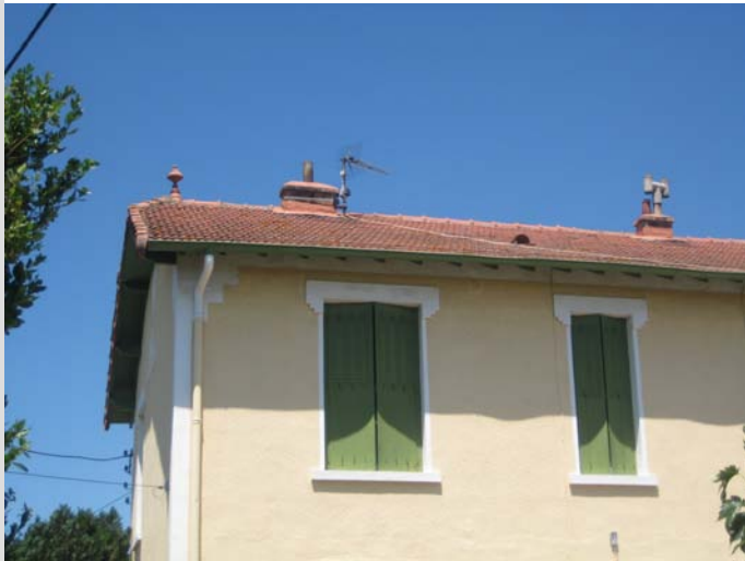
Détail de la façade sur la cour (cl. EMJ, 2008).