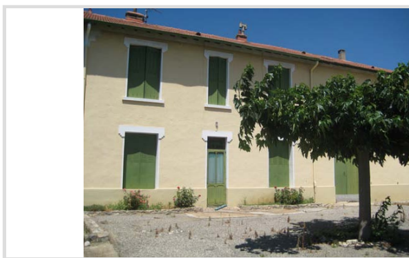
Vue générale (cl. EMJ, 2008)