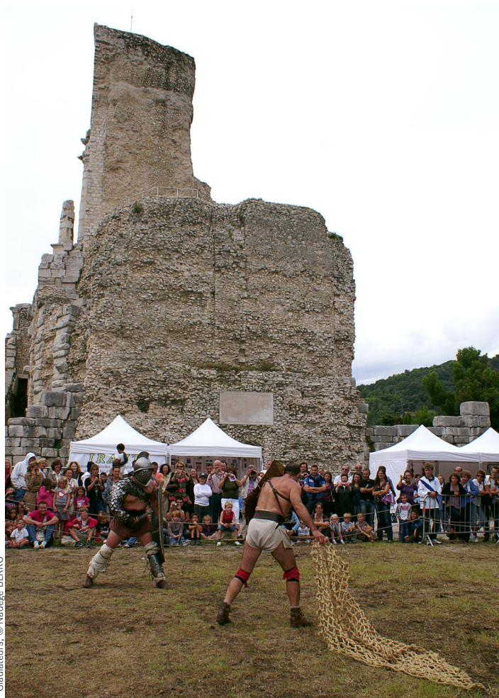
Gladiateurs : © Nadiège BERRO

Visites libres du musée Volti, Goetz-Boumeester ainsi que de la Collection Roux Ouverture : du 15/09/2012 au 16/09/2012 Horaires : sam 10h-12h/15h-18h30 dim 15h-18h30