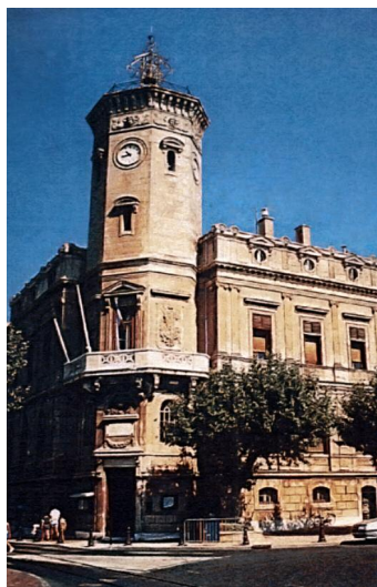
La Ciotat. Musée Ciotaden.

Quai Ganteaume, 13600 La Ciotat ■ La Ciotat, autrefois et aujourd'hui Exposition. La galerie du port est une salle