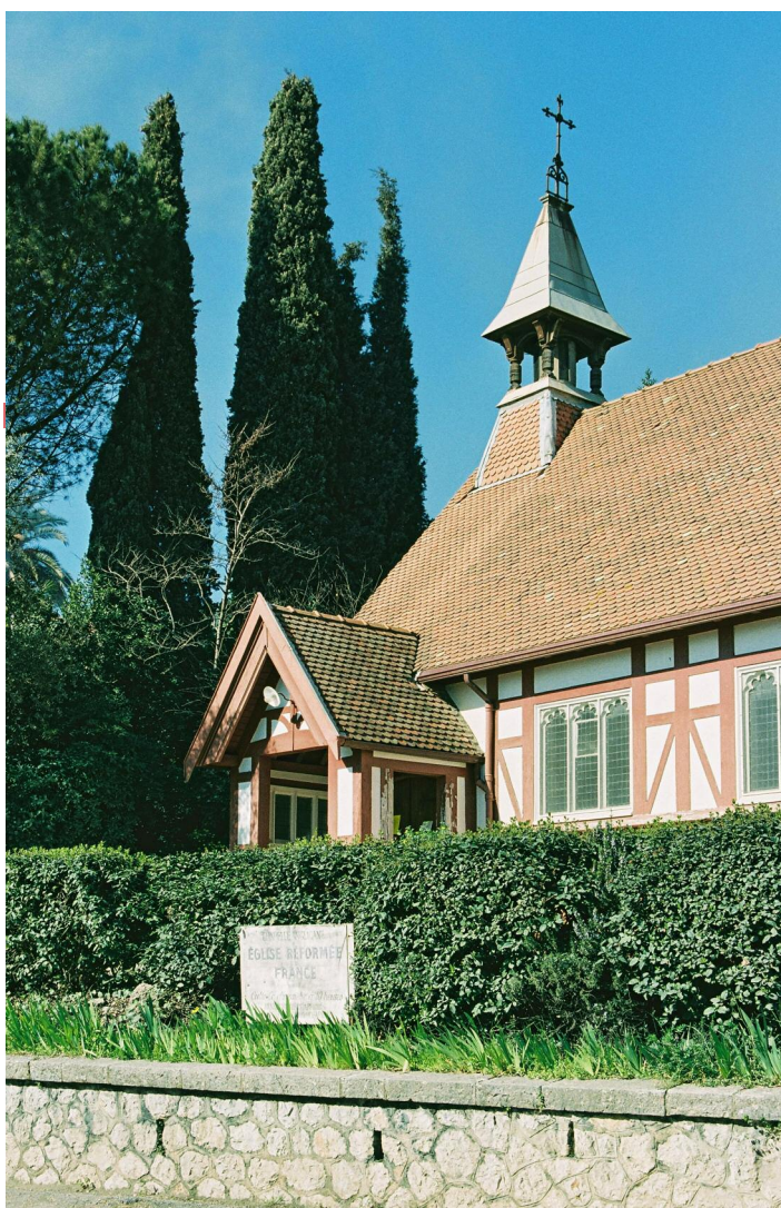
Grasse: Chapelle Victoria.