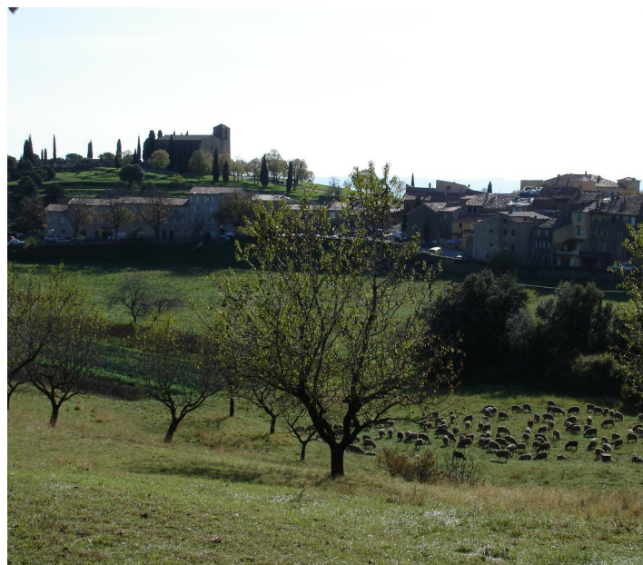
Tournour Village