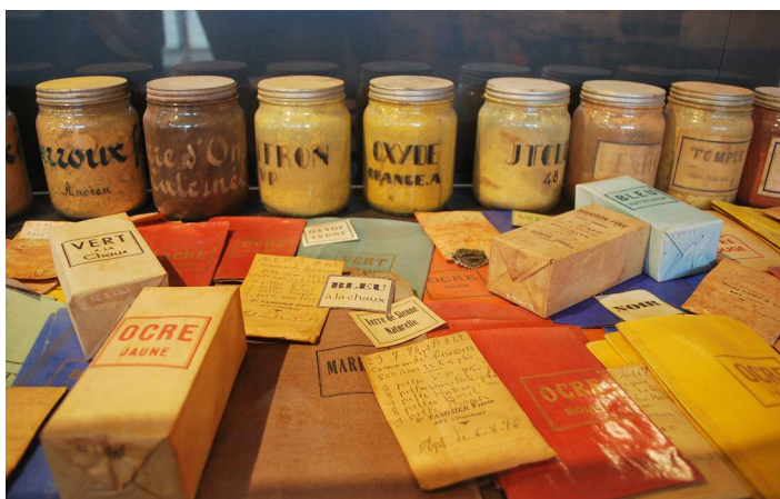
Apt Musée de l'Aventure Industrielle du pays d'Apt