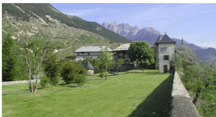
L'Argentière-la-Bessée. Le parc du Château Saint-Jean, © Mairie de L'Argentière-la-Bessée

Horaires : sam 10h30-12h et 14h30-18h dim : après la messe de 11h et 14h30-18h