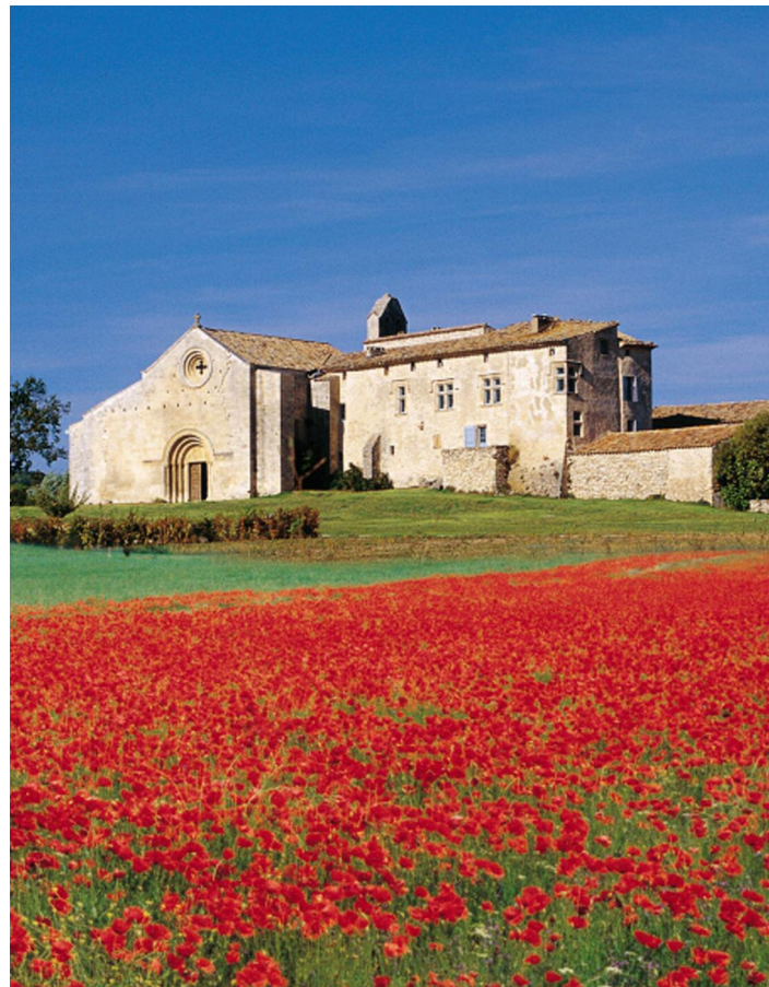
Mane - Vue du prieuré depuis un champ plein de coquelicots.

Horaires : sam 14h-18h - dim 10h-12h et 14h-18h