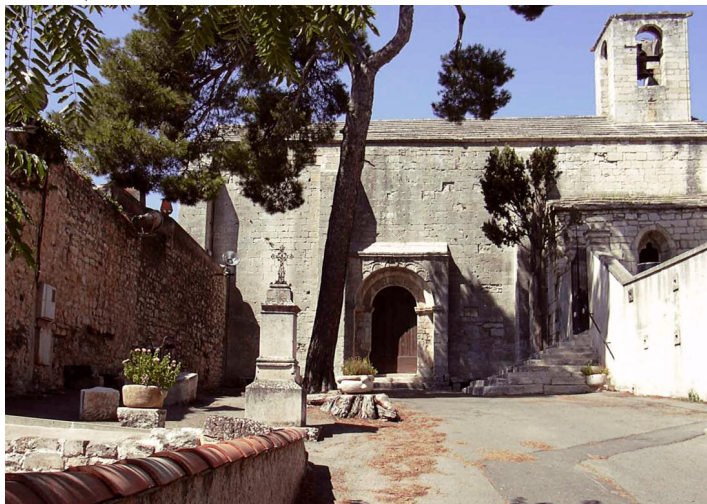
Boulbon. Chapelle Saint-Marcellin

Exposition temporaire 2012 : la Bouvino et les taureaux