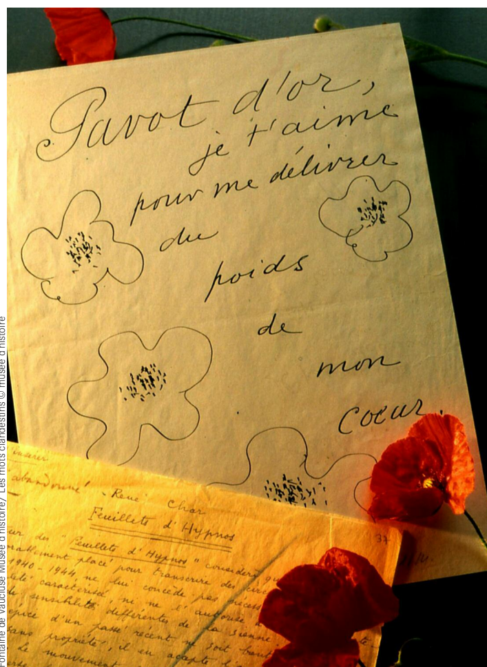
Fontaine de Vaucluse Musée d'histoire / Les mots clandestins

Ouvert en 1990, le musée recrée par le biais