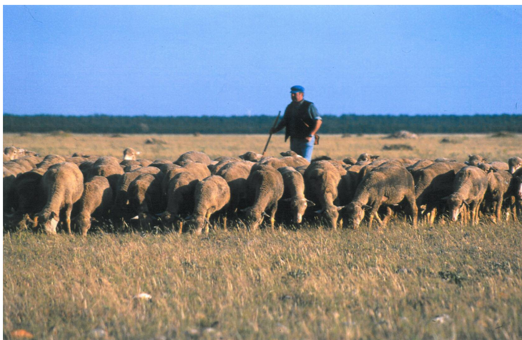
Saint-Martin-de-Crau troupeau moutons

Un clocher, ancienne tour de guet du Xe siècle, qui offre une vue panoramique de la commune et l'église dont l'intérieur a été restauré récemment.