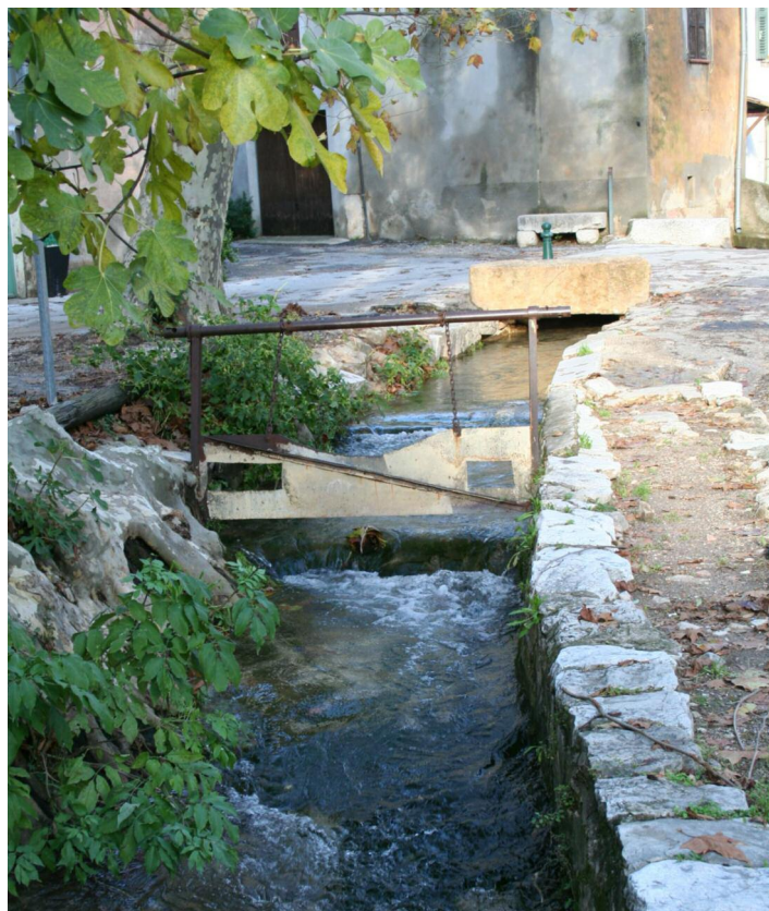
Camps la Source Le lavoir de la Servi