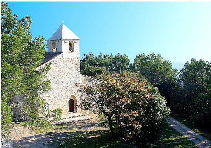
Callas chapelle Saint-Auxile

Bâtiment ancien avec roue à aubes et nouveau bâtiment construit en 2001 avec installation d'un nouveau processus d'extraction en continu de l'huile d'olive.