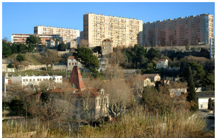
Marseille. Colline Consolat

XX (partiel) XX Bus 25 et 36 Arrêt «Cité St Louis» Rendez-vous Villa Favorite 129, chemin de St Louis au Rove, 13015 Marseille Tél. : 06 89 30 57 04 De la Villa Favorite, peinte par Monticelli, au domaine des Consolat, de la Cité St Louis, premier habitat social de Marseille, aux projets de réhabilitation de la colline, cette balade fait revivre, sur 1km et demi et un siècle et demi, la mémoire des bastides et celle de la culture ouvrière.