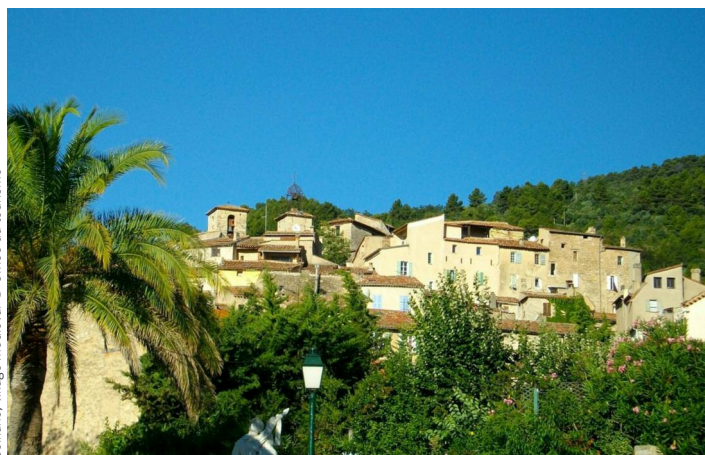
Seillans, village médiéval