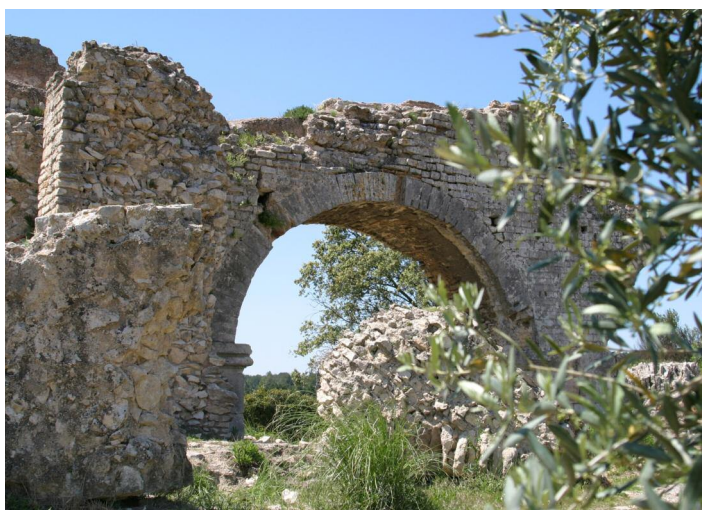
Fontvieille. Aqueducs de Barbegal

Barbegal, 13990 Fontvieille Tél. : 04 90 54 67 49 www.fontvieille-provence.com Plus grande concentration connue de puissance mécanique du monde antique, les aqueducs et les moulins de Barbegal composaient un ouvrage exceptionnel, composé de deux aqueducs parallèles conduisant l'eau potable vers la cité d'Arles.