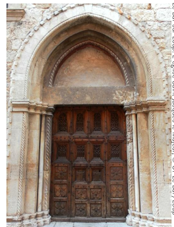
Le Bar-sur-Loup, l'église Saint-Jacques le Majeur.

Horaires : samedi 10h30-12h30 et 14h30-18h30