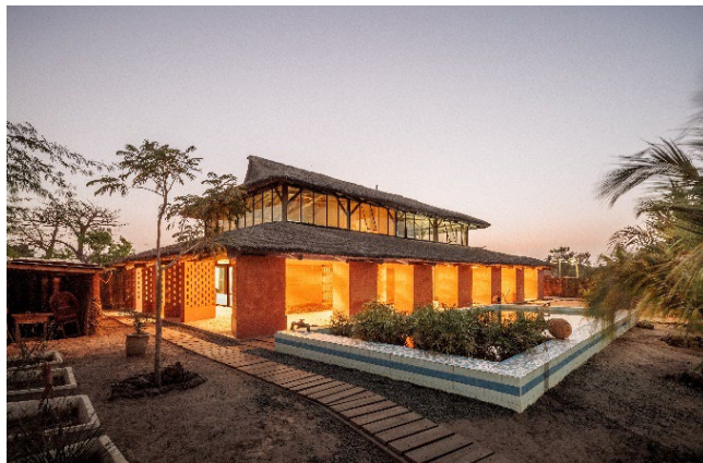
Atelier Gilles Perraudin (Grand Prix national de l'architecture 2024) – Bureau et résidence, Djilor – Sénégal

En soutenant les initiatives comme les Grands Ateliers Innovation Architecture (GAIA) et en diffusant les résultats des expérimentations en design built et en Archifolies, l'engagement des architectes dans la transition écologique pourra être mieux documenté et objectivé. Leur participation aux programmes interministériels, en lien avec le GIP EPAU et le PUCA, doit être consolidée. Le projet Quartiers de demain, porté par le ministère du Logement et soutenu par le ministère de la Culture, sera l'occasion de mobiliser l'excellence architecturale, urbaine, et paysagère autour de dix réalisations manifestes d'un nouvel art de bâtir au plus près des habitants.