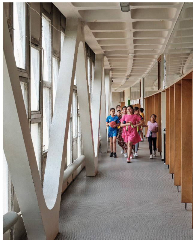
Groupe scolaire Louis Houpert, 1966 - Forbach (57) - Émile Aillaud, architecte ; Fabio Rieti, coloriste - Label ACR 2003 - Myr Muratet © ministère de la Culture (DGPA/MPP)

Les réseaux de médiation en architecture participeront à l'élaboration et au déploiement de cette initiative.