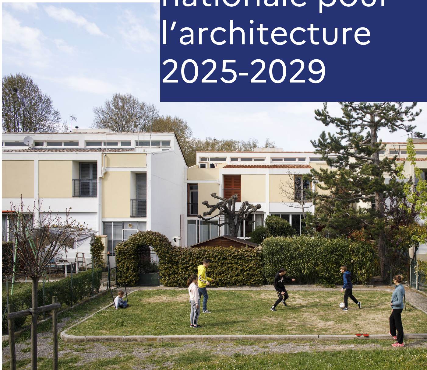
Les Mûriers , 1963 - Manosque (04) - Georges Candilis, Alexis Josic, Shadrach Woods, architectes - Label ACR 2000 Clément Guillaume © ministère de la Culture (DGPA/MPP)