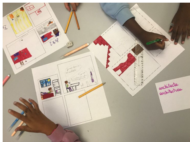
Animation d'un atelier d'enfants autour de la collection Archi & Basile (éditions du Patrimoine avec le soutien du ministère de la Culture)