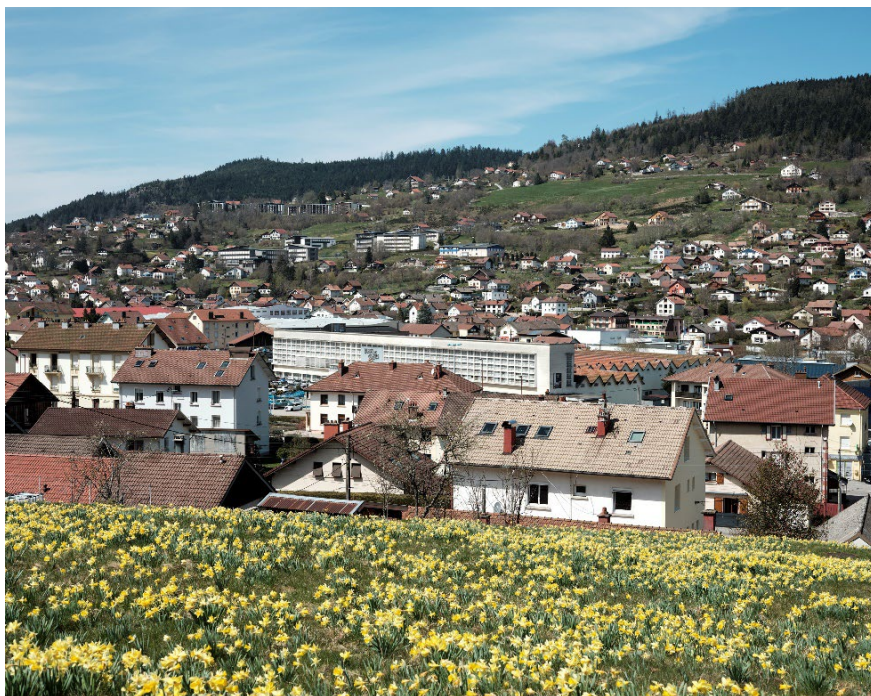
Usine de tissage, 1950 - Gérardmer (88) - Georges Vigneron, Louis Savreux, Maurice Bolland, architectes - Label ACR 2015

Le ministère, à travers ses outils de contractualisation et d'accompagnement, organisera une offre de formation à destination des élus engagés pour la qualité architecturale. Dispensée par ses réseaux partenaires, cette offre de formation permettra d' identifier un collectif de travail et avancer vers la création d'ateliers territoriaux. Les résultats de ces travaux feront l'objet d'une restitution pour diffuser les bonnes pratiques et mettre en avant les projets inspirants issus de tous les territoires . De nombreux partenaires seront associés à cette démarche.