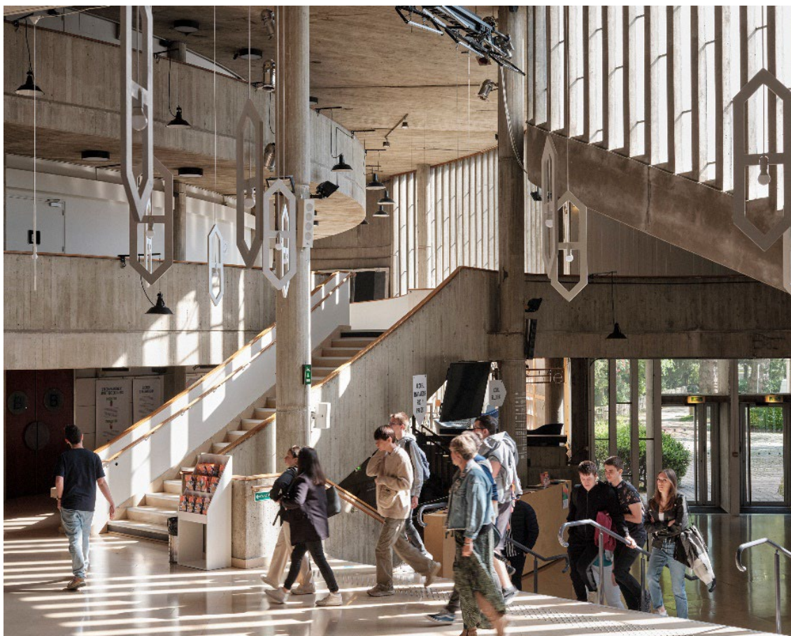
Théâtre dit La Comédie, centre dramatique national de Reims (ancienne Maison de la Culture), 1969 – Reims (51) – Jean Le Couteur, architecte – Label ACR 2000

Dans la perspective d'un suivi régulier de cette stratégie pluriannuelle (2025-2029) une nouvelle forme de gouvernance est proposée.