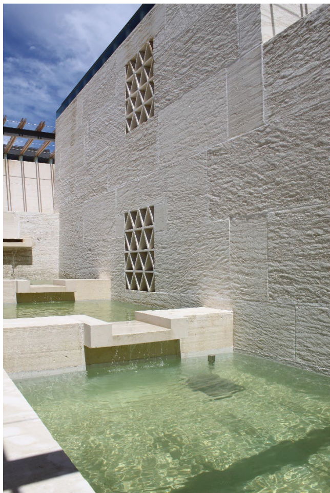
Atelier Gilles Perraudin (Grand Prix national de l'architecture 2024) – musée du vin et jardin ampélographique – Patrimonio (Haute-Corse) © Atelier Perraudin