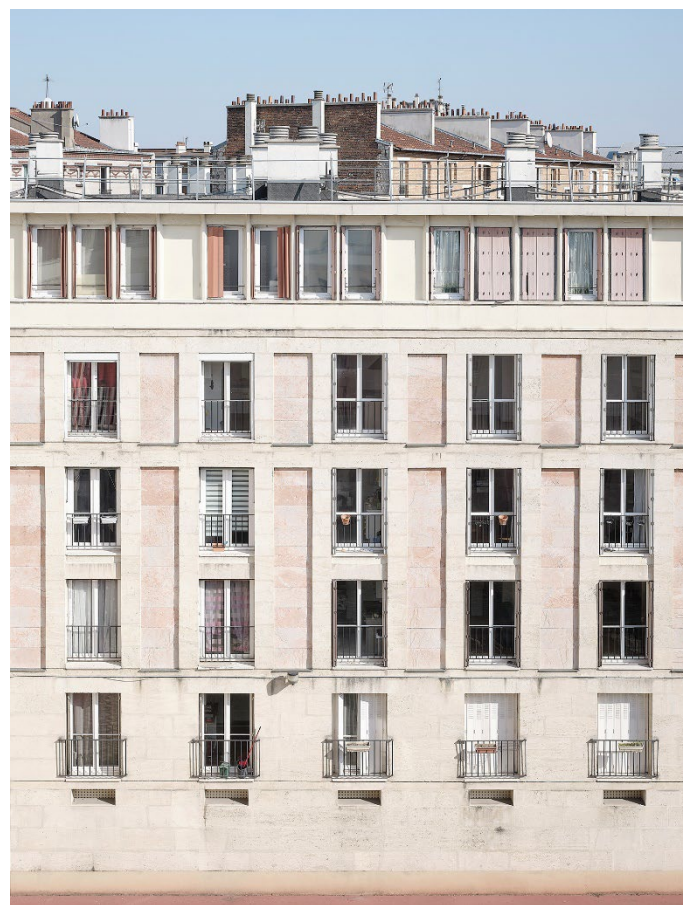
Résidence Victor-Hugo, Pantin (93) – Fernand Pouillon, Roland Dubrulle, architectes – Label ACR 2008 – Sandrine Marc ©ministère de la Culture (DGPA/MPP).

La première stratégie nationale pour l'architecture a montré l'importance d'une coordination et d'un dialogue renforcés entre les différents services de l'État pour une meilleure prise en compte des enjeux architecturaux dans l'élaboration et la conduite des politiques publiques. Afin de renouveler le cadre de travail, faciliter les échanges et réaffirmer la prise en compte de l'architecture dans de nombreux domaines, un comité interministériel sera mis en œuvre et suivi conjointement par le ministère de la Culture et les autres ministères concernés.