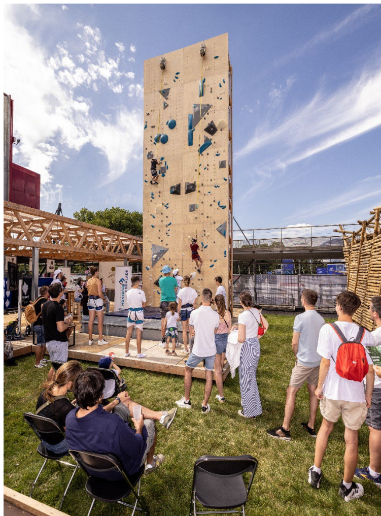
Archi-Folies 2024 - Pavillon ASCENSION ENSA Paris-Est x FF Escalade

Afin de stimuler la recherche et l'innovation, il est nécessaire d'augmenter le nombre de candidatures dans les dispositifs expérimentaux et de partager les résultats au sein des réseaux professionnels. La création d'une boîte à outils dédiée à l'innovation et à la recherche en architecture offrira aux architectes les ressources nécessaires pour exploiter pleinement ces opportunités et soutenir leur développement professionnel.