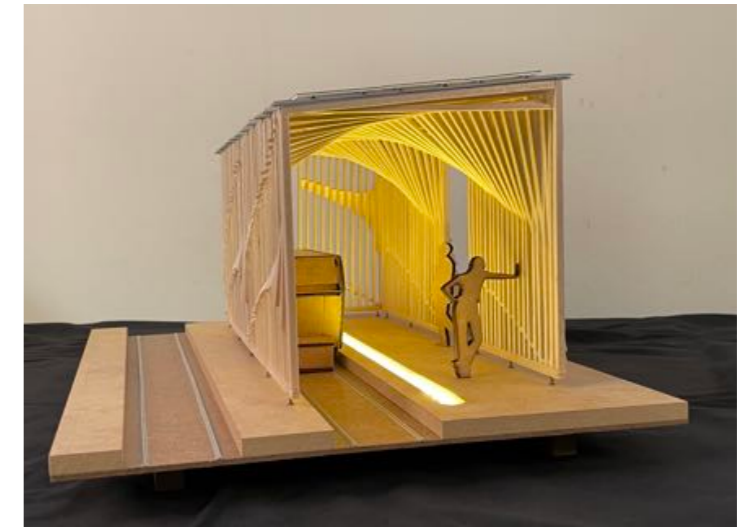
Gare nov. 2022 - URBANLOOP