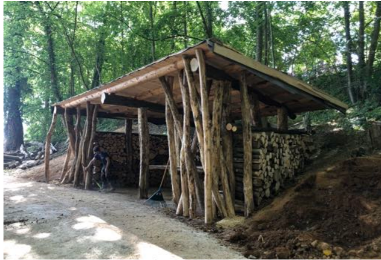
Abri forestier en bois d'éclaircie mai 2019 - Métropole du Grand Nancy