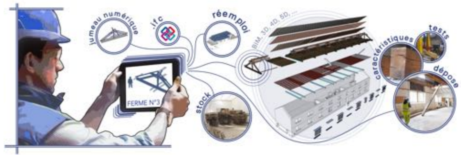
Réemploi du bois janv. 2022 - EPFGE, Les Constructeurs du Bois