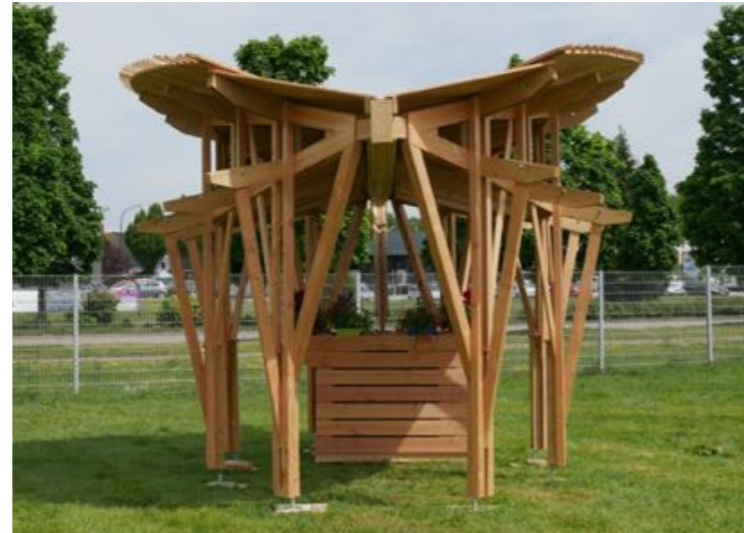
Les Défis du Bois mai 2019 - SICOVAD