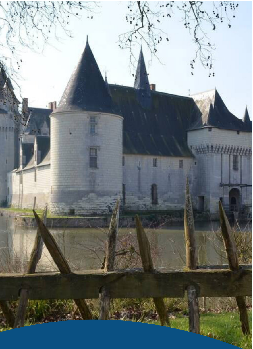
Écuillé - Château du Plessis-Bourré