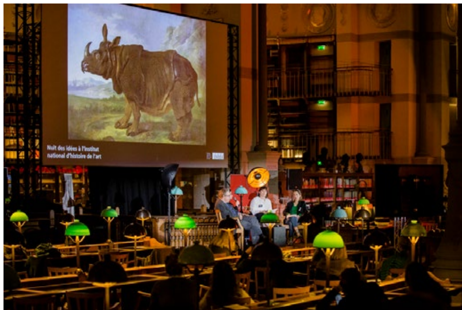
Nuit des Idées 2020 à l'INHA

Le 27 janvier 2022 Dans le monde entier, en Europe et au Collège de France