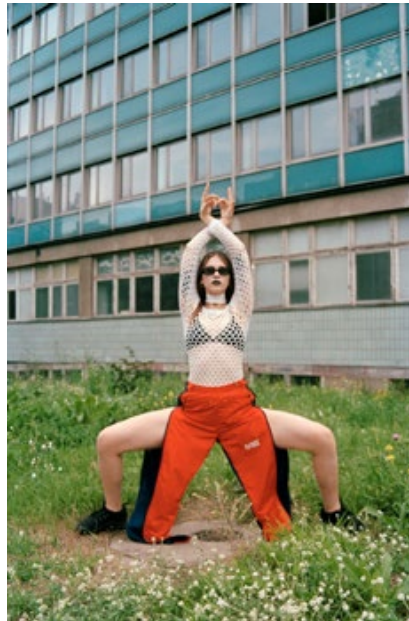
© Robin Plus, All eyes on us , 2020.

Du 28 janvier au 1 er mai 2022 BOZAR, Bruxelles / Belgique