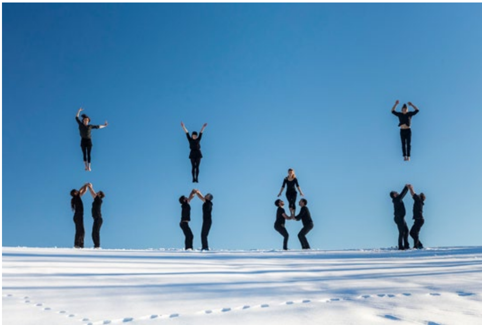
Möbius – Compagnie XY

10 janvier 2022 Tour et taxis, Bruxelles / Belgique