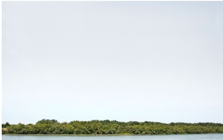
Arles / France, 2014

Du 20 janvier au 27 février 2022 Grilles du Jardin du Luxembourg, Paris / France