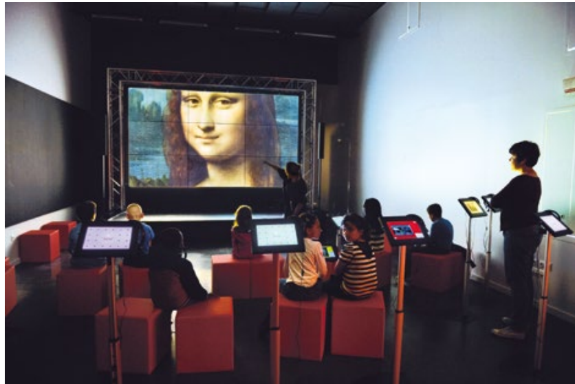
Lille – Musée numérique

À l'occasion de la présidence française du Conseil de l'Union Européenne, le dispositif s'enrichit d'une collection Union européenne qui présente une très belle sélection de chefs-d'œuvre des musées et institutions culturelles des Etats membres. L'initiative sera également ouverte aux États membres qui souhaitent s'y associer pendant la présidence française.