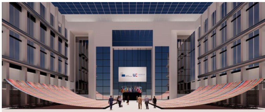
Installation dans Atrium Justus Lipsus © Ateliers Adeline Rispal.

Bâtiments du Conseil de l'Union européenne, Bruxelles / Belgique