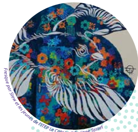
Fresque par Sév et les jeunes de l'ITEP Le Coteau