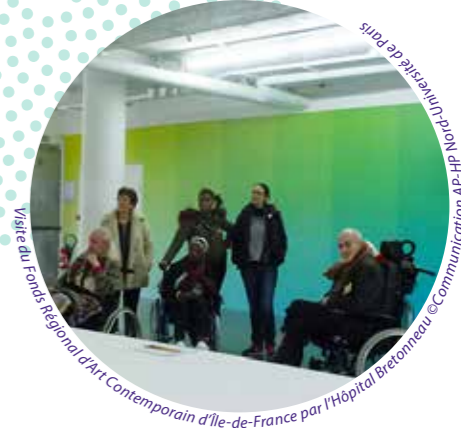
Visite du Fonds Régional L'Art Contemporain d'Île-de-France par l'Hôpital Bretonneau

Le label Culture & Santé en Île-de-France valorise les établissements de santé investis dans une politique artistique et culturelle de qualité. Il est décerné par l'Agence Régionale de Santé et la Direction Régionale des Affaires Culturelles Île-de-France dans le cadre du programme régional Culture & Santé*. Attribué pour trois ans et sans dotation financière, ce label témoigne de l'adhésion des lauréats à un ensemble de bonnes pratiques dont : • des domaines artistiques diversifiés, • l'intervention d'artistes professionnels, • l'implication de tous (usagers, membres du personnel, proches, visiteurs...), • l'ouverture sur l'extérieur, • l'attribution de moyens nécessaires.