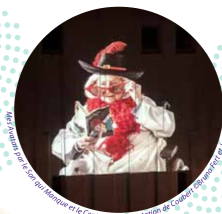
Mes Avatars par le Sor qui Marque et le Centre de Réadaptation de Coubert

« Le bruit/Le bruit est partout/Quand tu parles, il y a du bruit/Quand tu m'entends, il y a du bruit/Le bruit n'est pas une substance/On l'entend, quand on se calme/Le bruit crée la musique/L'homme ne fait jamais aucun bruit/ Il l'écoute sans faire de bruit... » G. L'innovation, nos d'histoires en partage entre l'ITEP Le Coteau et La Maison du Conte