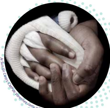
Le Corps CNY de Varennes-Jarcy

« Le bruit/Le bruit est partout/Quand tu parles, il y a du bruit/Quand tu m'entends, il y a du bruit/Le bruit n'est pas une substance/On l'entend, quand on se calme/Le bruit crée la musique/L'homme ne fait jamais aucun bruit/ Il l'écoute sans faire de bruit... » G. L'innovation, nos d'histoires en partage entre l'ITEP Le Coteau et La Maison du Conte