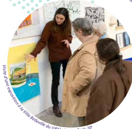
Visite d'une exposition à la Villa Belleville du Pôle Korian Paris 20 e