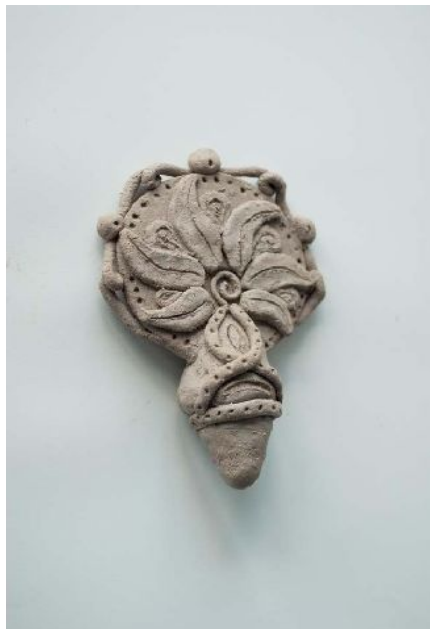
Réalisation en terre glaise, modèle pour moulage en cire.

Du 18 au 29 mars 2014. Accès libre. Jeune public.