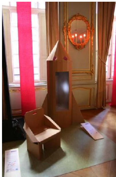
« Cartone » réalisée par Aurore Daunis - 2006

Accès libre. Grand public, professionnels.