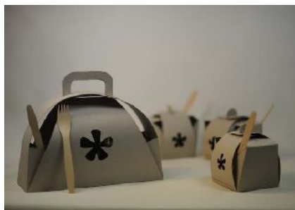
« Packaging » réalisé par Aurore Daunis – Octobre/Novembre 2013

Adresse : 1 rue de Bethune 59253 LA GORGUE