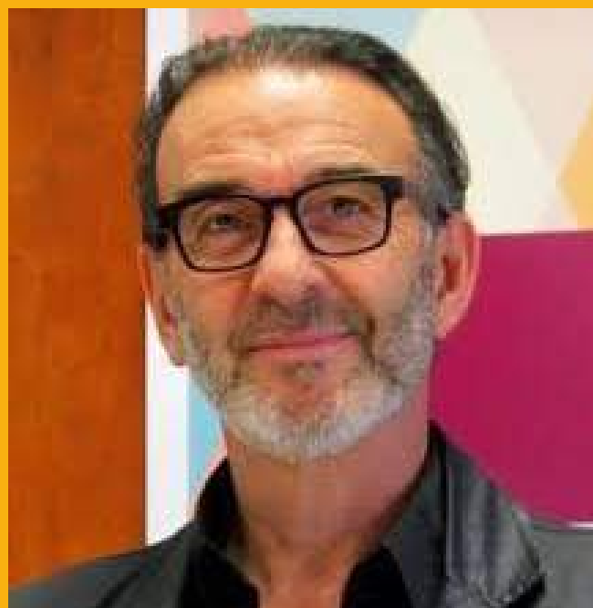
Robin Renucci Comédien