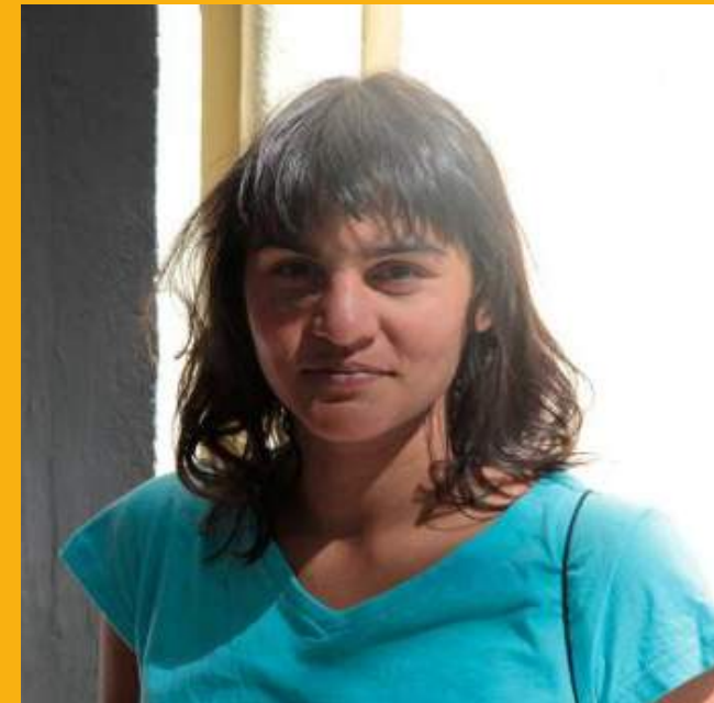
Métié Navajo Atrice