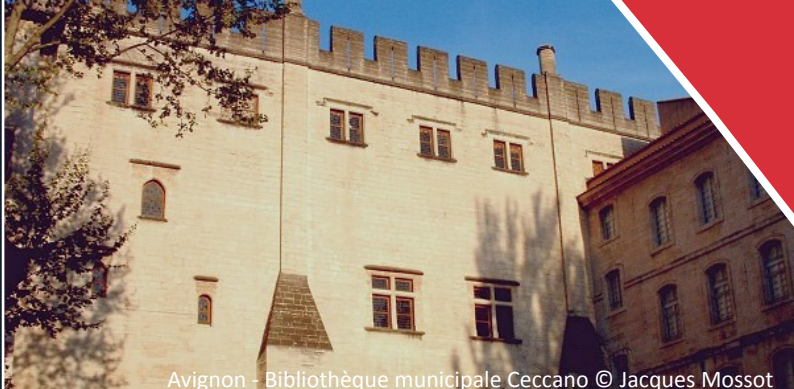
Avignon - Bibliothèque municipale Ceccano