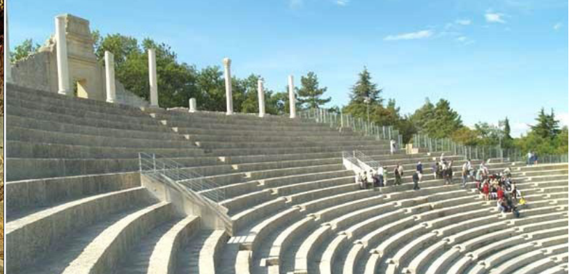
Pertuis - Flânerie en ville