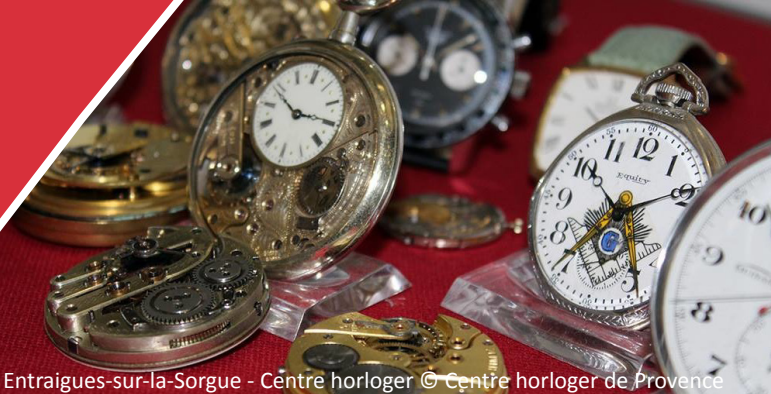
Entraigues-sur-la-Sorgue - Centre horloger