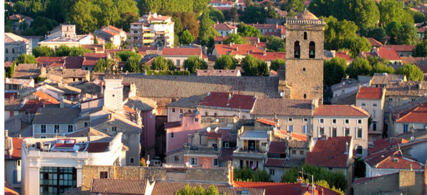
Orange - Notre Dame de Nazareth