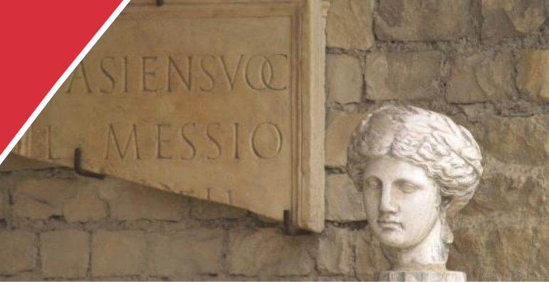
Vaison-la-Romaine - Site antique de Puymin