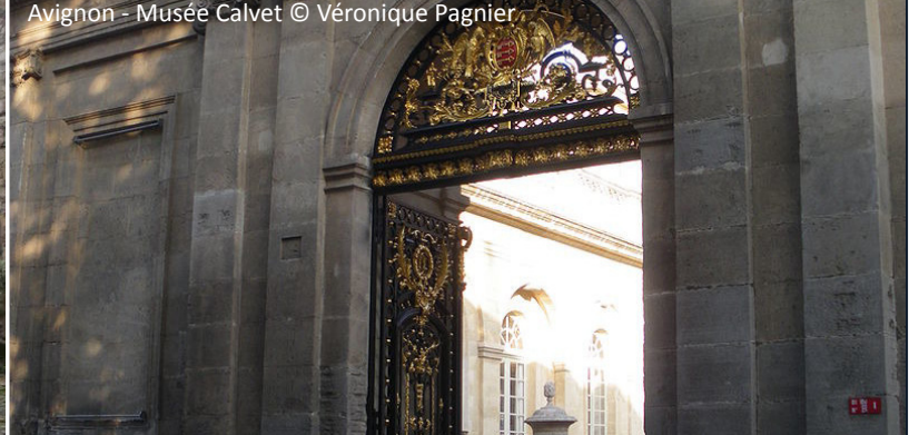
Avignon - Musée Calvet