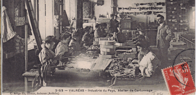
Valreas - Musée du cartonnage et de l'imprimerie