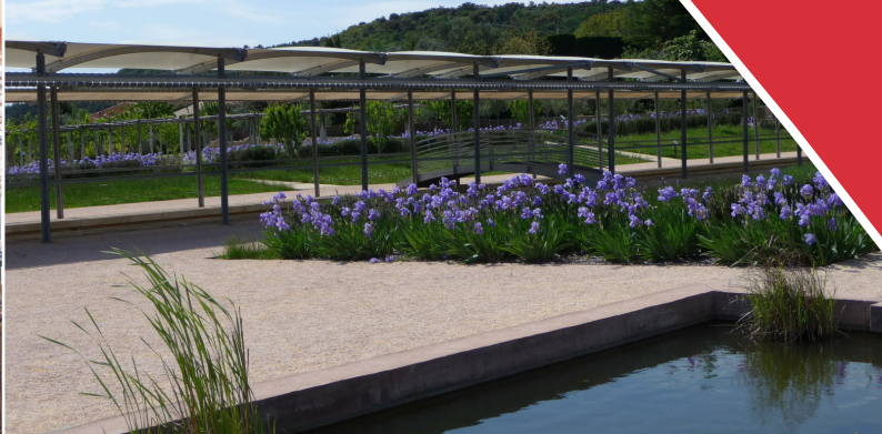
Caumont-sur-Durance - jardin romain