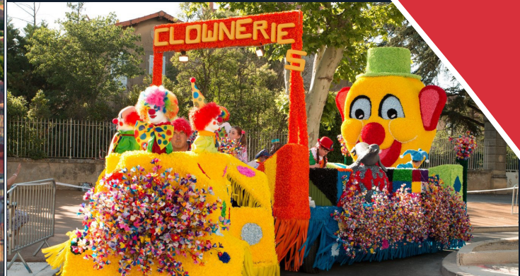
Pertuis - construction de chars