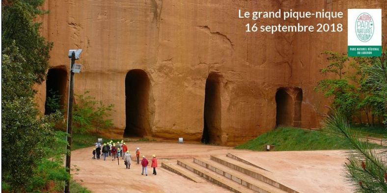
Gargas- mines de Bruoux