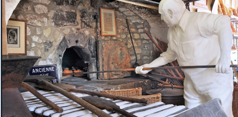
Bonnieux - Musée de la boulangerie