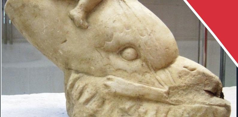
Vaison-la-romaine - Cathédrale de l'Assomption