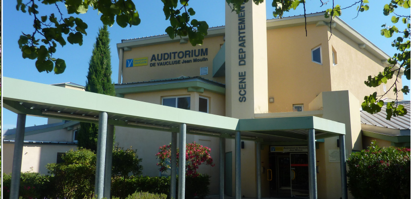
Le Thor - Auditorium Jean Moulin