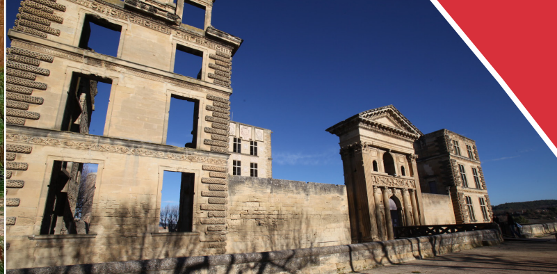
La Tour d'Aigues - le château © Château de La Tour d'Aigues