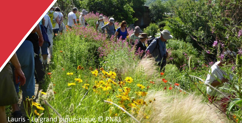
Lauris - Le grand pique-nique