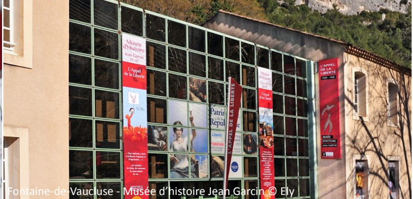
Fontaine-de-Vaucluse - Musée d'histoire Jean Garcin