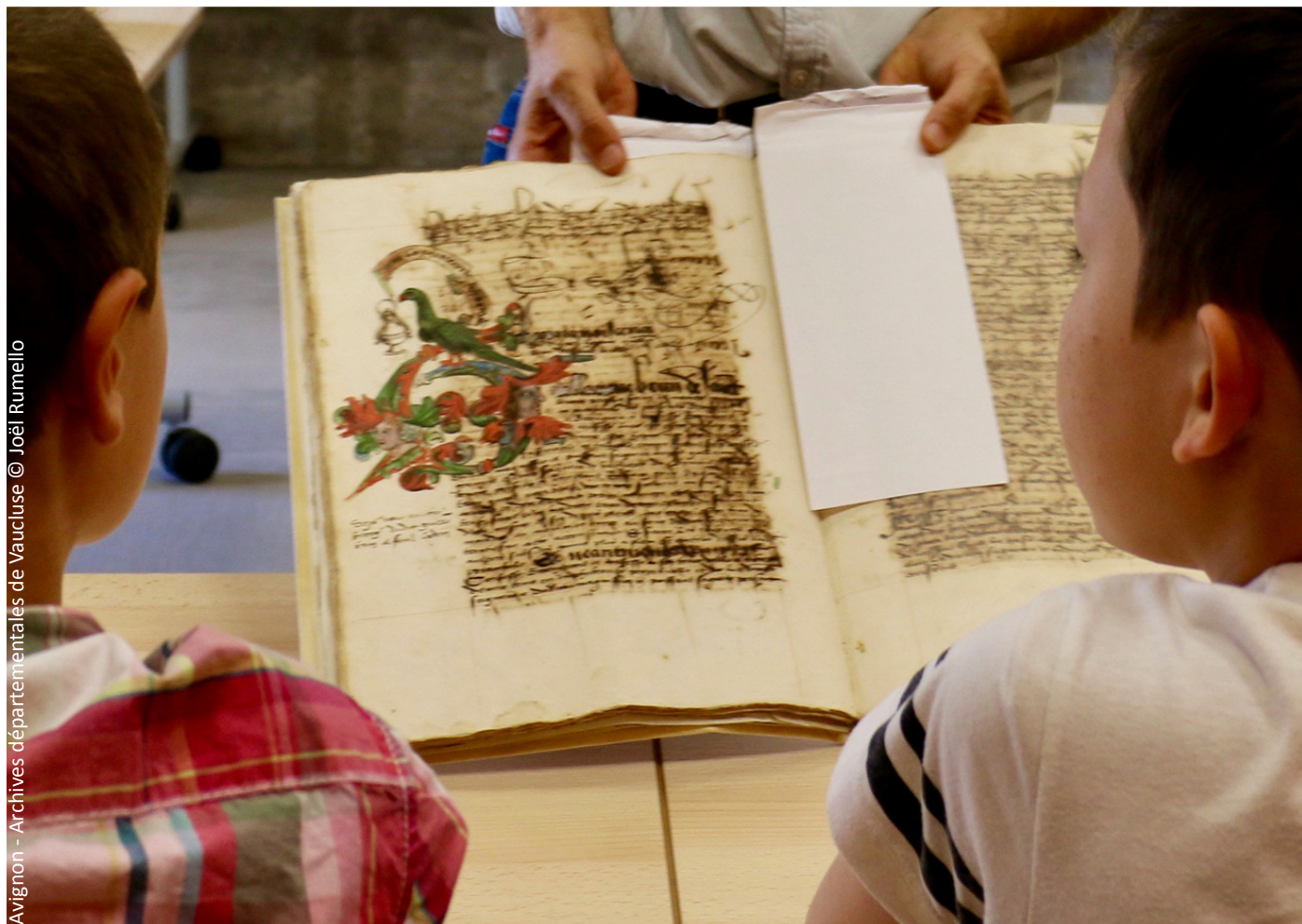
Avignon - Archives départementales de Vaucluse © Joël Rumello