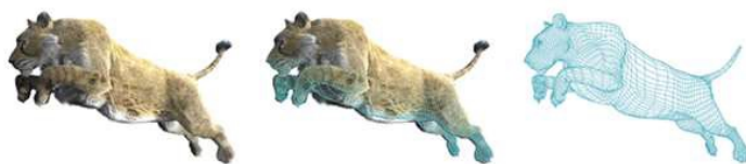
Reconstitution virtuelle du lion des cavernes à partir du scanner 3D du squelette, réalisée par la société IMA Solutions à Toulouse. © Benjamin Moreno, IMA solutions.

Au cours de cette exposition, le public découvrira un dispositif multimédia d'immersion unique, baptisé "le Vaisseau" et réalisé par le Muséum de Toulouse, à partir d'une imagerie 3D du spécimen Panthera leo spelaea , retrouvé par Louis Méroc à Montmaurin. La numérisation et l'animation 3D, qui ont permis de reconstituer l'animal en chair en le rendant presque vivant, proposeront un voyage dans le passé à bord d'un vaisseau rétrofuturiste.