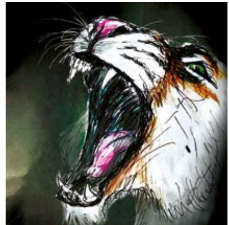
Illustration : Gilles Tosello

Cette exposition mettra notamment en lumière des pièces exceptionnelles de squelette du lion des cavernes, découvertes dans les années 1950 à Montmaurin, à 20 km d'Aurignac, dans les gorges de la Seygouade, par le célèbre préhistorien Louis Méroc.