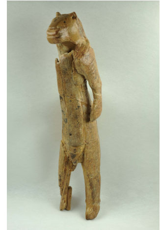
Statuette paléolithique en ivoire de mammouth de l'"Homme-Lion", grotte de Hohlenstein-Stadel (Allemagne - 32 000 ans BP)

Pour Aurignac, Abraham Poincheval a pensé son intervention artistique comme un lien, une passerelle entre le récent musée de la préhistoire, à l'architecture contemporaine, et le passé incarné par l'abri sous roche d'Aurignac, occupé par des hommes et des femmes il y a environ 35 000 ans.