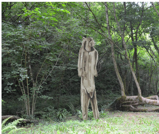
Vue du projet d'Abraham Poincheval

"Habiter l'Homme Lion, c'est à la fois faire l'expérience de la grotte et entrer dans l'imaginaire, dans la singularité d'une société." Abraham Poincheval