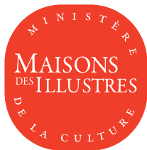
Logo du label