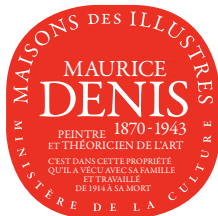
exemple de plaque : Maison Maurice Denis