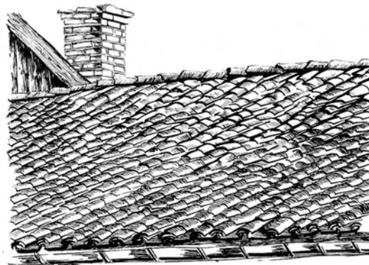
L'architecture traditionnelle de la Marne, Daniel Imbault, CAUE de la Marne 1981.

Ce mode de pose implique des toits à faible pente, inférieure à 30°.