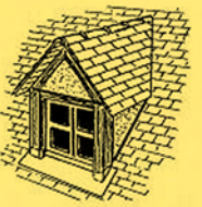
Lucarne à 2 pans ou jacobine