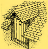
Lucarne pendante ou gerbière