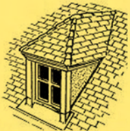
Lucarne à croupe ou à capucine

La largeur des lucarnes est inférieure à la largeur des baies du dernier étage.