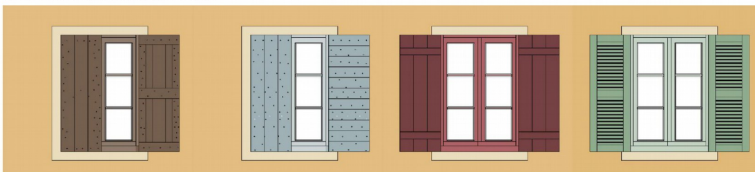
① A cadre et à panneaux