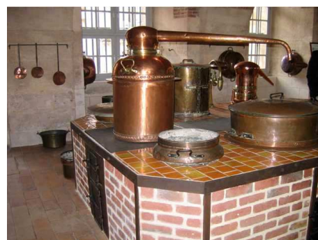
Ancienne pharmacie dite Tisanerie .

Resté aujourd'hui parfaitement lisible, cet ensemble témoigne de l'architecture publique des XVII e et XVIII e siècles y compris par ses intérieurs (la Salle des Actes aux lambris du XVIII e siècle) Il s'inscrit dans l'histoire hospitalière, grâce à la conservation d'éléments patrimoniaux comme la pharmacie et la cuisine. La chambre natale de Gustave Flaubert, transformée en laboratoire d'histologie, a été reconstituée en 1923. Intégrée en 1947 à un Musée Flaubert et d'Histoire de la Médecine , dépendant du CHU, elle maintient sur place la tradition hospitalière de ce Lieu de Santé .