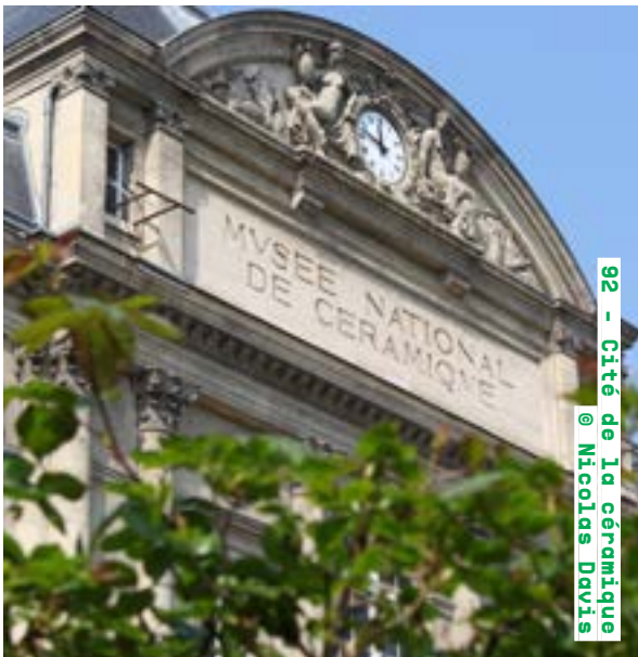
92 - Cité de la céramique @ Nicolas Davis