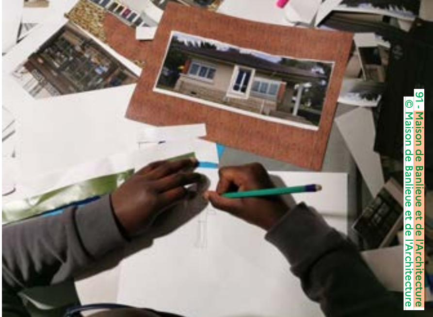
91 - Maison de Banlieue et de l'Architecture