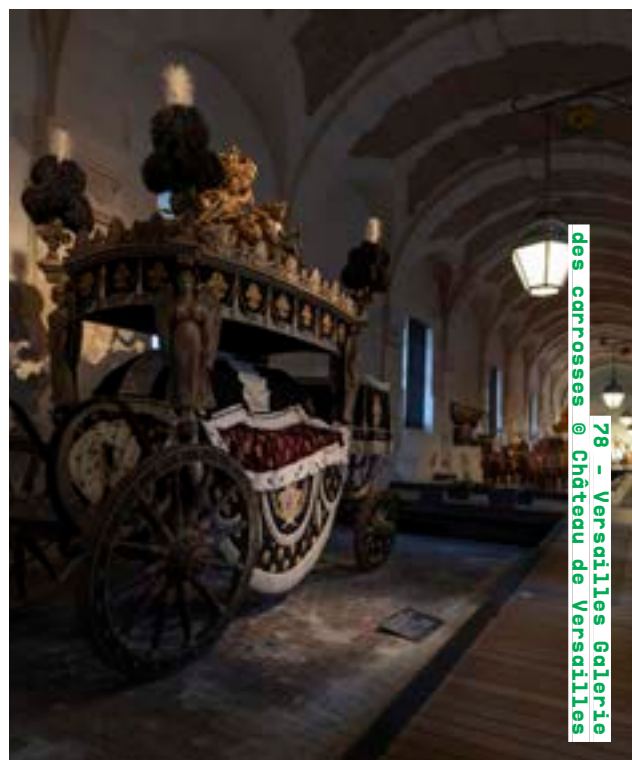
78 - Versailles Galerie des carrosses @ Château de Versailles