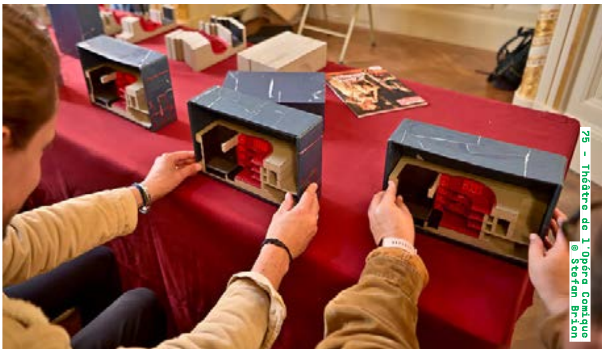
26 - Théâtre de l'Opéra Comique

Visite samedi de 10h30 à 11h30 (sur inscription) archives-nationales.culture.gouv.fr Détails de la programmation ici