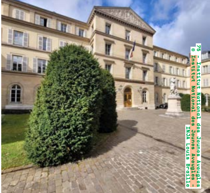
75 - Institut National des Jeunes Aveugles - Institut National des Jeunes Aveugles - INJA Louis Braille