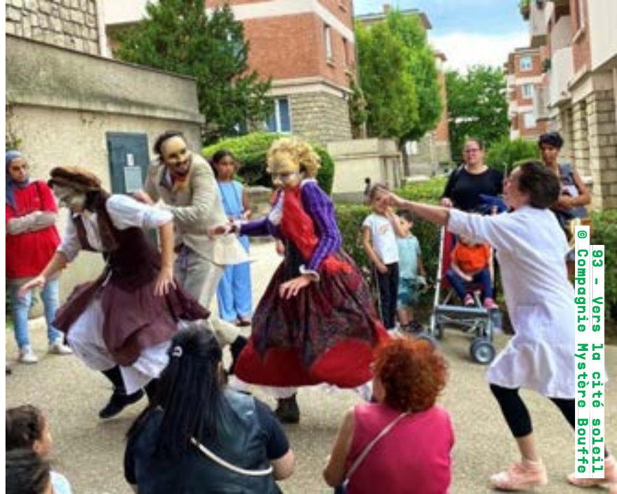
93 - Vers la cité soleil @ Compagnie Mystère Bouffe