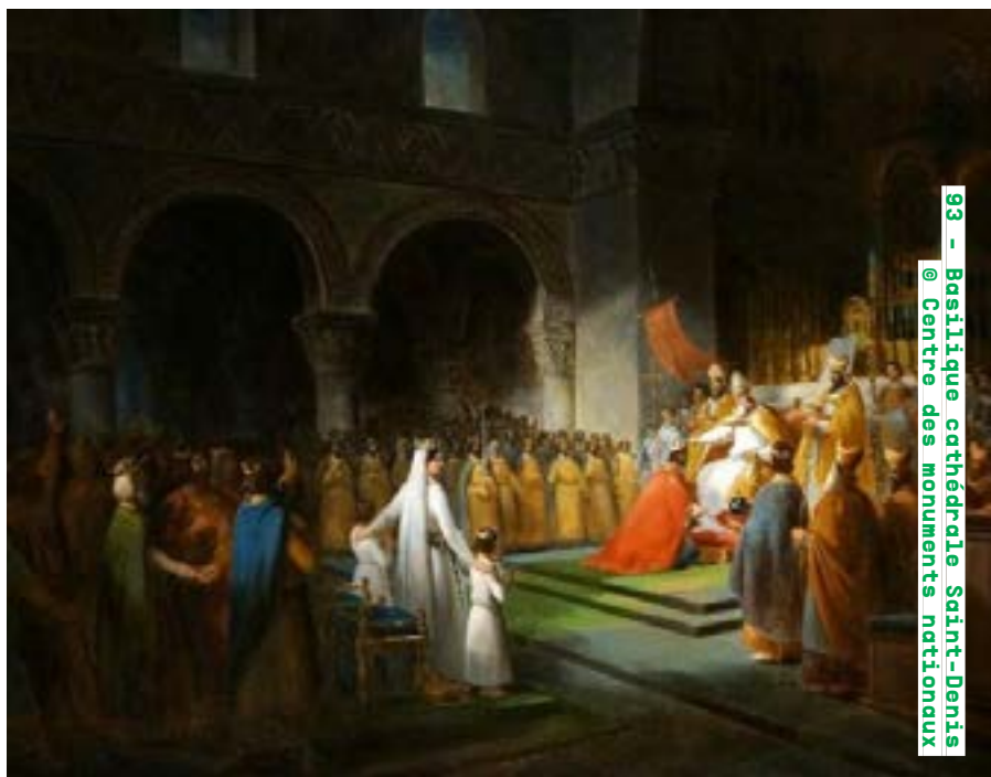
93 - Basilique cathédrale Saint-Denis