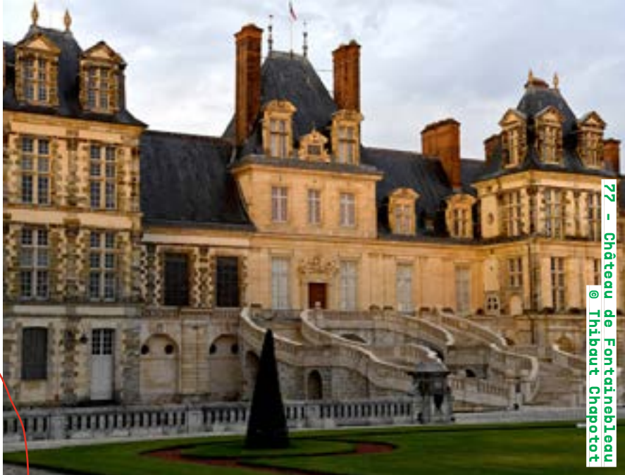
77 - Château de Fontainebleau