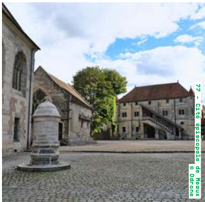
77 - Cité épiscopale de Meaux @ Odryone