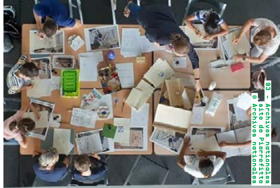
93 - Archives nationales site de Pierrefitte

Ateliers samedi de 14h à 18h macval.fr Détails de la programmation ici