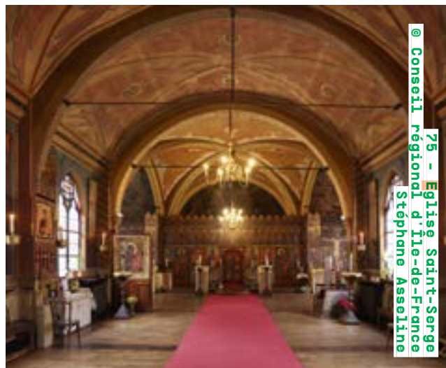
75 - Église Saint-Serge Conseil régional d'Ile-de-France Stéphane Asseline