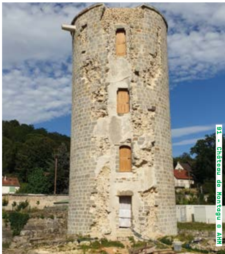
91 - Château de Montagu @ AHM