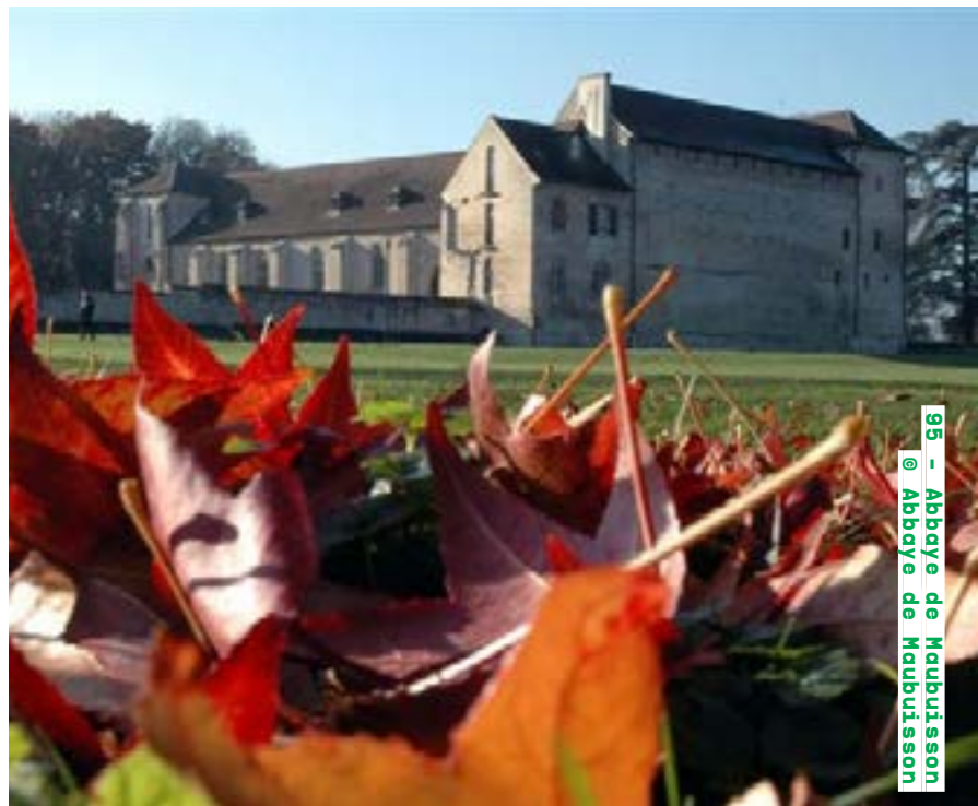
95 - Abbaye de Maubuisson