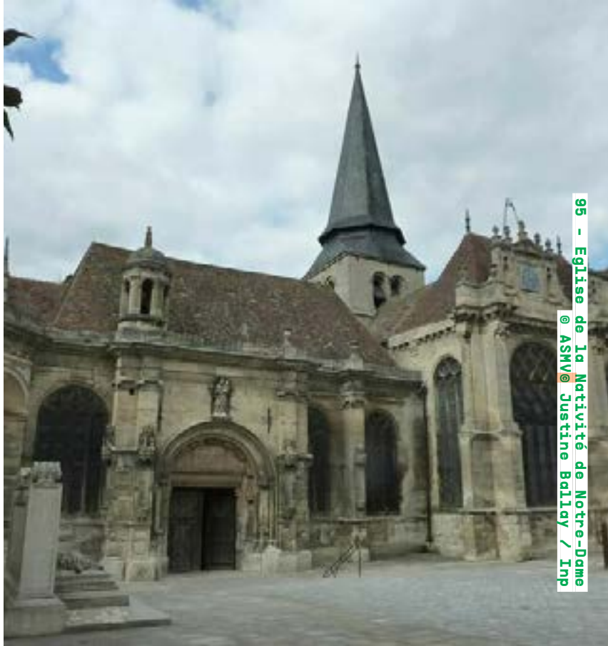
95 - Église de la Nativité de Notre-Dame