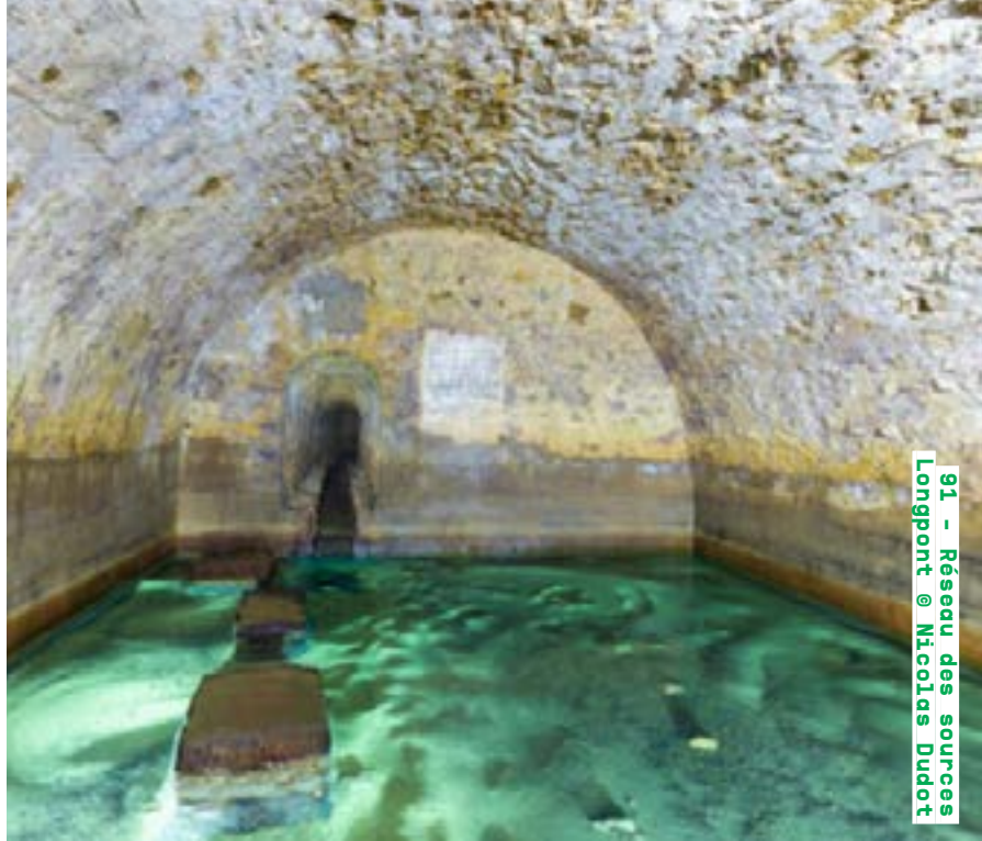
91 - Réseau des sources Longpont