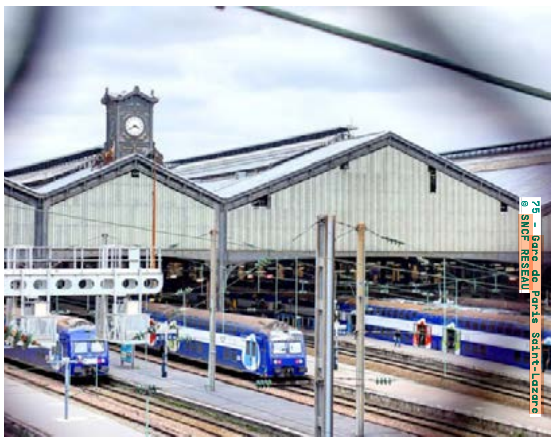
75 - Gare de Paris Saint-Lazare