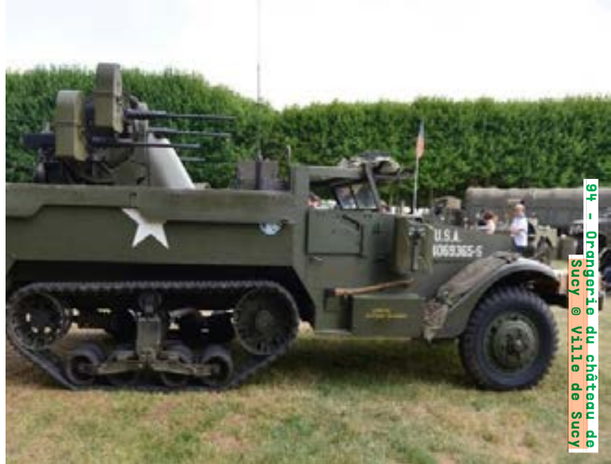
94 - Orangerie du château de Sucsy

Visites commentées samedi et dimanche de 11h30 à 17h20 (sur inscription) museeairespace.fr Détails de la programmation ici