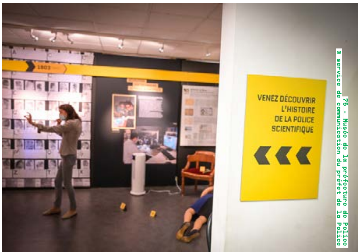
75 - Musée de la Préfecture de Police @ service de communication du préfet de la Police