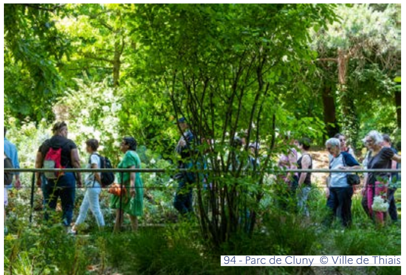
94 - Parc de Cluny