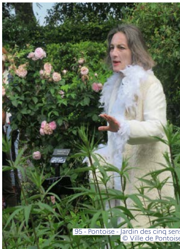
95 - Pontoise - Jardin des cinq sens