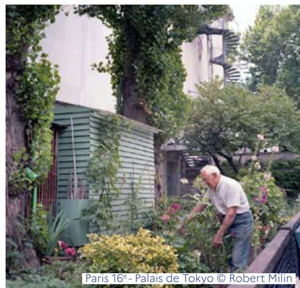
Paris 16 e - Palais de Tokyo

Visite libre du jardin - Vendredi de 13h à 21h, samedi de 15h à 21h30 et dimanche de 15h à 20h efran.cancilleria.gob.ar