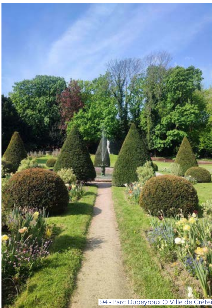
94 - Parc Dupeyroux