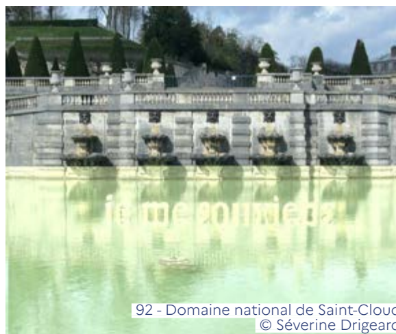
92 - Domaine national de Saint-Cloud