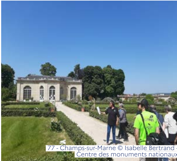
77 - Champs-sur-Marne

La beauté d'un jardin tient au travail attentif mené par les professionnels (jardiniers, fontainiers, paysagistes...). Lors des Rendez-vous aux jardins, les amateurs de jardins auront la possibilité d'échanger avec certains d'entre eux et de découvrir l'envers du décor.