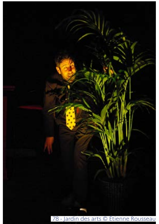
78 - Jardin des arts

https://mediatheques.saintgermainenlaye.fr