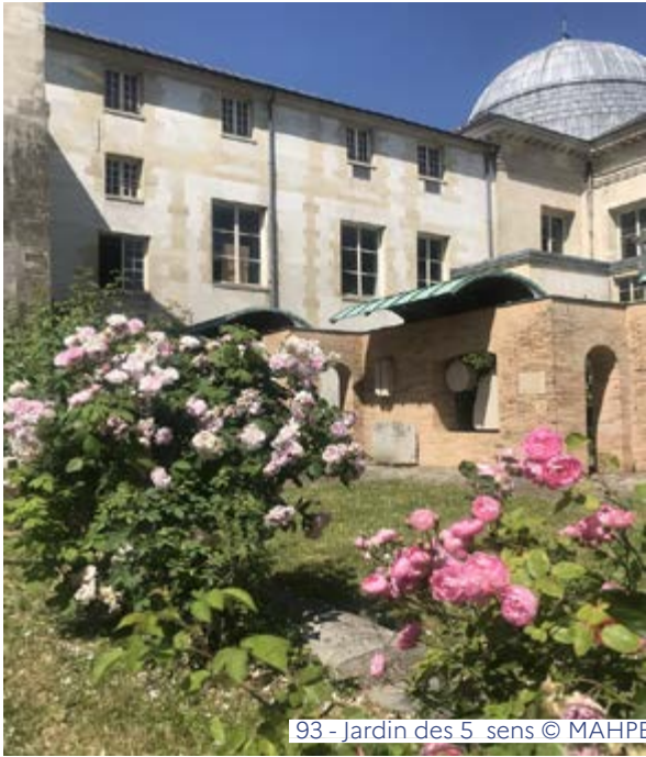
93 - Jardin des 5 sens