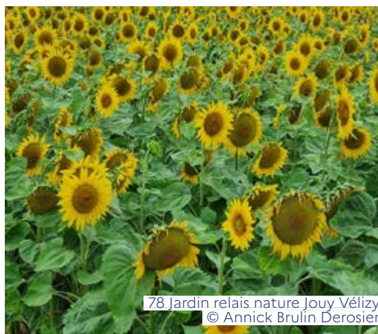
78 Jardin relais nature Jouy-Vélizy