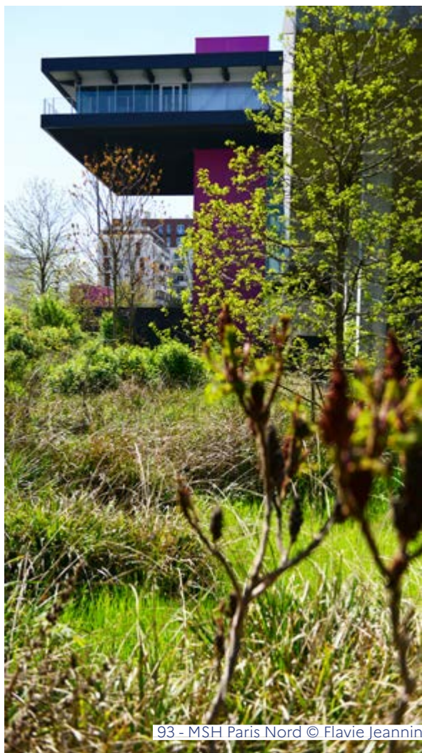
93 - MSH Paris Nord