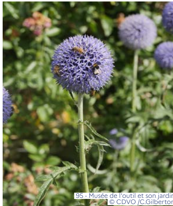
95 - Musée de l'outil et son jardin