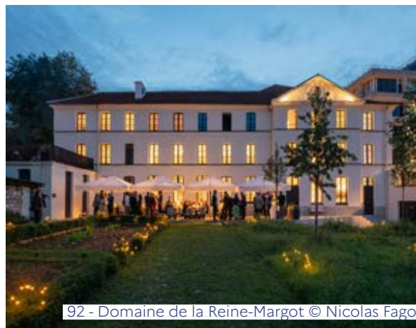
92 - Domaine de la Reine-Margot