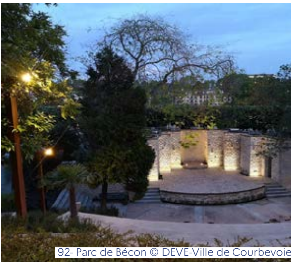
92- Parc de Bécon