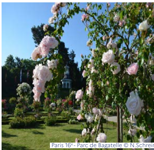
Paris 16 e - Parc de Bagatelle

Animations - Vendredi de 13h à 16h, RÉS. www.larecyclerie.com/