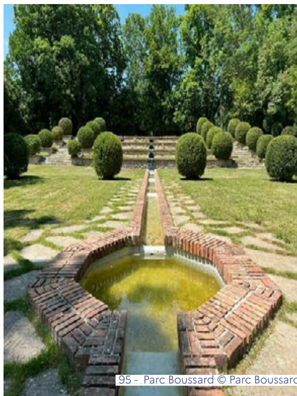
95 - Parc Boussard