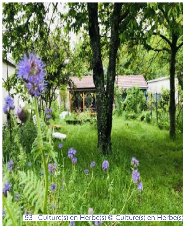
93 - Culture(s) en Herbe(s)

Jeu de piste - Dimanche de 15h à 17h www.culturesenherbes.org