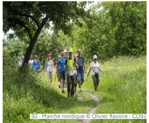
92 - Marche nordique

Sieste sonore - Samedi de 11h30 à 18h Enquête - Samedi de 14h à 18h, inscription sur place Concert au jardin - Dimanche de 14h à 17h Visite olfactive - Dimanche de 14h30 à 15h30, RÉS. Visite de l'exposition - Samedi et dimanche de 17h à 18h, inscription sur place albert-kahn.hauts-de-seine.fr