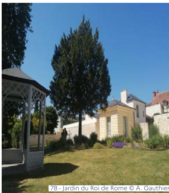
78 - Jardin du Roi de Rome