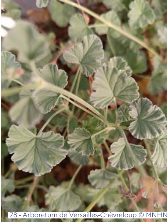
78 - Arboretum de Versailles-Chèvreloup