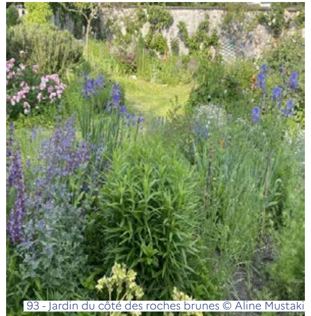
93 - Jardin du côté des roches brunes

Visite et troc de plantes - Samedi et dimanche de 10h à 18h