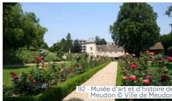
92 - Musée d'art et d'histoire de Meudon