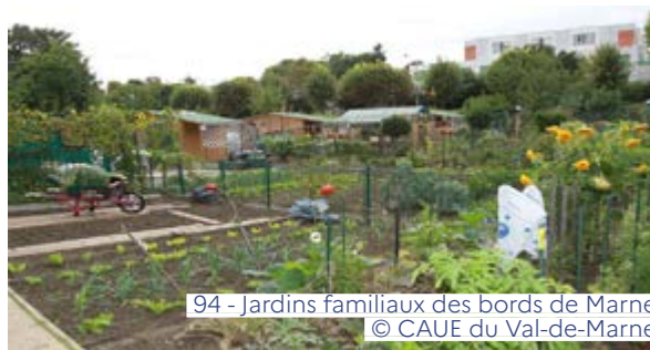
94 - Jardins familiaux des bords de Marne