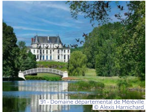
91 - Domaine départemental de Méréville © Alexis Harnichard