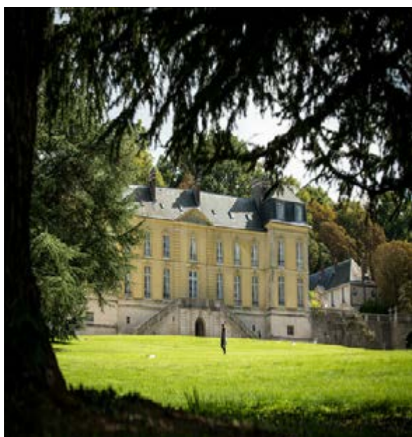
78 - Château de La Celle-Saint-Cloud

Carte blanche au conservatoire - Dimanche à 16h www.rambouillet-tourisme.fr