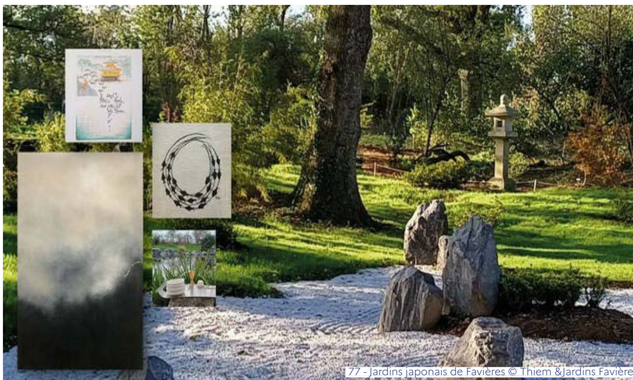
77 - Jardins japonais de Favières

www.briecomterobert.fr/points-interets/parc-francois-mitterrand/