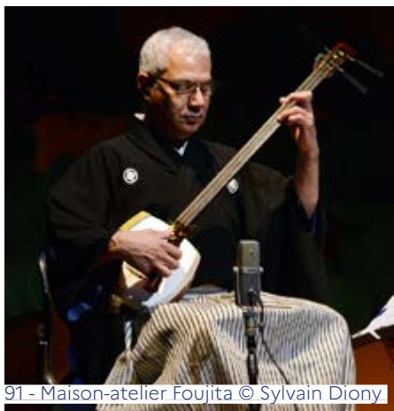
91 - Maison-atelier Fojita

« Interprétation des visites guidées en LSF », « Atelier d'art floral », « Atelier d'art plastique » etc. - Dimanche de 13h30 à 18h30 fojita.essonne.fr