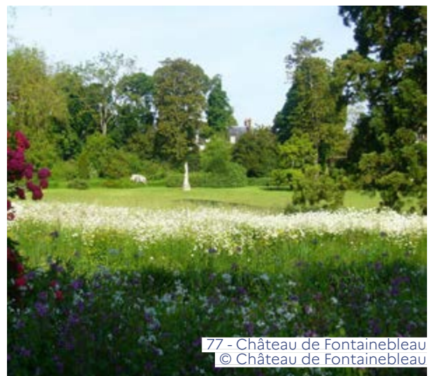
77 - Château de Fontainebleau