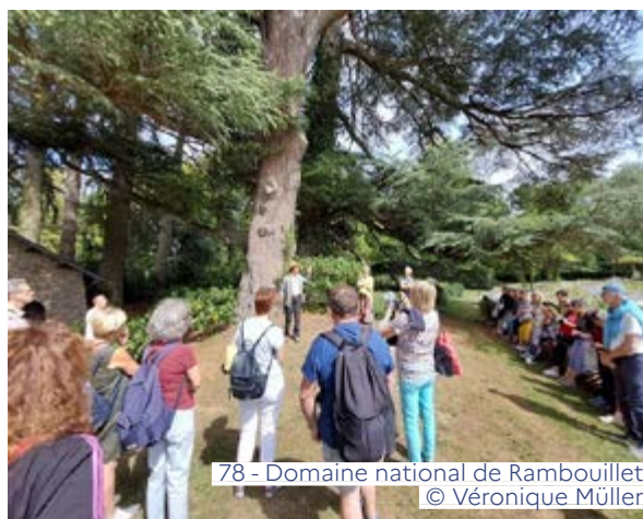
78 - Domaine national de Rambouillet