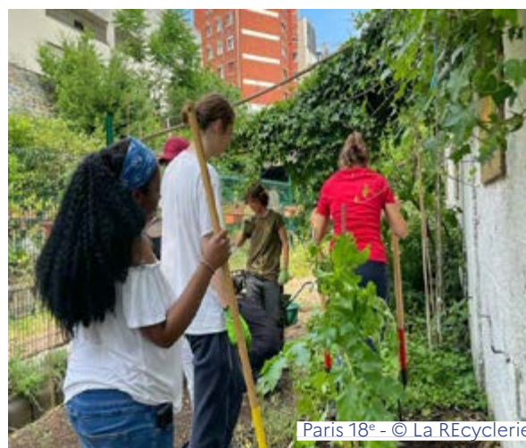
Paris 18 e