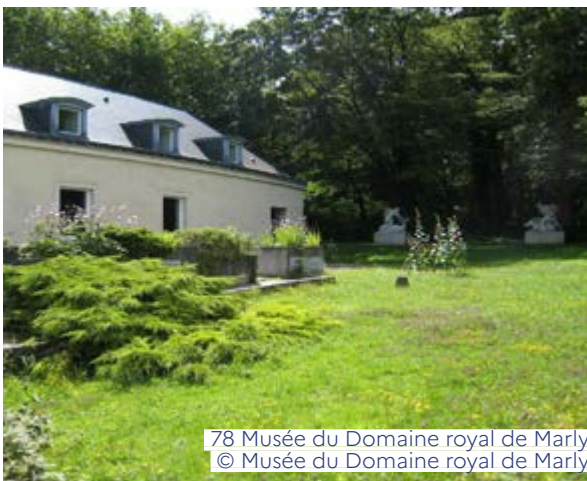
78 Musée du Domaine royal de Marly

Activité en continu samedi de 15h à 17h (Participation gratuite sur présentation du billet d'entrée à 5€) musee-domaine-marly.fr