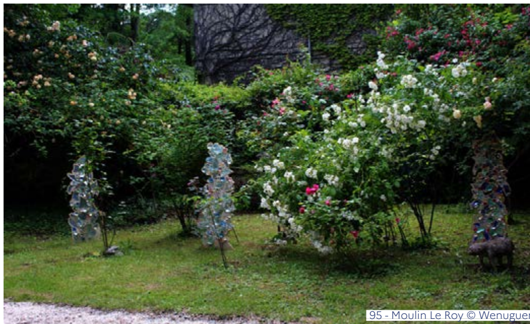
95 - Moulin Le Roy