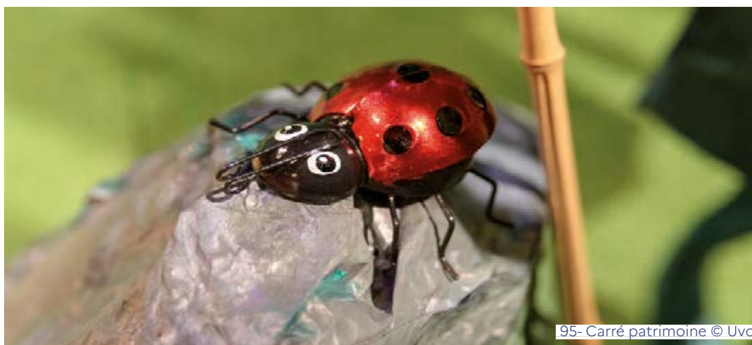
95- Carré patrimoine