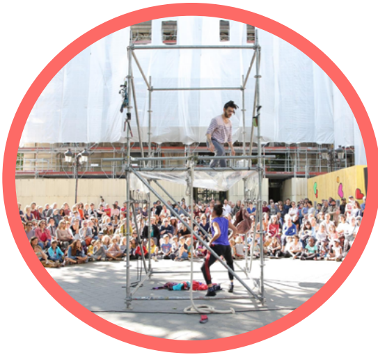
La Lisière © Compagnie Les Passagers