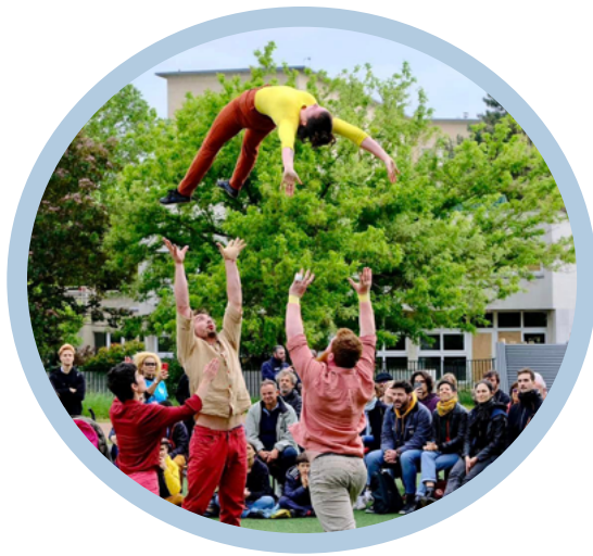
Les Noctambules - 3+1