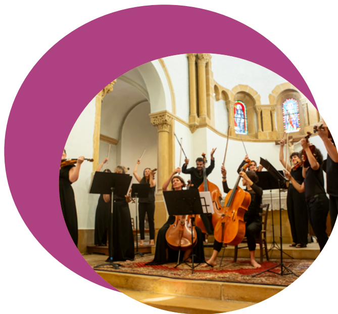
Dodeka - DodéK' à Vélo un Ensemble Tout-Terrain