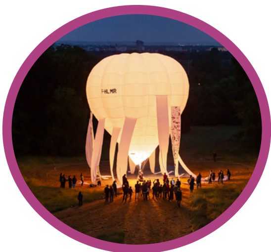
Terre, air, feu, Acte 2, Maxime Rossi, 2024