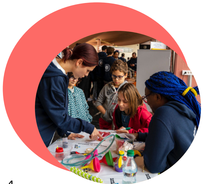
Cultures du Coeur - Cultive ta science et bouge ta culture