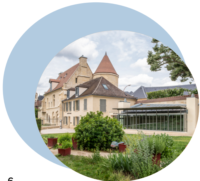
Musée du Jouet