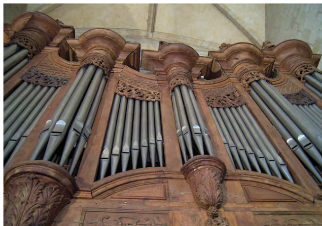
© GLL Église Saint-Pierre - Orgues 2006

Accès par petits groupes de quatre personnes, port du masque obligatoire