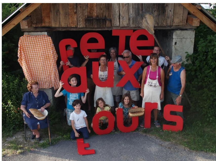
Ill. 9 a-c. Fête au four : écriture dans le paysage par les voisins de Broissieux (Bellecombe-en-Bauges), avec les lettres rouges de l'artiste Dimitri Vazemsky, lors de la résidence artistique Interparcs « Dire le traversé ». © Dimitri Vazemsky, juin 2019.