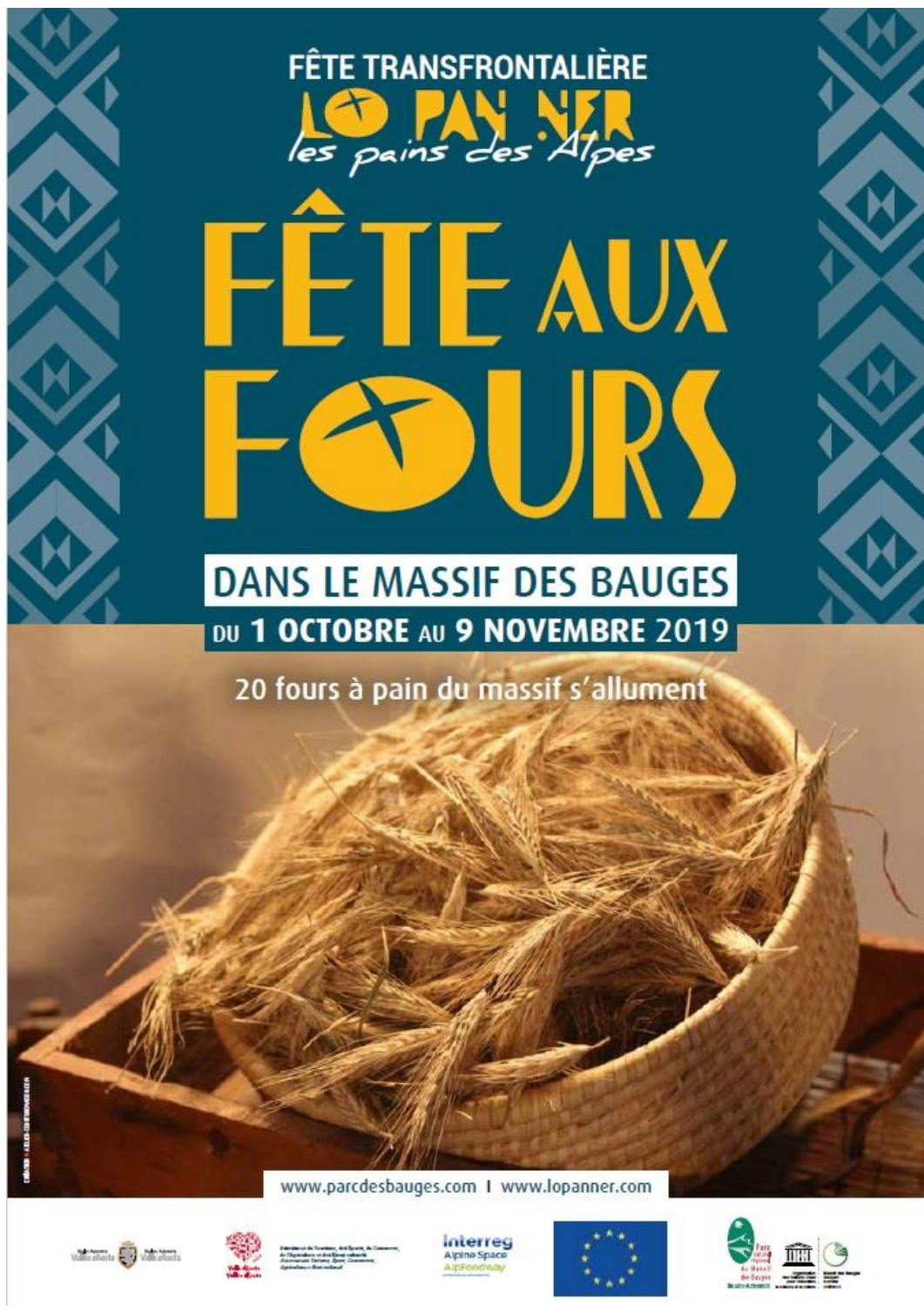
III. 13. Affiche de la « Fête aux fours » 2019.