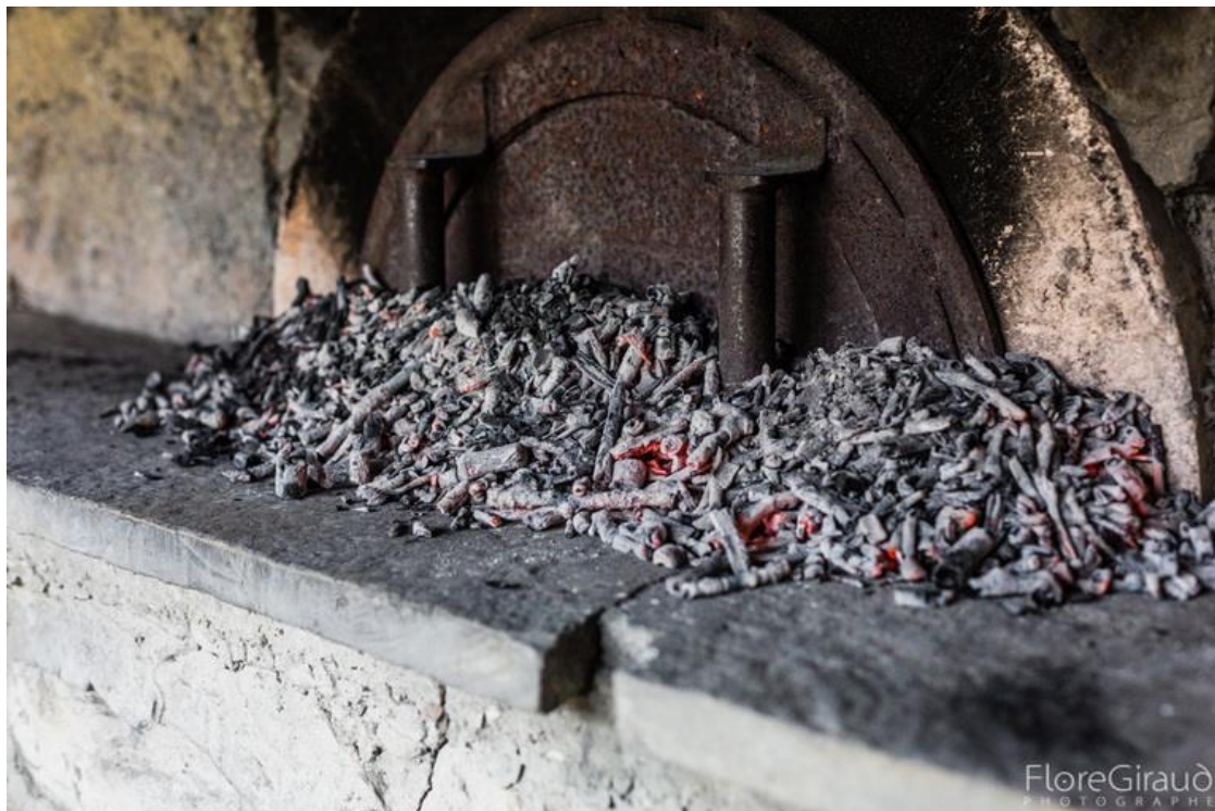
Ill. 2. Les braises sont placées devant la porte du four pour garder la chaleur, Curienne. © Flore Giraud, 28 avril 2017.

Ces étapes font l'objet de descriptions à la fois techniques et poétiques. La couleur de la voûte et la jetée de farine dans le four sont des indicateurs de la bonne chaleur et les secrets d'un savoir-faire complexe. « Quand on enfourne le pain, la chaleur du four est environ de 230 à 250°C. Le temps qu'on rentre tout le pain dans le four, ça redescend 220-230°C. Et quand le pain a fini de cuire, le four est à 180°C, donc il est prêt pour les brioches. Il faut toujours se dépêcher, surtout quand le four est juste chaud. Il faut fermer la porte derrière à chaque fois, il faut faire très vite. Le pain cuit pendant 45 minutes... ». Le « pana » est ensuite utilisé pour nettoyer le four après la chauffe.