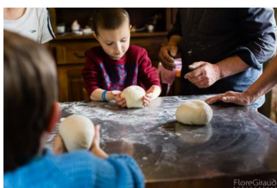
Mise en boule des « pâtons » : transmission de savoir-faire, à Curienne. © Flore Giraud, 28 avril 2017.