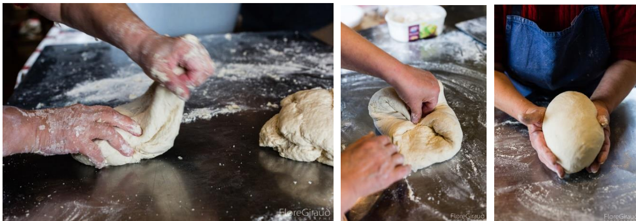
Ill. 1 a-c. Pétrissage et mise en boule de la pâte à pain, Curienne. © Flore Giraud, 28 avril 2017.

Le four est préparé, chauffé et nettoyé. Les pratiques du « faire au four » mobilisent des savoirs de la nature liés au bois, à l'exploitation de la forêt et aux essences d'arbres présents sur le massif, nécessaires notamment à la composition des fagots pour la chauffe du four. Les fagots utilisés pour chauffer le four sont appelés les « fascines », en patois : ils sont composés de noisetiers, de frêne, de taille d'arbres fruitiers. La préparation du four, la maîtrise du feu et le suivi de la température sont des aspects fondamentaux de la réussite de la fournée. Jean-Pierre Bulteau, de l'association « Les Fascines », décrit avec précisions les opérations de chauffe du four :