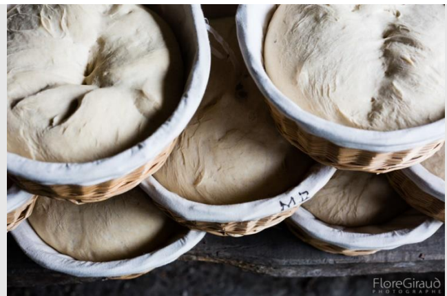
Ill. 5 a-b. Les pâtons reposent au chaud dans les paillas pour la seconde levée ; ils seront ensuite transportés près du four pour la cuisson. © Flore Giraud, 28 avril 2017.