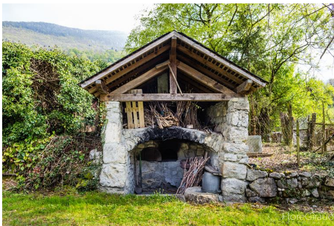
III. 4. Stockage des fagots (ou fascines) pour la prochaine fournée, Curienne. © Flore Giraud, 28 avril 2017.

Certaines communes, comme Faverges-Seythenex, en possédaient 22. La plupart des fours sont propriété des habitants du hameau (ex : Carlet à Jarsy, Machevaz à Saint-Jorioz, Combefolle à Saint-Jean-de-la-Porte) ; certains fours sont privés d'usage partagé (ex : Chambert à Quintal, etc.) ; d'autres fours sont privés, d'usage privé (ex : Les Monts à Héry-sur-Alby). La plupart des fours sont dans un bâtiment spécifique, mais ils peuvent être inclus dans un bâtiment ayant un autre usage , à l'exemple du château de Dhéré à Duingt. À Francin, il y a deux fours dans un même bâtiment au chef-lieu et, autrefois, un boulanger était salarié par l'ensemble des habitants.