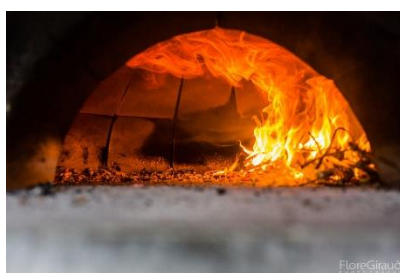
Chauffe du four. © Flore Giraud, 28 avril 2017.