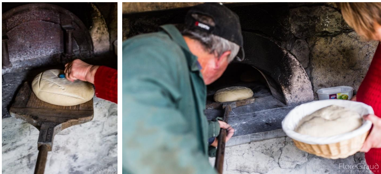
Ill. 6 a-b. Incision des pâtons avec une lame, et mise au four. © Flore Giraud, 28 avril 2017.

Elle sert à inciser les pâtons, et dans certains cas à « marquer » le pain, pour une coupe bien nette, afin que le gonflement pendant la cuisson se fasse sans déformer le pain. Autrefois, on pouvait aussi utiliser un simple couteau pour inscrire la marque correspondant à la famille à laquelle il était destiné.