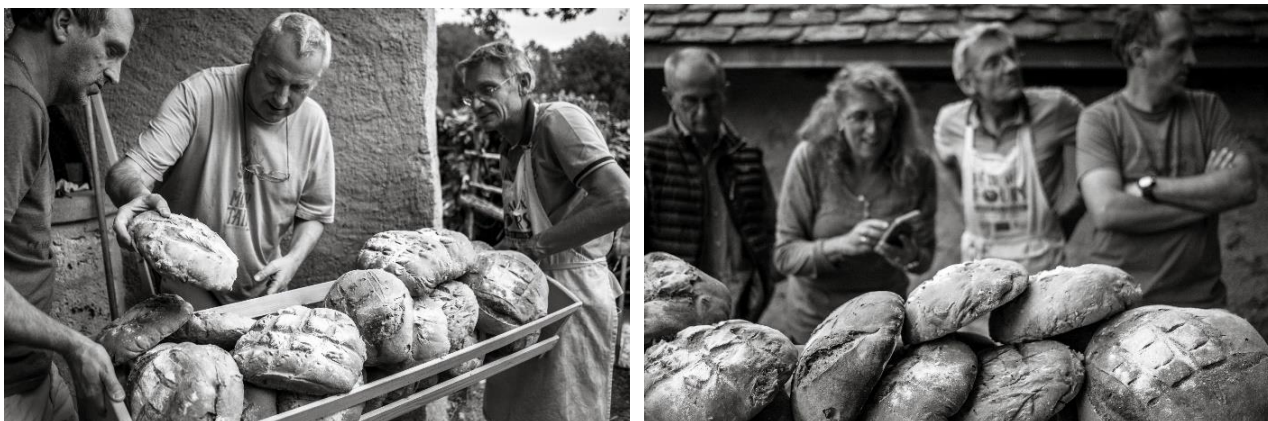
Ill. 10 a-d. Fête au four des Piffets, à Plancherine (Savoie), octobre 2019. © Stéphane Grasset, 6 octobre 2019.