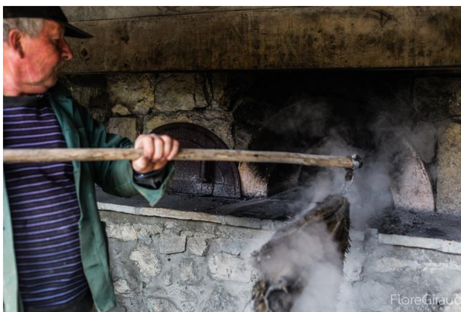
Ill. 3. Nettoyage des cendres avec la panasse ou pana, Curienne. © Flore Giraud, 28 avril 2017.

Ces étapes font l'objet de descriptions à la fois techniques et poétiques. La couleur de la voûte et la jetée de farine dans le four sont des indicateurs de la bonne chaleur et les secrets d'un savoir-faire complexe. « Quand on enfourne le pain, la chaleur du four est environ de 230 à 250°C. Le temps qu'on rentre tout le pain dans le four, ça redescend 220-230°C. Et quand le pain a fini de cuire, le four est à 180°C, donc il est prêt pour les brioches. Il faut toujours se dépêcher, surtout quand le four est juste chaud. Il faut fermer la porte derrière à chaque fois, il faut faire très vite. Le pain cuit pendant 45 minutes... ». Le « pana » est ensuite utilisé pour nettoyer le four après la chauffe.