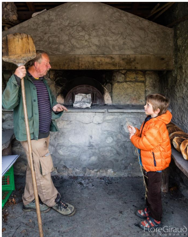
III. 8. Transmission intergénérationnelle près du four. © Flore Giraud, 28 avril 2017.

La pratique de fabrication traditionnelle du pain vit et évolue aussi au sein du milieu professionnel. Le cas de la Boulangerie savoyarde, à École dans le cœur du massif, créée en 1976, incarne une vision stratégique d'un développement durable enraciné dans une histoire et des traditions locales. Créée par Patrick Le Port, la boulangerie d'École est aujourd'hui une entreprise à échelle nationale. Elle contribue à la sauvegarde d'une pratique de panification dans le respect de l'environnement et de traditions de la montagne. En témoigne Pierre Bouvet, salarié de la boulangerie :