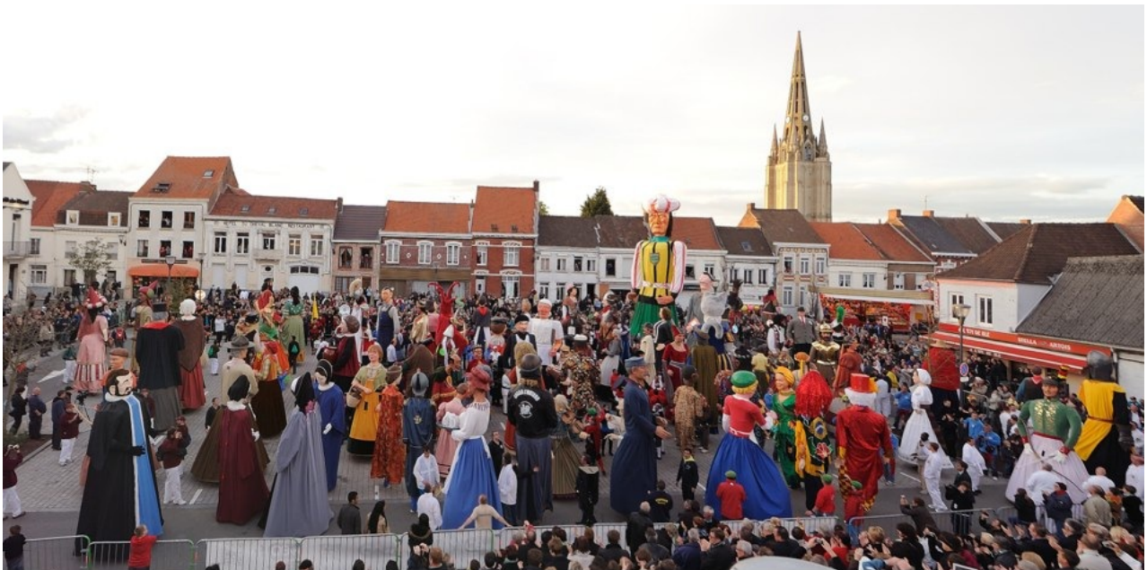
Ronde européenne des géants, fonds des amis de Fromulus

Les amis de Fromulus ont créé ces rassemblements afin de promouvoir les géants portés. "Un géant non porté ne danse pas, donc il ne vit pas" est le credo de l'association qui, à la fin des années 1980, déplorait que les géants sur roulettes soient de plus en plus nombreux et que l'on trouve de moins en moins de porteurs.