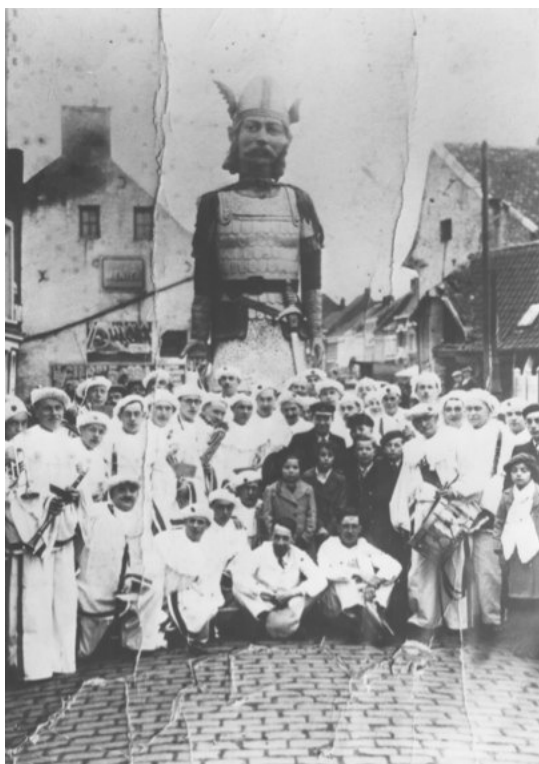
Jean le Bûcheron, photographie datant du début du XX e siècle