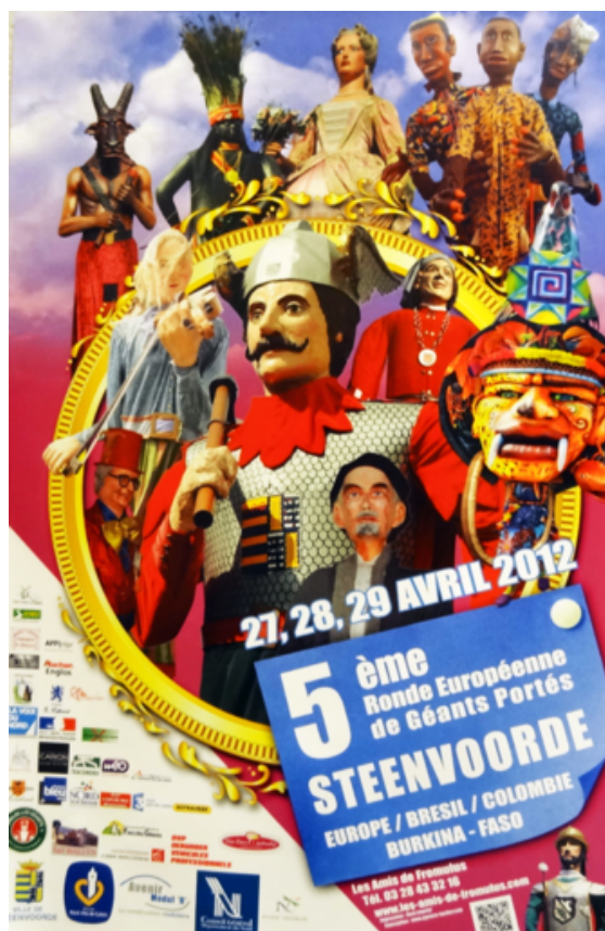
Affiches, fonds des Amis de Fromulus