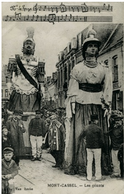
Carte postale ancienne, géants à Cassel