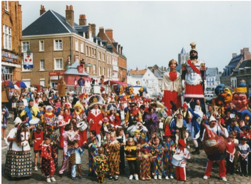
Carnaval de Cassel

Au-delà, aller voir danser les géants, c'est surtout se retrouver, partager un moment privilégié avec des amis ou avec sa famille.