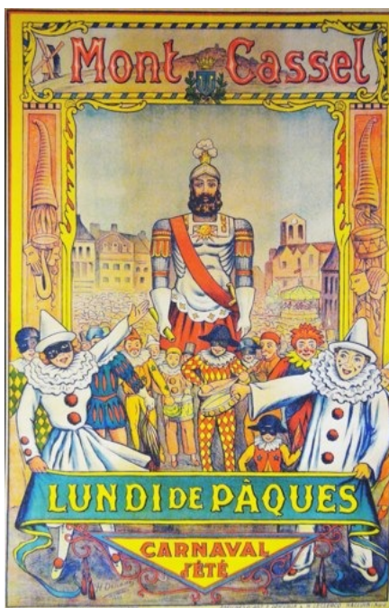
Affiche ancienne du carnaval de Cassel

La ducasse (kermesse) est installée sur la grand place, avec ses manèges, ses marchands de gaufres et de frites.