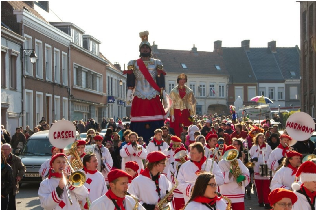
Carnaval de Cassel, Reuze Papa et Reuze Maman