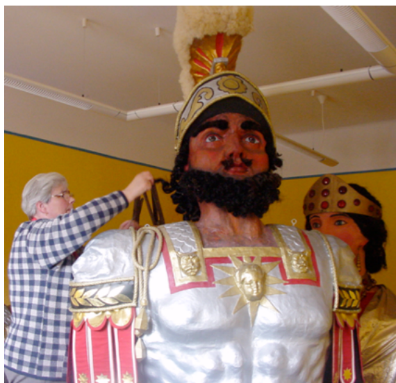
Préparation des géants, Cassel