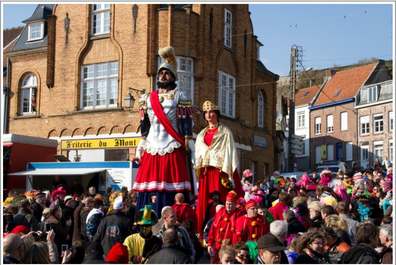
Carnaval de Cassel, Reuze Papa et Reuze Maman

Vidéos et diaporama photos du carnaval de Cassel avec les géants Reuze Papa et Reuze Maman dans la Géantheque de la Ronde des Géants : www.geantheque.org/les_geants/59_cassel/reuze_papa/reuze_papa_de_cassel.php www.geantheque.org/les_geants/59_cassel/reuze_maman/reuze_maman_de_cassel.php