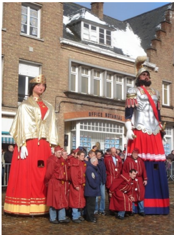
Géants et porteurs à Cassel

Le rotin est un matériau importé. La qualité et la variété des osiers ne sont plus les mêmes qu'il y a une trentaine d'années et il y a des difficultés d'approvisionnement pour trouver des osiers de forte section et de grande longueur produits dans la région, convenant bien à la réalisation des structures de géants. Il faut donc parfois utiliser des osiers qui sont importés. Il devient aussi difficile de se procurer les tissus adaptés à la réalisation des costumes des géants du fait de la disparition de l'industrie textile et des magasins d'usine dans le nord de la France.