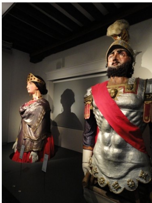
Géants au Musée de Flandre à Cassel