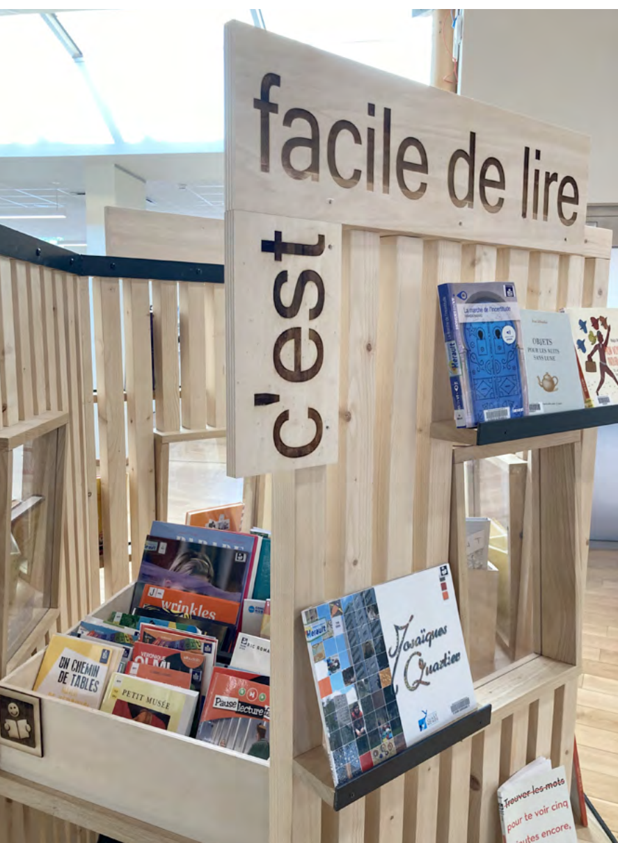
Médiathèque Confluence – Lodève

Une responsable d'un centre de conservation et de restauration en bibliothèque municipale