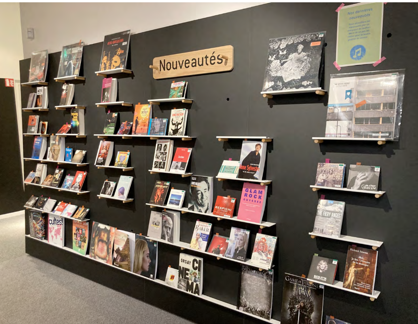
Bibliothèque Les Champs Libres – Rennes

Une chargée de contenu rédactionnel et iconographique en bibliothèque municipale