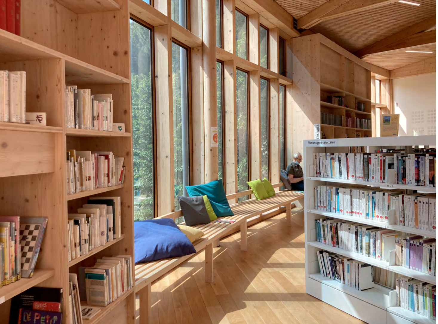
Médiathèque Confluence – Lodève

fonction des notes obtenues au concours, et en tenant compte des préférences exprimées. Ce mode de recrutement garantit d'être affecté à un poste, mais le lieu d'affectation n'est pas forcément conforme aux vœux exprimés. A noter, les lauréats du concours de conservateur d'État sont nommés conservateurs stagiaires et suivent une formation rémunérée de 18 mois avant de pouvoir émettre leurs vœux d'affectation. Les lauréats du concours de bibliothécaires sont nommés bibliothécaires stagiaires, affectés à un établissement et suivent une formation rémunérée de 6 mois à l'Enssib.