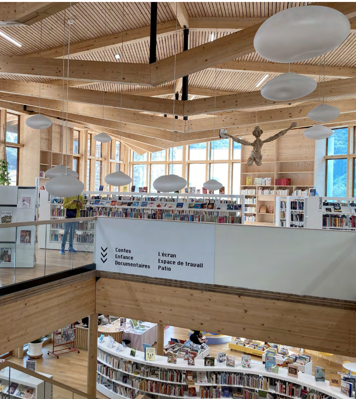
Médiathèque Confluence – Lodève

Si vous avez trouvé un emploi en bibliothèque et que vous souhaitez mieux connaître les droits comme les obligations statutaires de formation, identifier les acteurs de la formation et repérer la documentation et les journées professionnelles, vous pouvez maintenant consulter le guide La formation tout au long de la vie des professionnels des bibliothèques .