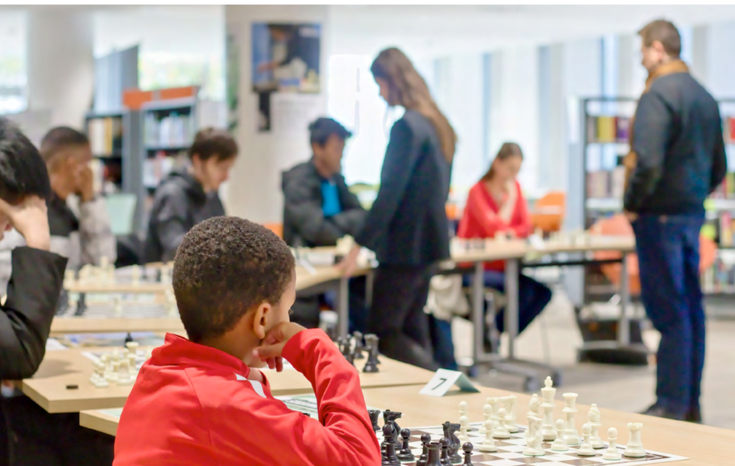
Bibliothèque universitaire Edgar Morin – Villetaneuse

A noter, chaque centre de gestion, situé à l'échelle départementale (sauf en Ile-de-France où il existe deux centres interdépartementaux de gestion), définit le nombre de places ouvertes pour chaque concours, correspondant aux besoins identifiés par les collectivités sur le territoire qu'il dessert. Si aucun besoin n'est identifié, un centre de gestion peut ne pas organiser de concours. Pour s'inscrire à un concours, il faut donc choisir un centre de gestion qui en organise. Le candidat se trouvera en concurrence avec les autres candidats inscrits localement, en fonction du nombre de places ouvertes par ce centre de gestion. Cependant les dates et épreuves de concours sont les