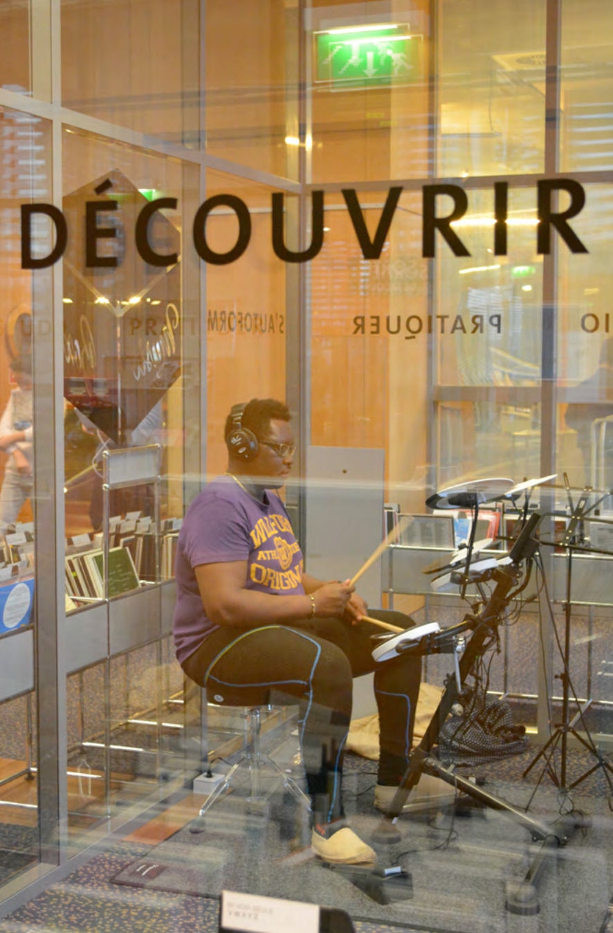
Médiathèque J. Cabanis – Toulouse