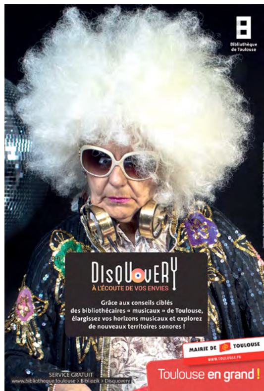
Médiathèque J. Cabanis – Toulouse

Une directrice de bibliothèque municipale