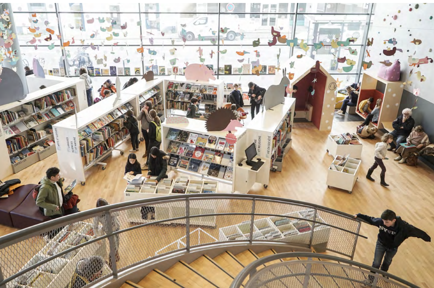
Bibliothèque Champs Libres – Rennes

Description : cette formation, organisée par certaines délégations régionales de l'Abf, comprend 200 h de cours théoriques, travaux pratiques, stages et visites de bibliothèques. Les cours ont généralement