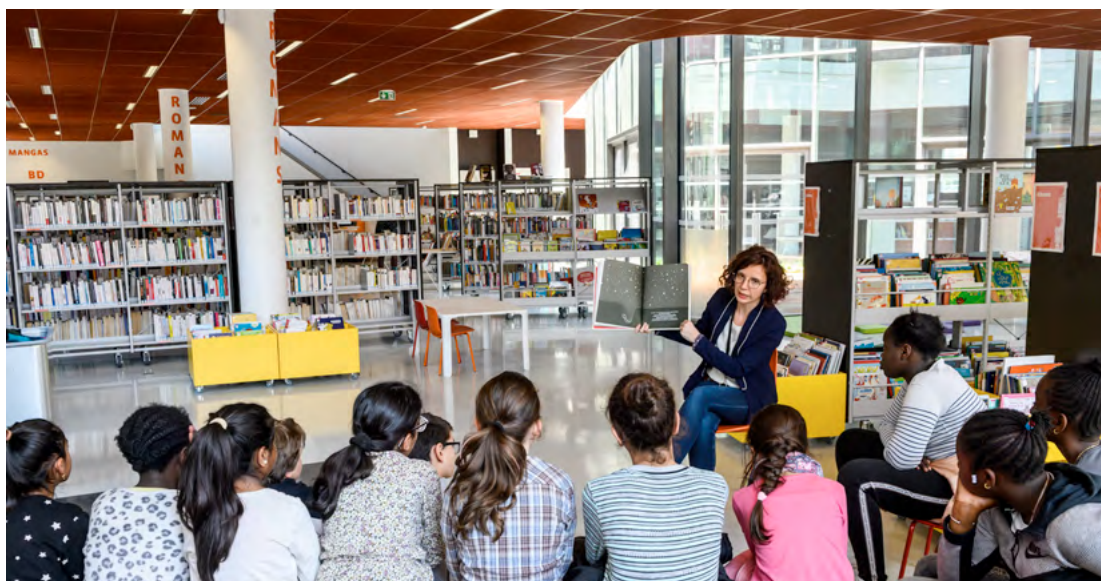
Réseau des médiathèques de Plaine Commune