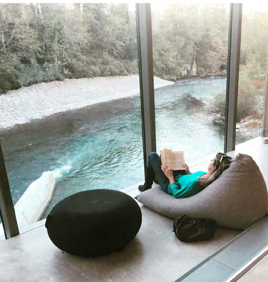
Médiathèque des Gaves – Oloron-Sainte-Marie

Ce sont des lieux vivants, riches d'expériences humaines, stimulants pour la connaissance et les imaginaires, inclusifs, grands ouverts sur la diversité des personnes et des savoirs, bouillonnants d'initiatives et d'expérimentations, sensibles aux enjeux de société. Ils offrent des métiers passionnants et utiles, au sein desquels on apprend beaucoup et où l'on peut évoluer sur une très grande diversité de missions.