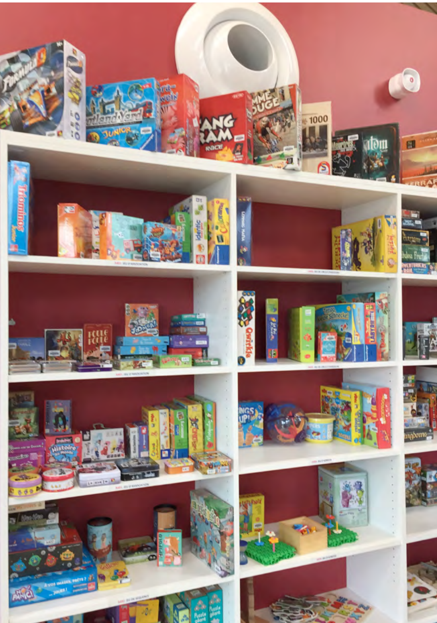
Médiathèque – ludothèque Les Granges – St Jean – Photo Charlotte Henard CC-BY-SA

La Ville de Paris organise ses propres concours pour recruter ses personnels de bibliothèque de catégorie C et B. Pour les concours de catégorie A, elle propose chaque année des postes aux concours d'État de conservateur des bibliothèques et de bibliothécaire. Elle peut recruter par voie de détachement des fonctionnaires territoriaux et d'État.