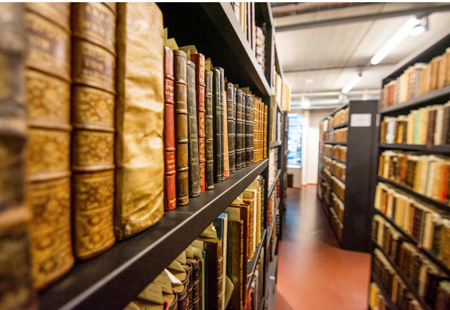
Médiathèque F. Mitterrand - Les Capucins - Brest