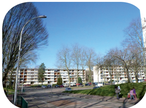
PHOTO DU VAL DE L'AURENCE