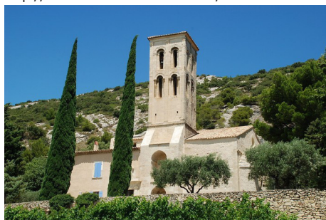
Notre-Dame d'Aubune