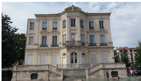
Avignon CCI

Animations : Visite commentée. samedi 21/09 et dimanche 22/09 - 9h à 11h/14h à 16h