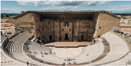
Théâtre antique

Tél : 04 90 34 70 88 - http://www.orange-tourisme.fr et http://www.theatre-antique.com