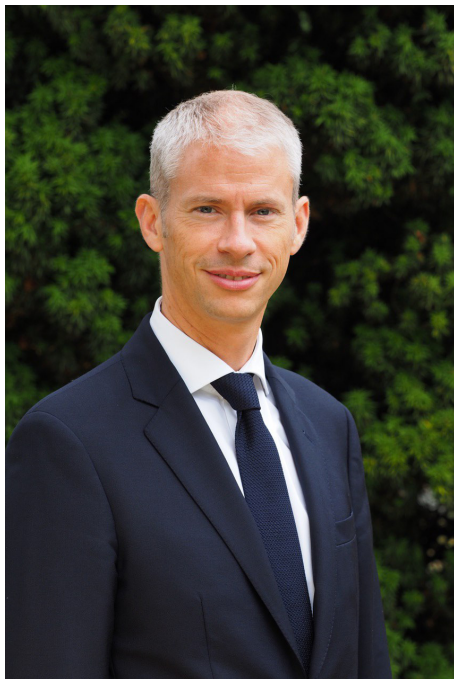
Franck Riester