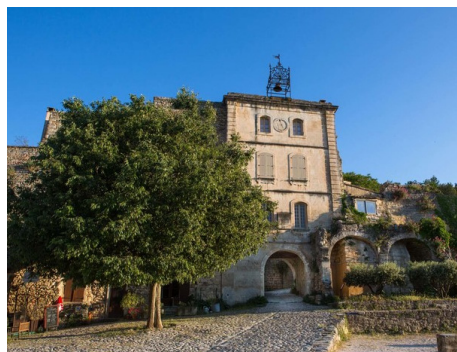
Oppède-le-vieux cluedo

Animations : Visite commentée. dimanche 22/09 - 10h à 12h. 30 personnes max. Âge min. 6ans