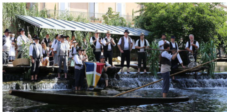
Pescaire Lilien