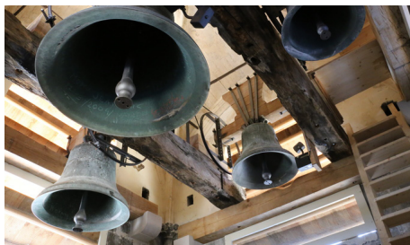
Isle-sur-la-Sorgue Collegiale © direction patrimoine

http://www.patrimoine.islesurlasorgue.fr