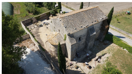
Chapelle de Velorgues

Animations : Visite commentée. dimanche 22/09 - 14h30 à 15h30.