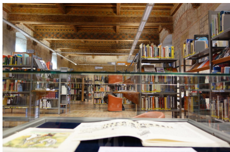
Avignon Ceccano

Animations : Animation Jeune public. samedi 21 et dimanche 22/09 - 15h à 16h. Groupes de 12 enfants max, durée 1h, Âge min. 6ans