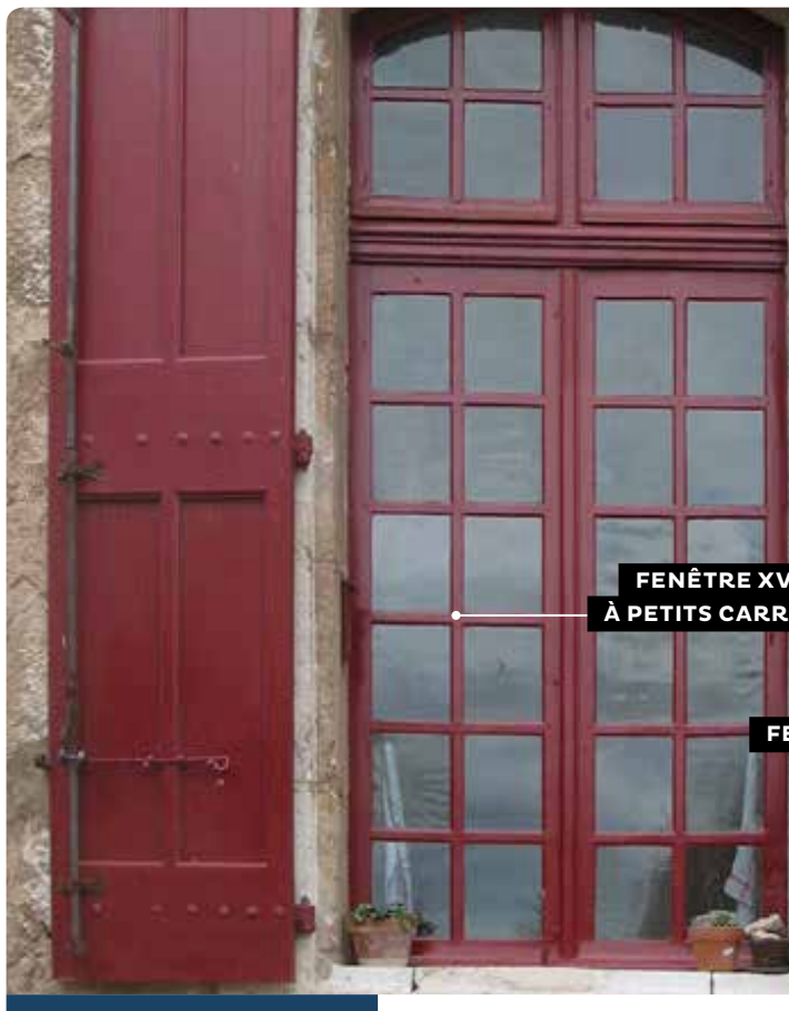
FENÊTRE XVIII° À PETITS CARREAUX