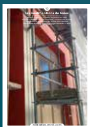
13 les modifications de baies