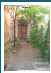
09 les portes