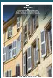
08 les volets