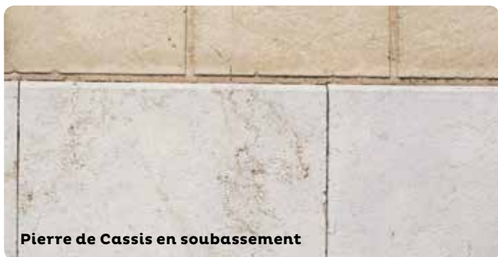
Pierre de Cassis en soubassement

capillarité dans les murs, les dépôts blanchâtres de salpêtre peuvent être retirés au moyen de compresses d'argile et de cellulose.