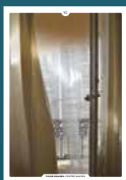
15 le confort thermique

Chaque intervention sur les façades de nos centres anciens compte et participe à l'harmonie du paysage urbain. Au cœur de nos villes et villages, l'intérêt particulier et l'intérêt général doivent être conjugués pour créer le cadre de vie que nous y recherchons tous.