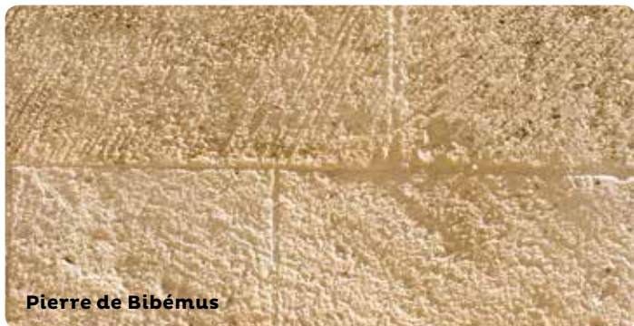
Pierre de Bibémus