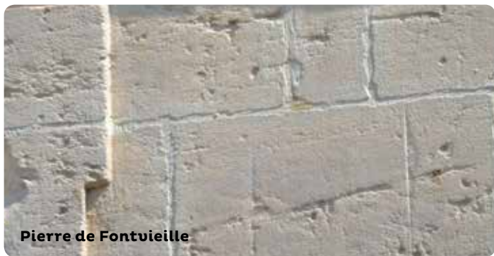
Pierre de Fontvieille