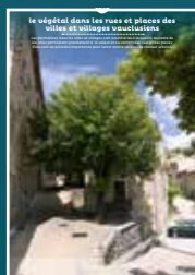
EP-034 le végétal dans les villes et villages vaclusiens

Au coeur de nos villes et villages, l'intérêt particulier et l'intérêt général doivent être conjugués pour créer le cadre de vie que nous y recherchons tous.