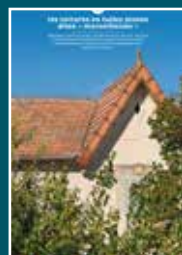
16 les toitures en tuiles plates