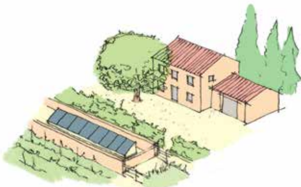
Les panneaux peuvent être posés au sol sur le terrain