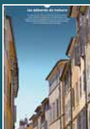
06 les débords de toiture