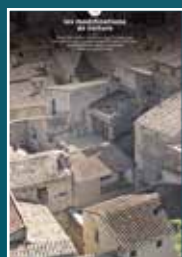
14 les modifications de toiture