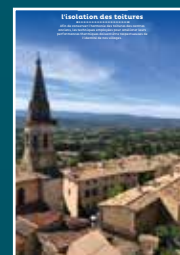
E-01 l'isolation des toitures

Chaque intervention sur les bâtiments de nos centres anciens compte et participe à l'harmonie du paysage urbain. Au cœur de nos villes et villages, l'intérêt particulier et l'intérêt général doivent être conjugués pour créer le cadre de vie que nous y recherchons tous.