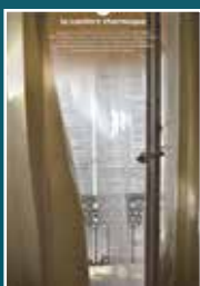
15 le confort thermique