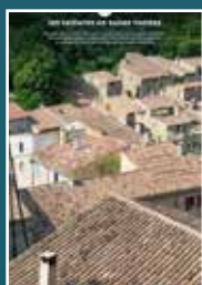
05 les toitures en tuiles rondes